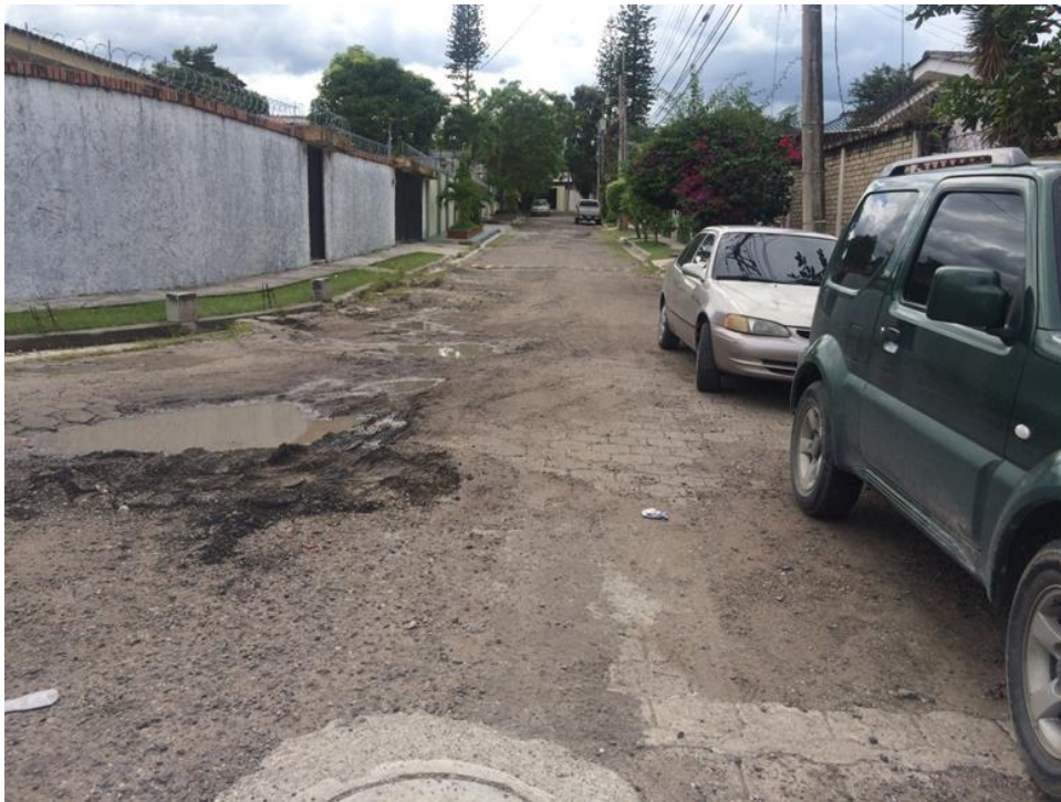
VISTA PANORAMICA DE CALLE A PAVIMENTAR