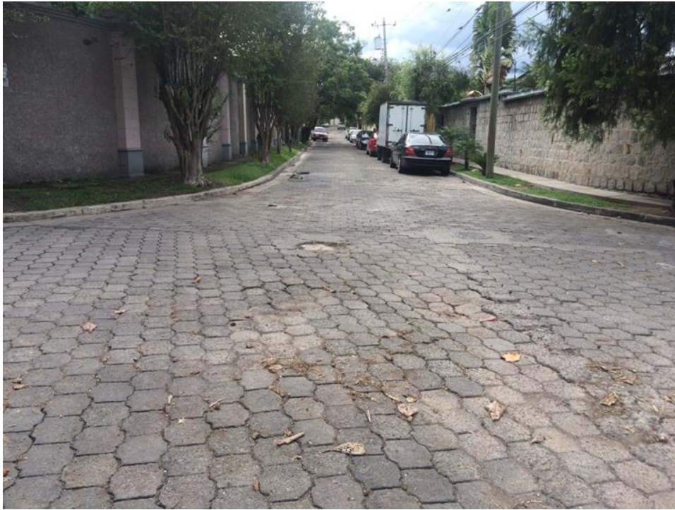
VISTA DE ESTADO ACTUAL DE CALLE DE ADOQUIN

Proyecto: Pavimentación de calle con concreto hidráulico, col. Los Ángeles, calle Sacramento Código: 1398