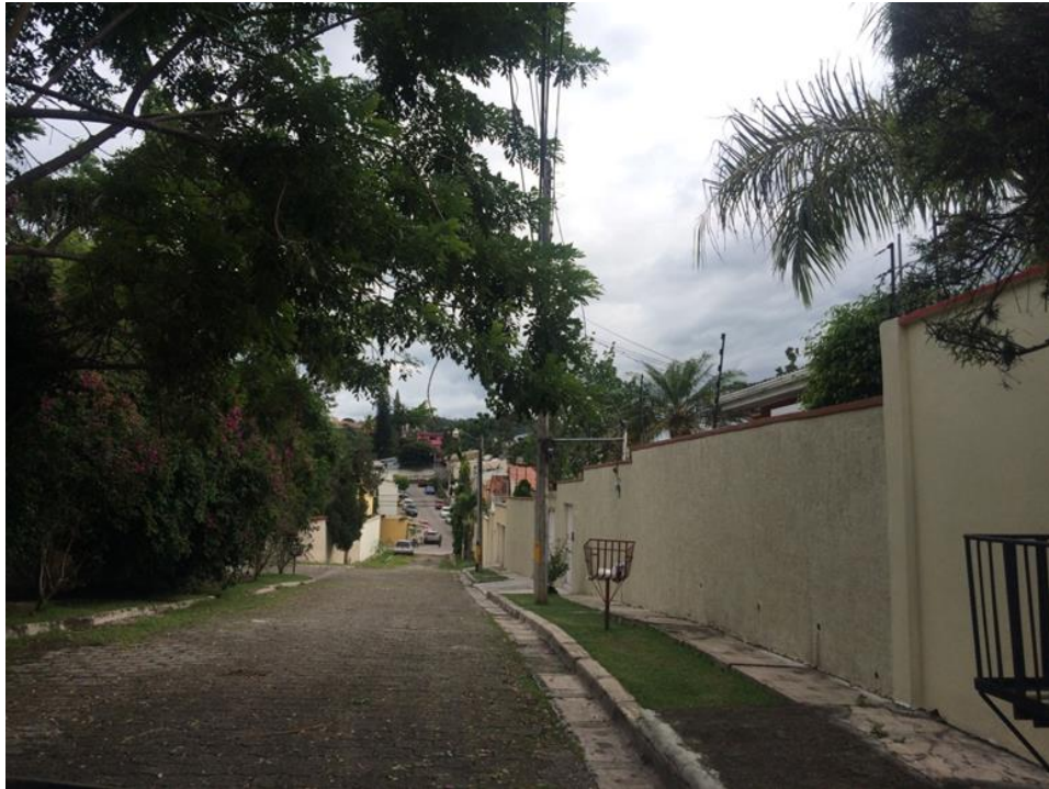
VISTA PANORAMICA DE CALLE A PAVIMENTAR

Proyecto: Pavimentación de calle con concreto hidráulico, col. Los Ángeles, calle Sacramento Código: 1398