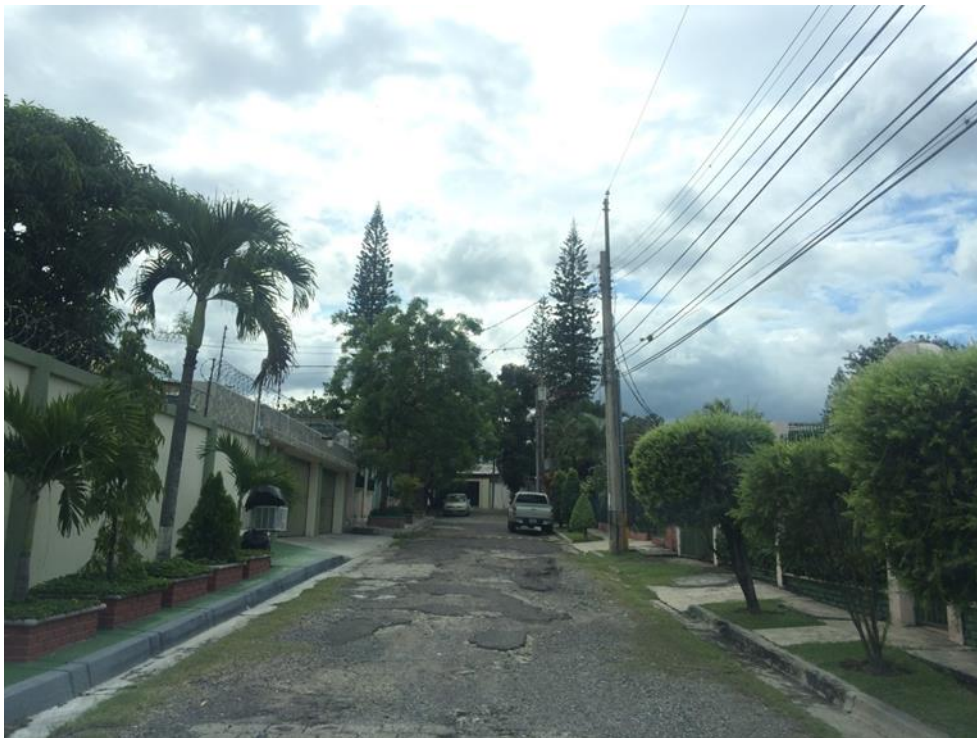
VISTA ESTADO ACTUAL DE CALLE A PAVIMENTAR