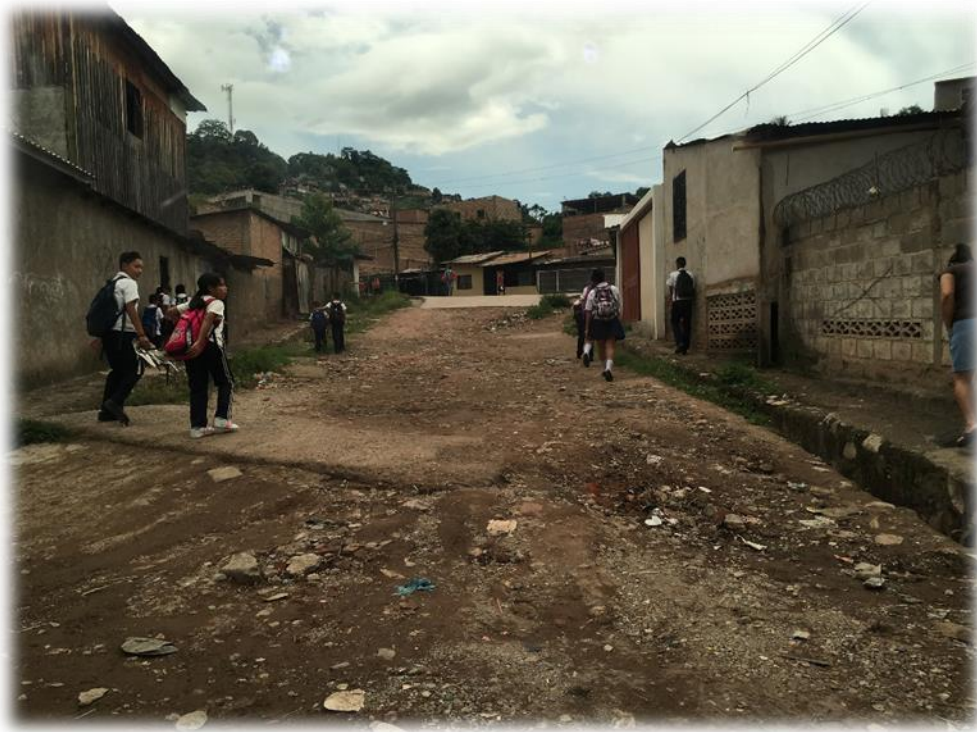
VISTA DE CALLE A PAVIMENTAR. TRAMO B.

Proyecto: Pavimentación de calle con concreto hidráulico, barrio Las Crucitas segunda calle Código: 1261