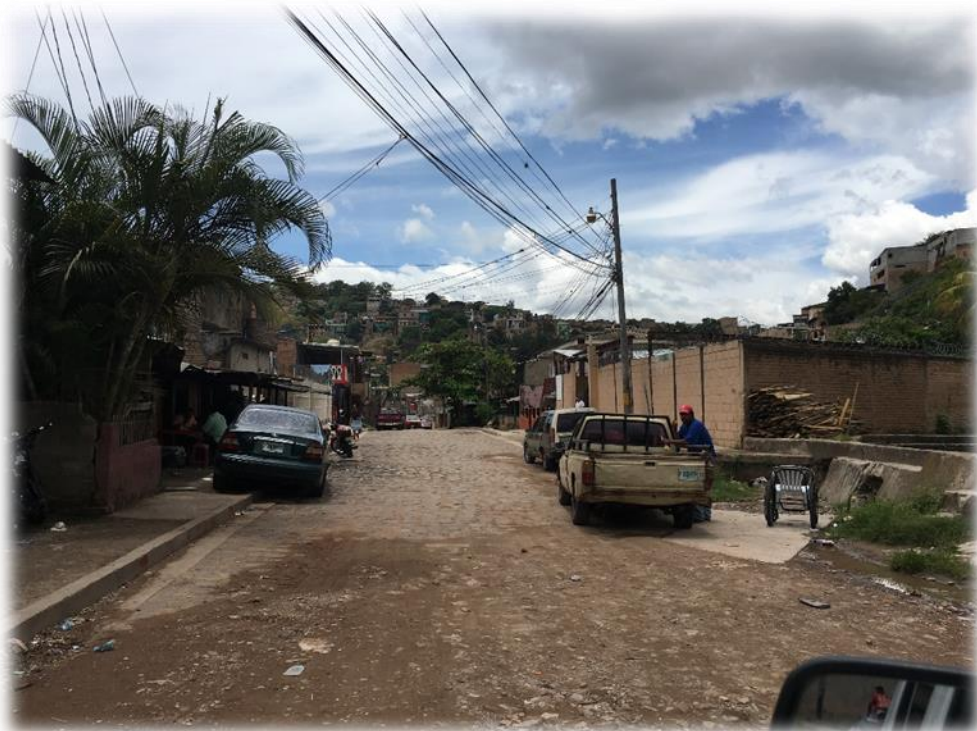
INICIO DE WHITE TOPPING. TRAMO C.