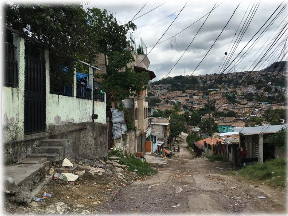
FINAL DE PAVIMENTACIÓN CON CONCRETO HIDRAULICO, TRAMO A.