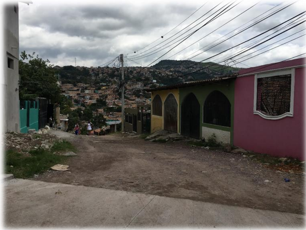
INICIO DE PAVIMENTACION CON CONCRETO HIDRAULICO, TRAMO A.

Proyecto: Pavimentación de calle con concreto hidráulico, barrio Las Crucitas segunda calle Código: 1261