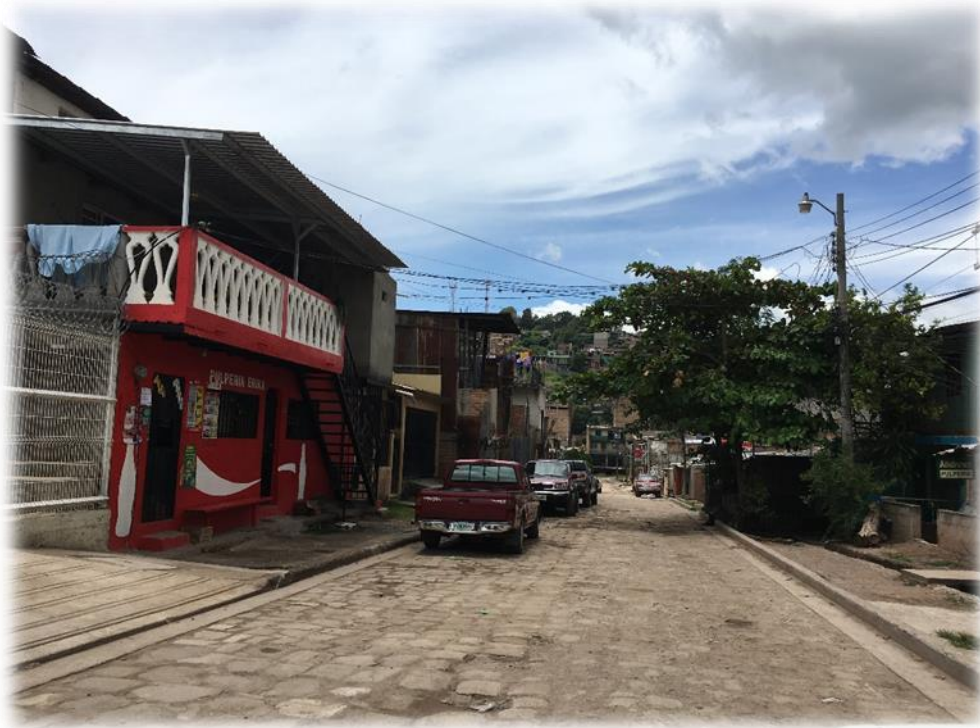
VISTA DEL ESTADO DE LA CALLE A PAVIMENTAR. TRAMO C.

Proyecto: Pavimentación de calle con concreto hidráulico, barrio Las Crucitas segunda calle Código: 1261