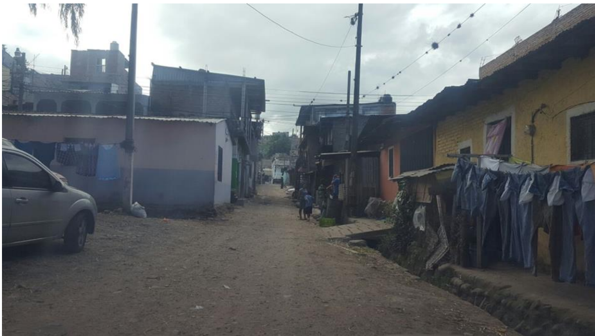
PANORAMA DE CALLE A PAVIMENTAR CON CONCRETO HIDRÁULICO