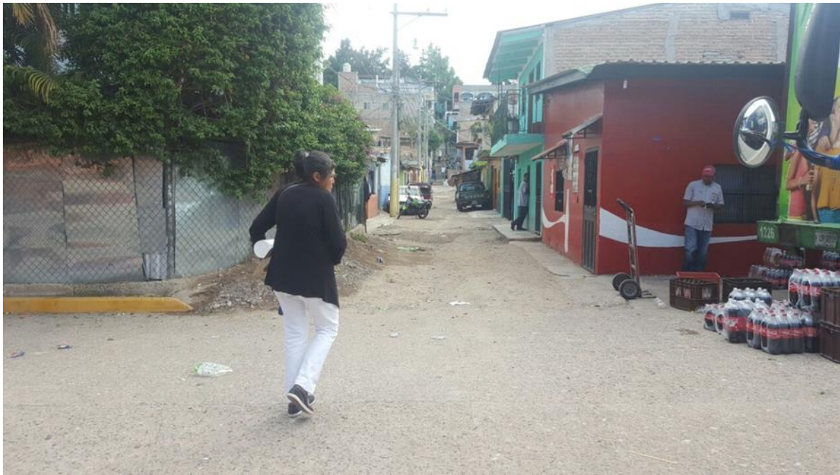
INICIO DE UNA DE LAS CALLES A PAVIMENTAR CON CONCRETO HIDRÁULICO

Proyecto: Pavimentación de calle con concreto hidráulico, col. Las Brisas, bloques 1, 2 y 3 Código: 1462