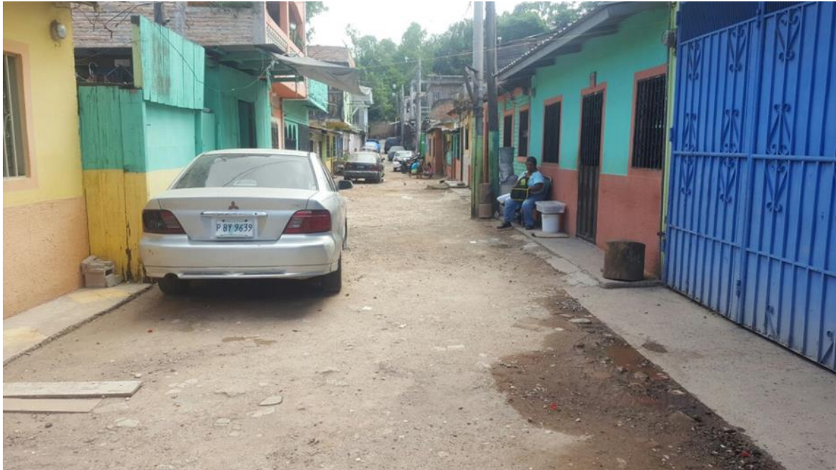
PANORÁMICA DE CALLE A PAVIMENTAR CON CONCRETO HIDRÁULICO

Proyecto: Pavimentación de calle con concreto hidráulico, col. Las Brisas, bloques 1, 2 y 3 Código: 1462