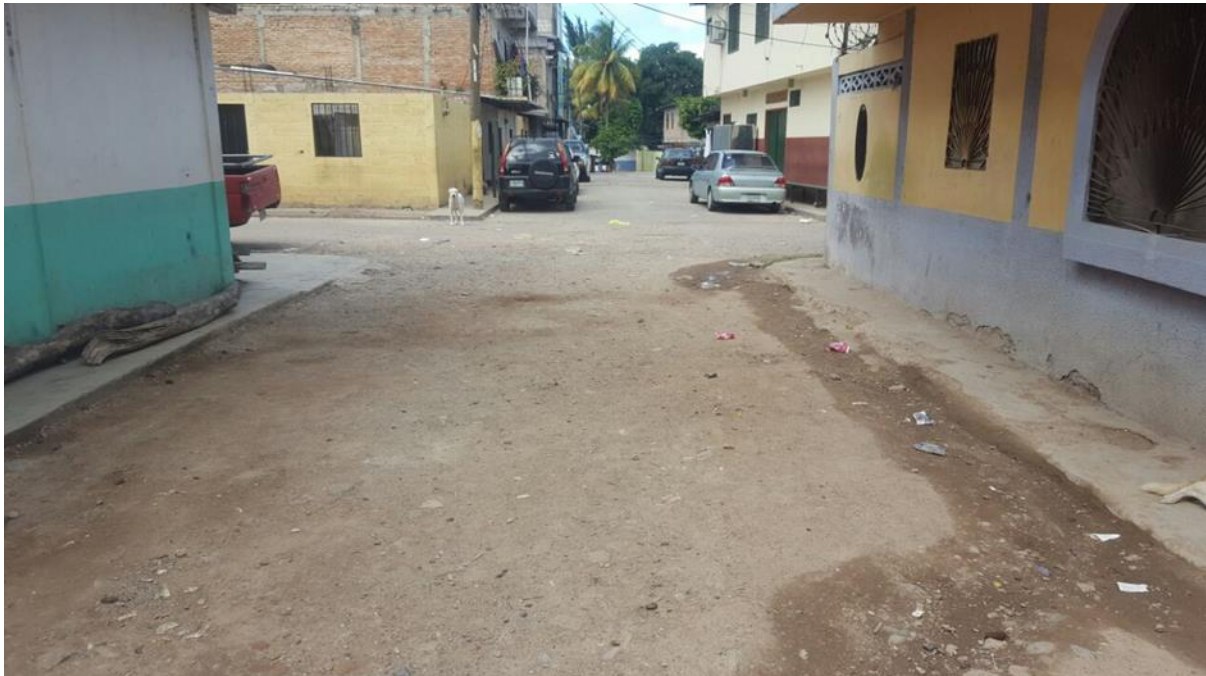
VISTA DE CALLE A PAVIMENTAR CON CONCRETO HIDRÁULICO