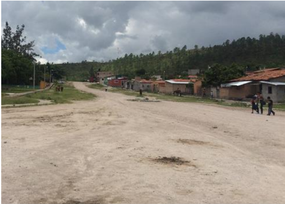
INICIO DE CALLE A REPARAR