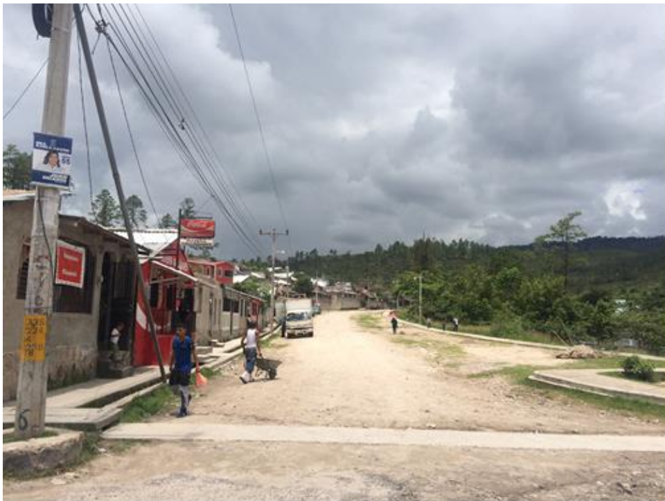
VISTA ACTUAL DE CALLE A REPARAR