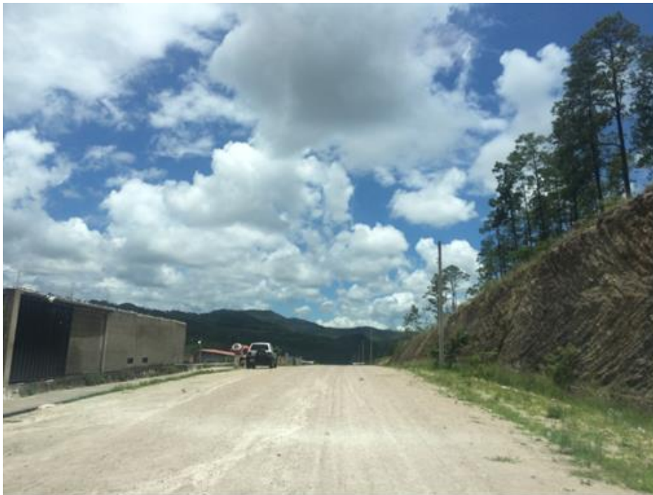
VISTA PANORÁMICA DE CALLE A REPARAR