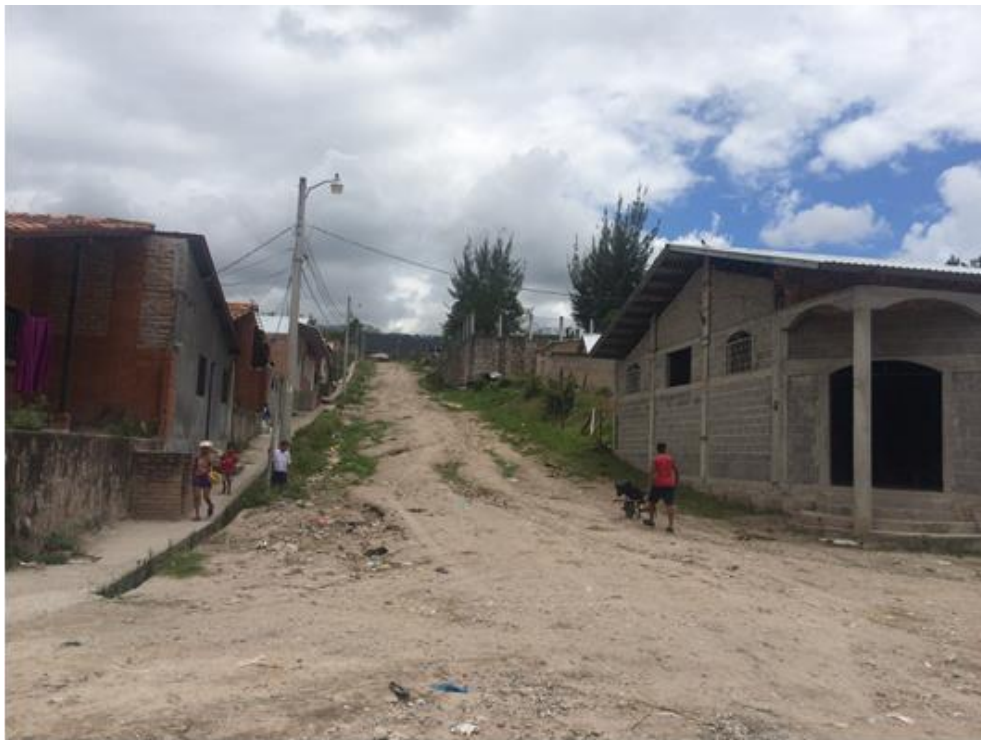
VISTA DE LA CALLE A BALASTAR