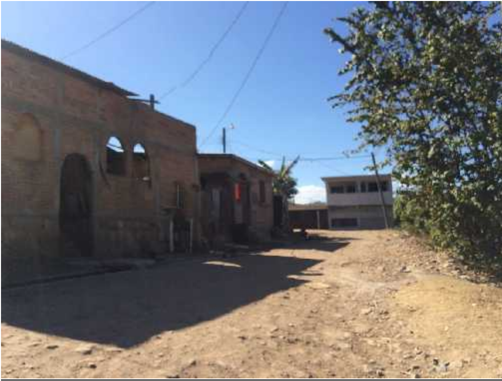
Calle intermedia donde se realizará la obra