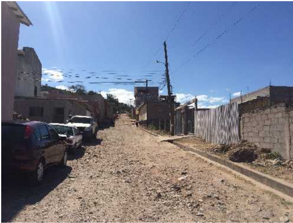
Panorámica de calle donde se realizará balastado