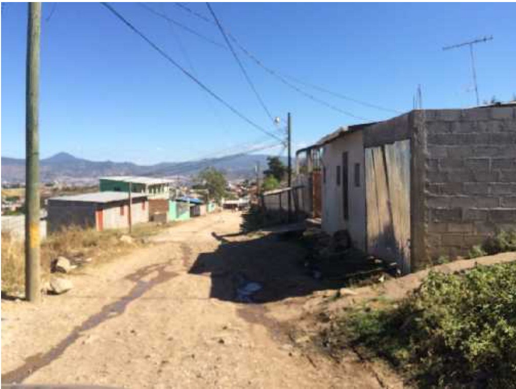
Final de calle