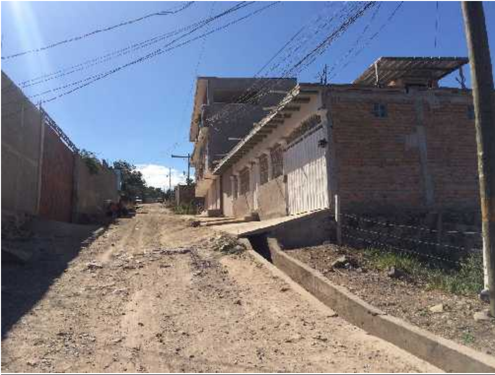
Inicio de calle donde se realizará el balastado