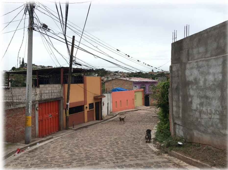
VISTA DE CALLE A PAVIMENTAR CON WHITE TOPPING