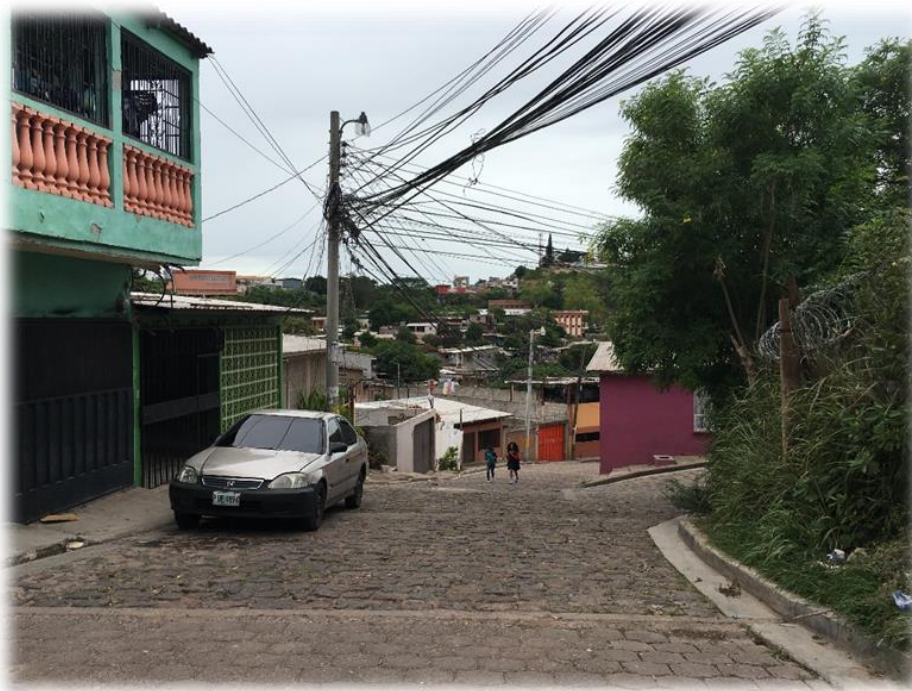
INICIO DE PAVIMENTACION CON WHITE TOPPING