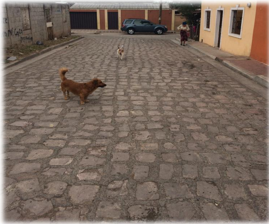
VISTA DEL ESTADO DE LA CALLE A PAVIMENTAR