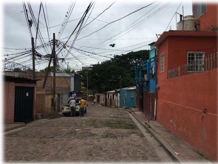
EMPEDRADO A REPARAR