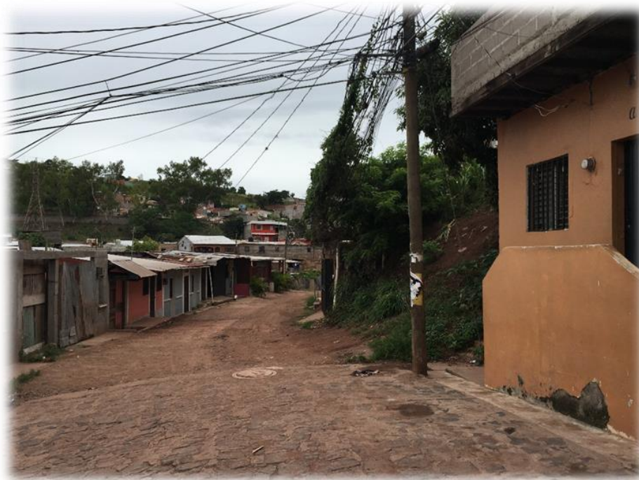
FINAL DE WHITE TOPPING