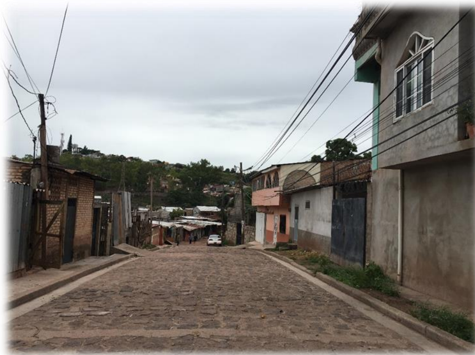
VISTA DE TRAMO A PAVIMENTAR CON WHITE TOPPING