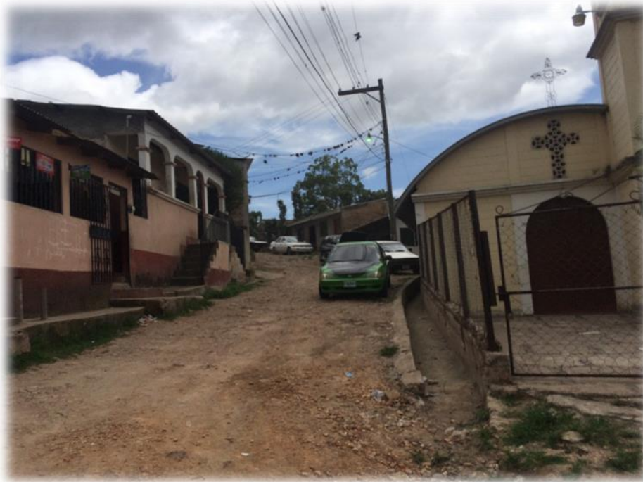
FINAL DE TRAMO A PAVIMENTAR. TRAMO A