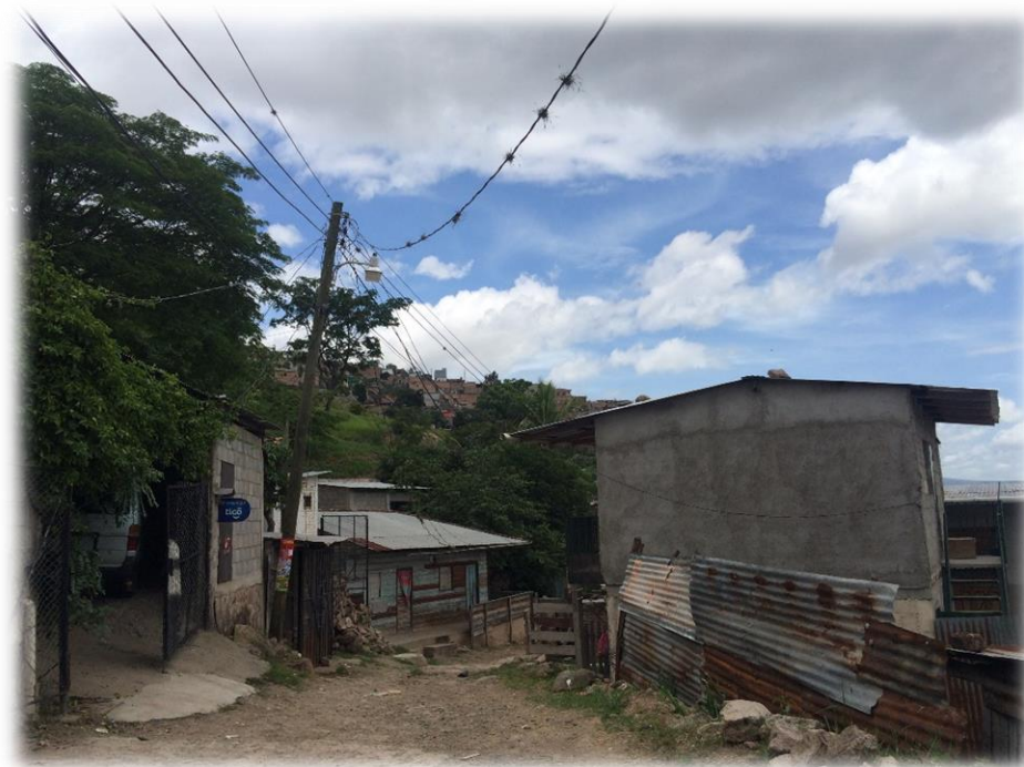
VISTA DEL TRAMO FINAL A PAVIMENTAR. TRAMO B