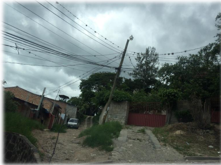
INICIO DE PAVIMENTACION CON CONCRETO HIDRAULICO, TRAMO A