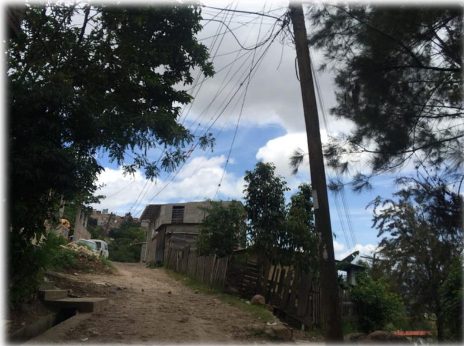
VISTA DEL ESTADO DE LA CALLE A PAVIMENTAR. TRAMO B