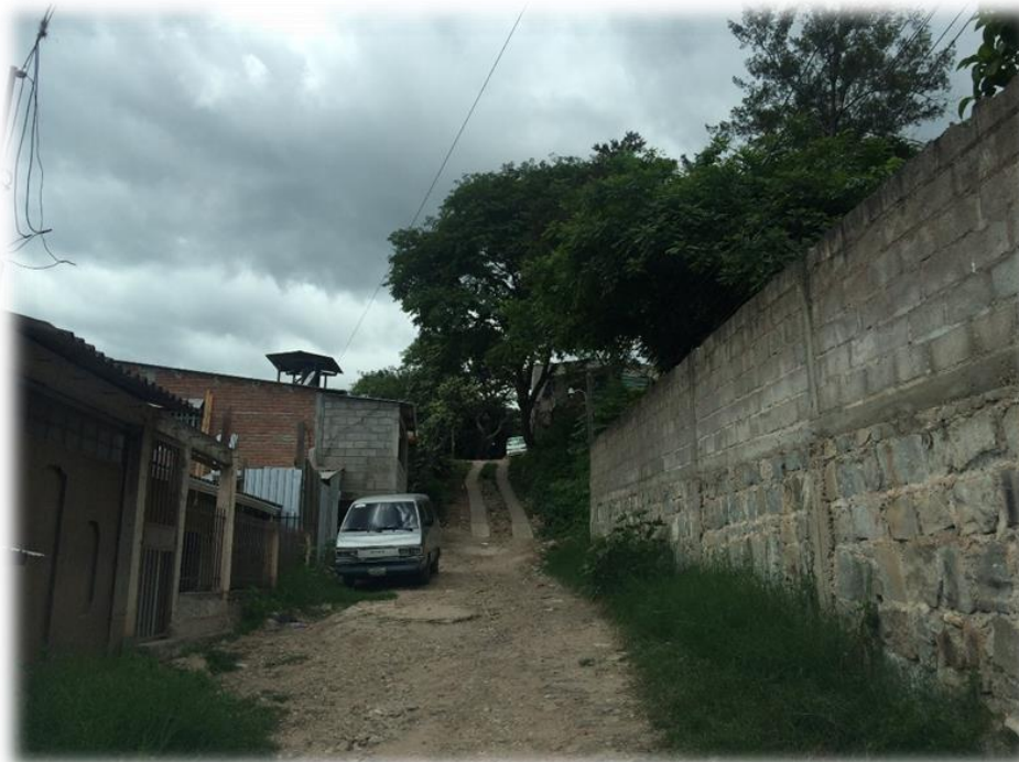
TRAMO A PAVIMENTAR CON CONCRETO HIDRAULICO, TRAMO A