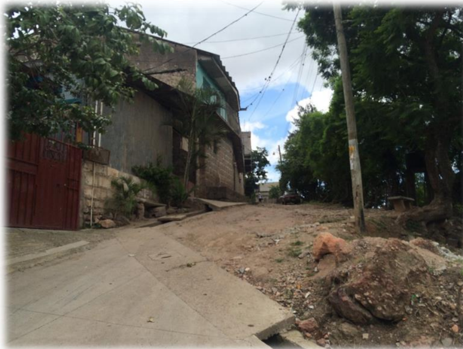
INICIO DE PAVIMENTACION CON CONCRETO HIDRAULICO. TRAMO B