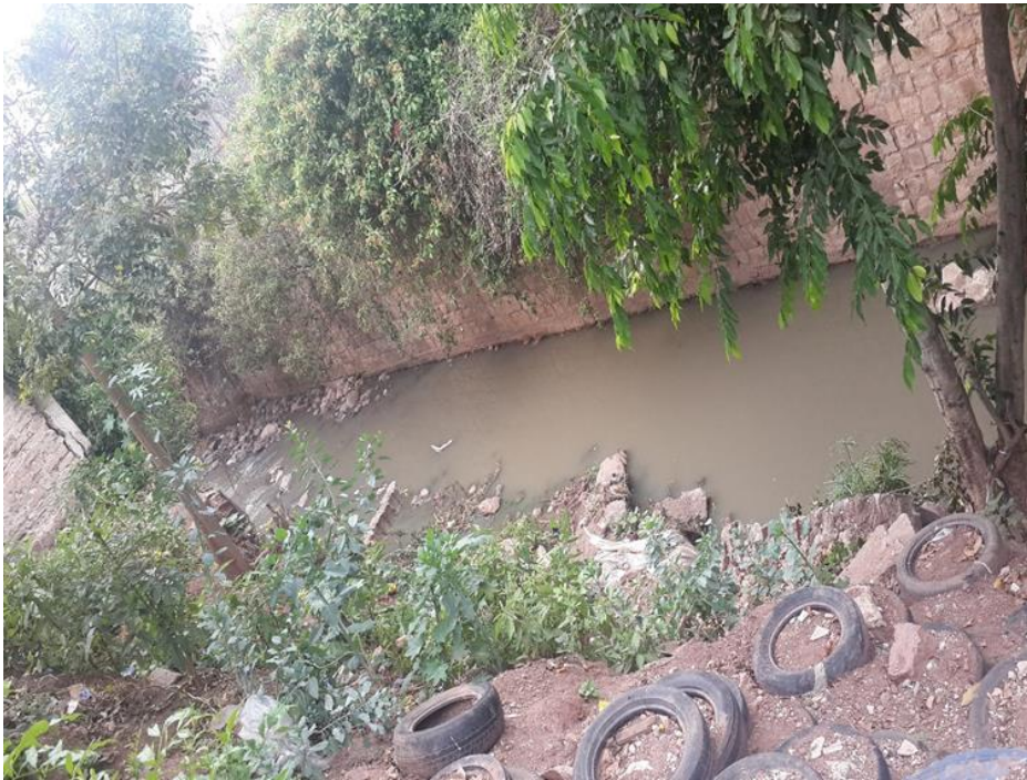
VISTA DEL TRAMO A REPARAR