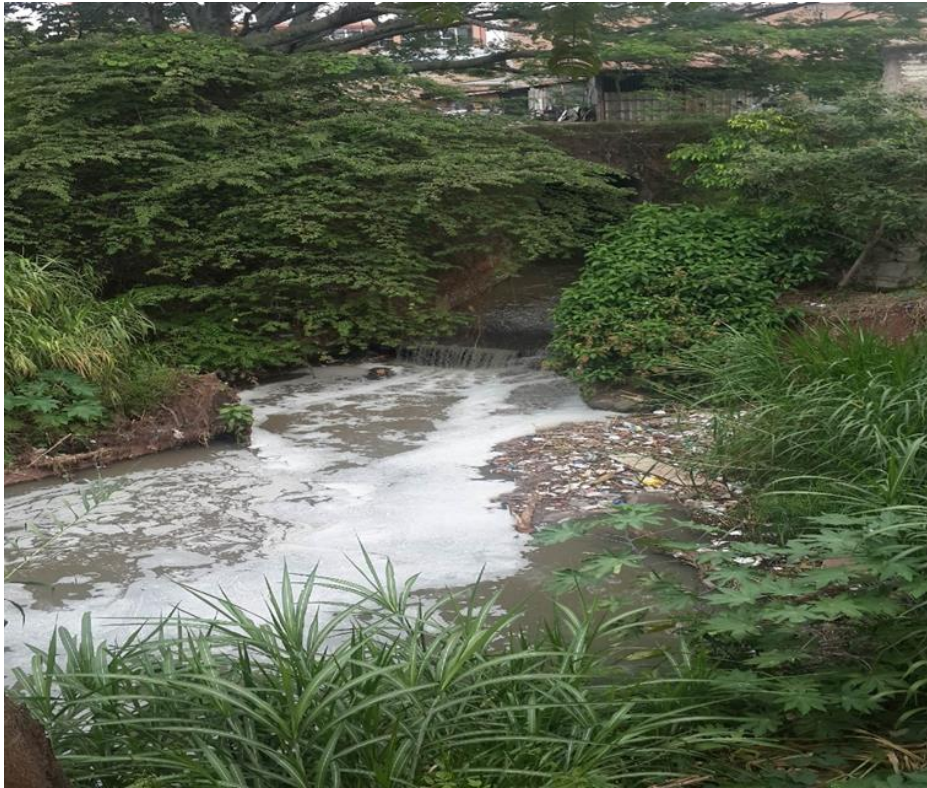
VISTA DEL INICIO DEL TRAMO