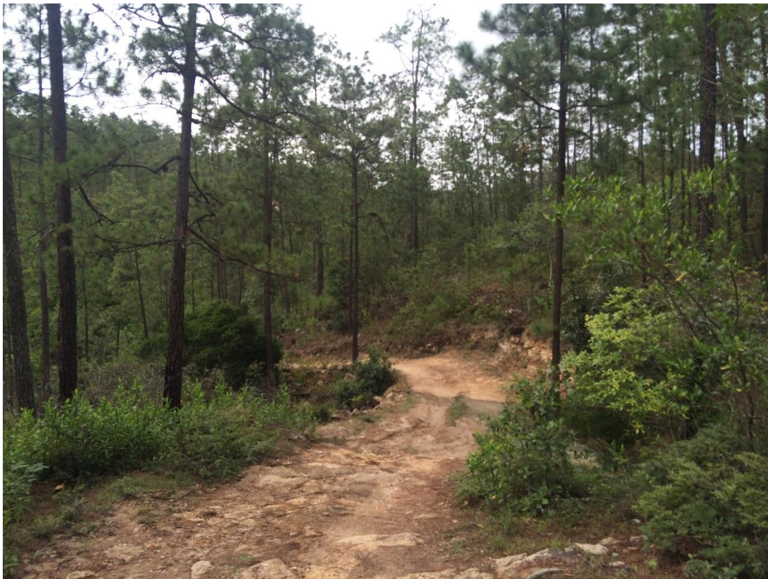
OTRA VISTA DE LA CALLE A REPARAR