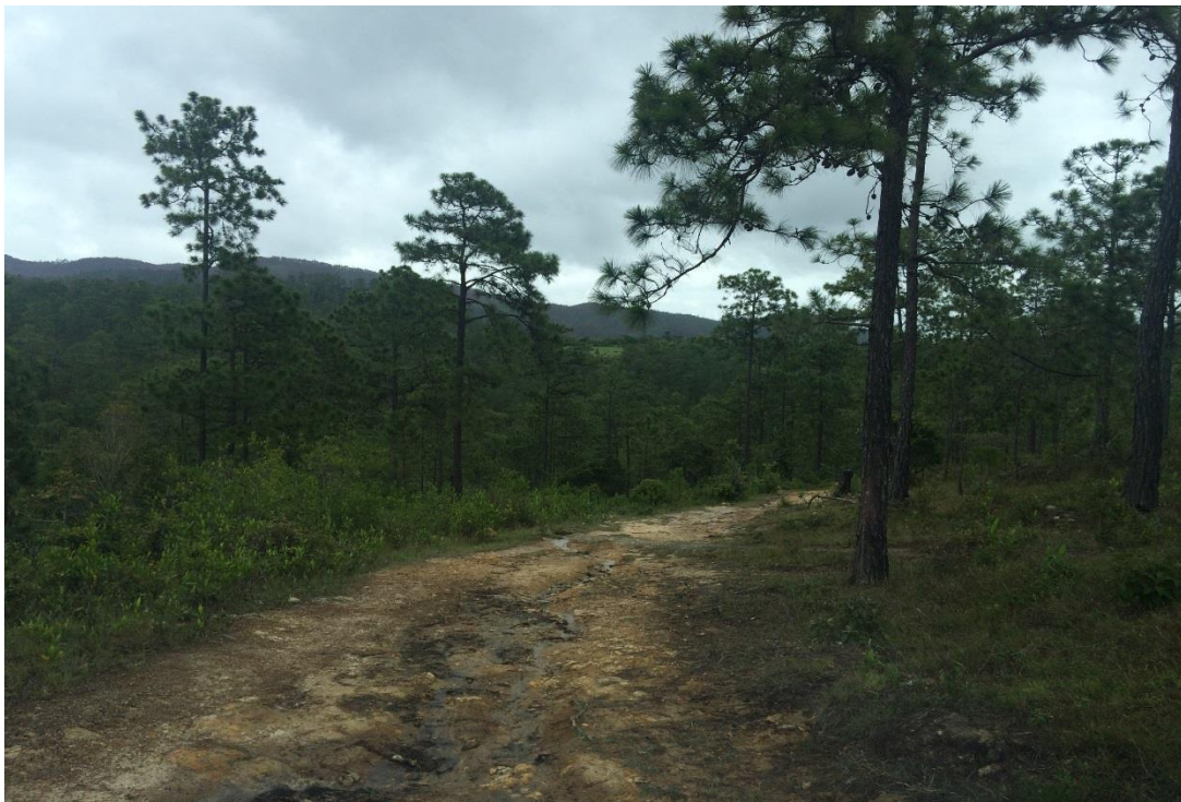
VISTA PANORÁMICA DE LA CALLE A REPARAR