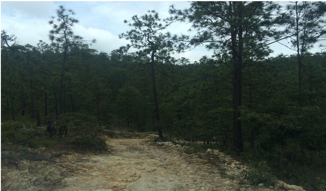
VISTA DEL MAL ESTADO DE LA CALLE