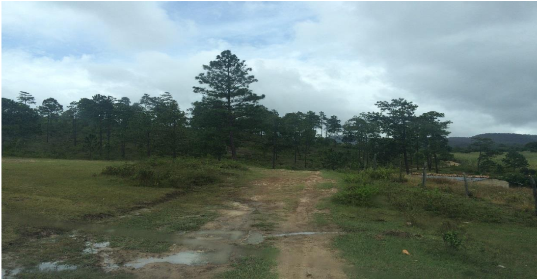
INICIO DE CALLE A CONFORMAR