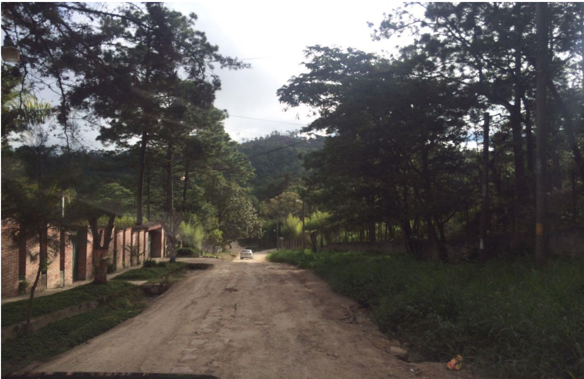
VISTA PANORÁMICA DE CALLE A REPARAR