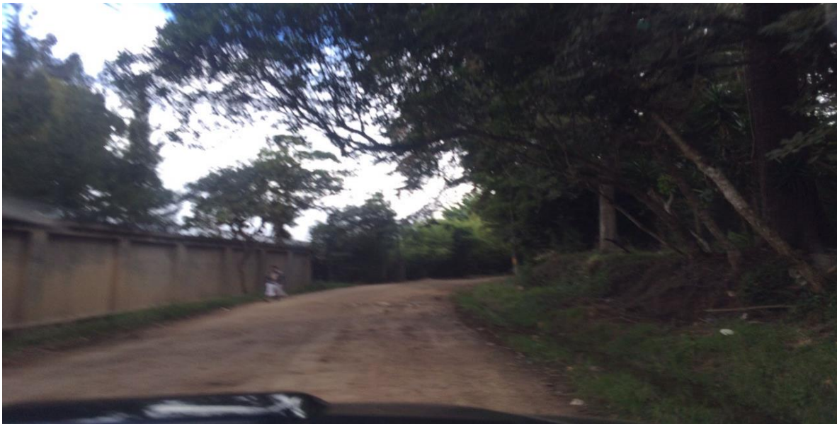
VISTA DE CALLE QUE REQUIERE BALASTADO