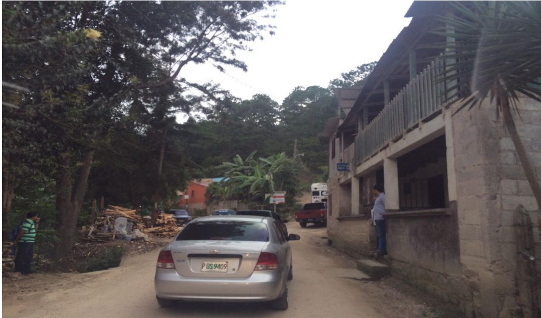
VISTA DE CALLE A REPARAR