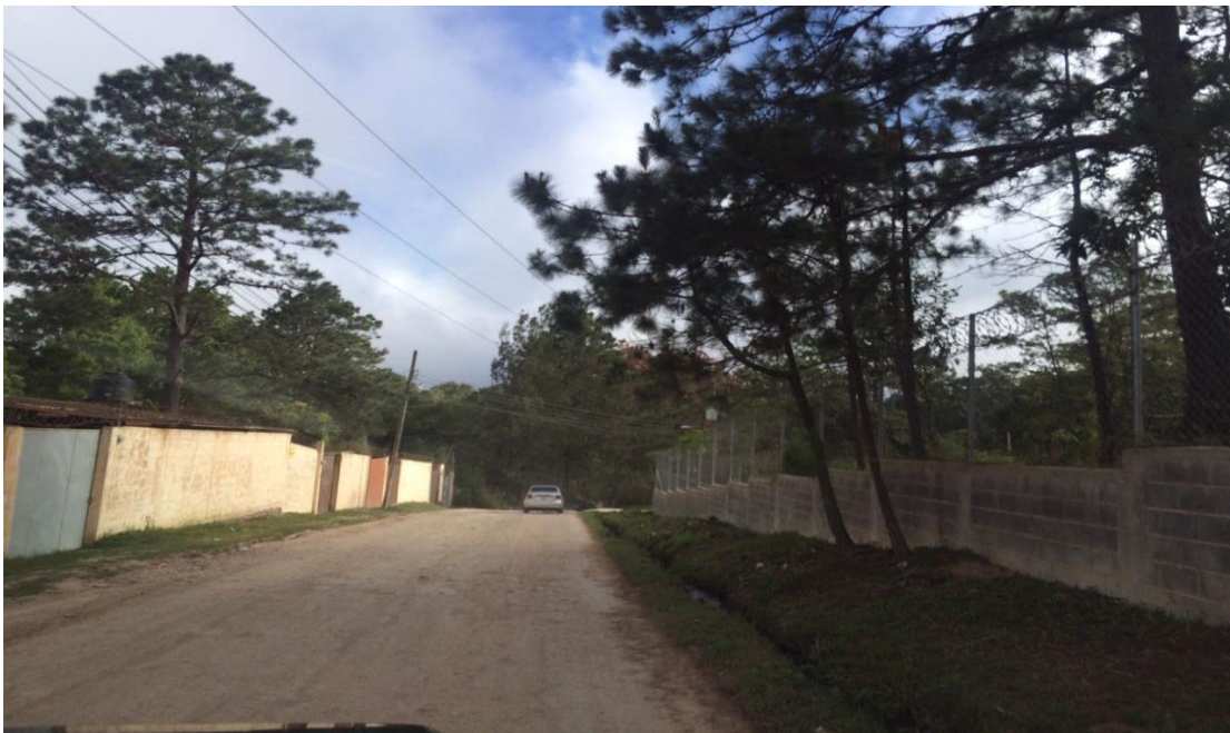
VISTA ACTUAL DE CALLE A REPARAR