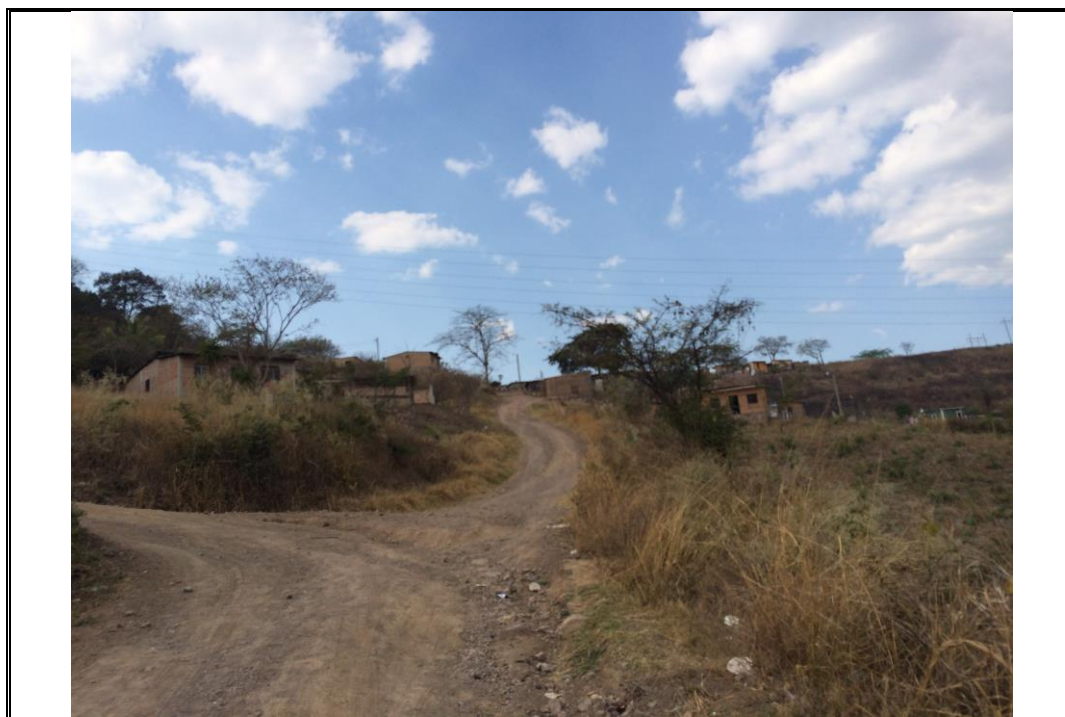
Condiciones actuales de calles donde se realizará conformación y balastado