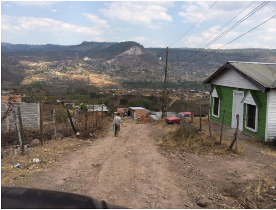
Malas condiciones en que se encuentra tramo de calle a reparar