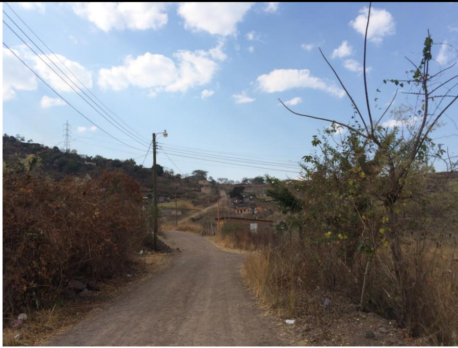
Vista general de una de las calles a conformar y balastar