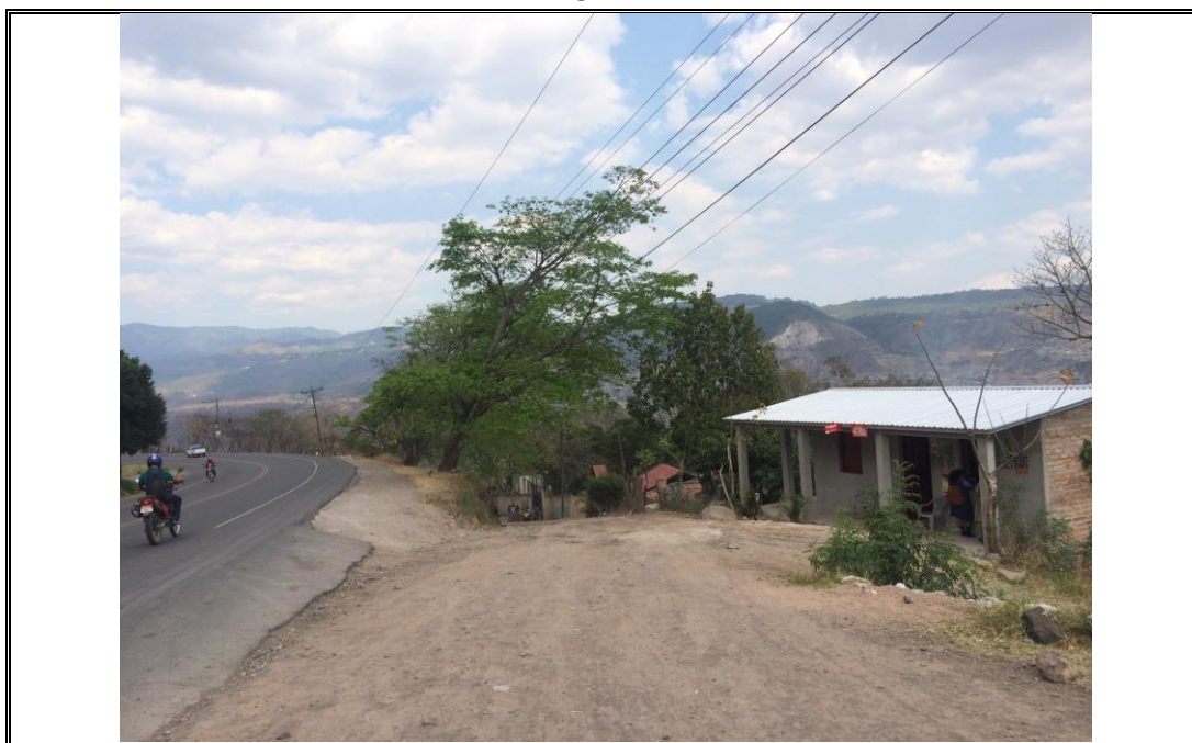
Acceso a la Aldea El Guanabano, tramo donde se construirán huellas