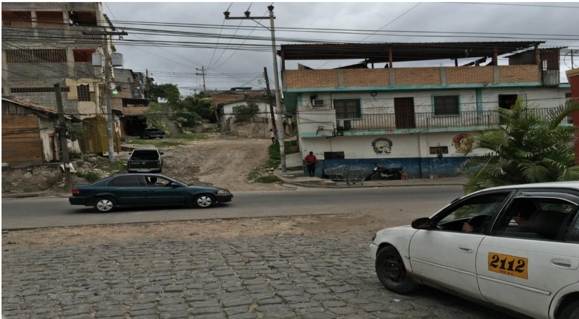
VISTA DEL EMPEDRADO A REPARAR