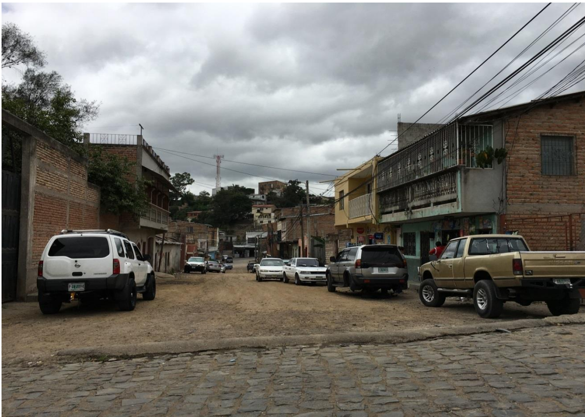
FINAL DEL TRAMO A PAVIMENTAR CON WHITE TOPPING