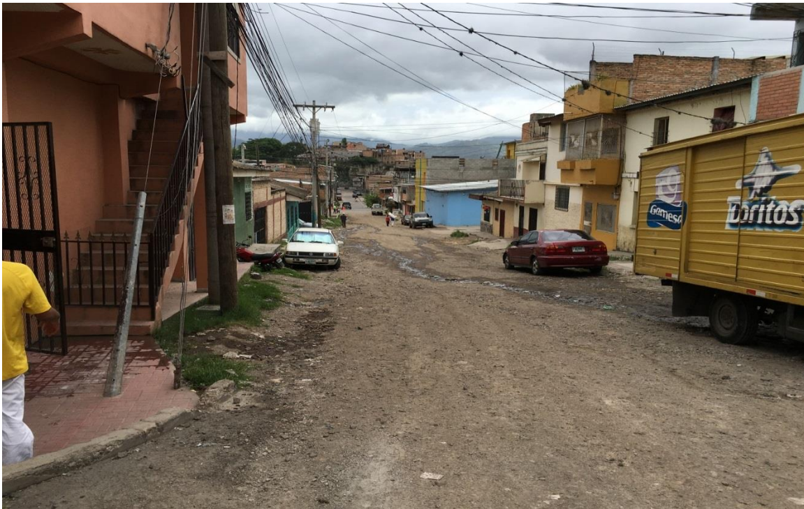
INICIO DE CALLE A PAVIMENTAR CON CONCRETO HIDRAULICO