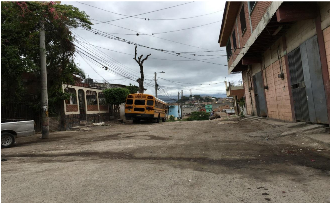
VISTA PANORAMICA DE LA CALLE A PAVIMENTAR