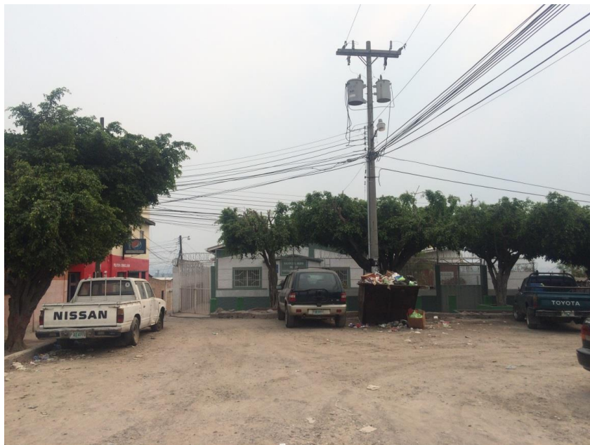
FINAL DE CALLE A PAVIMENTAR CON CONCRETO HIDRÁULICO