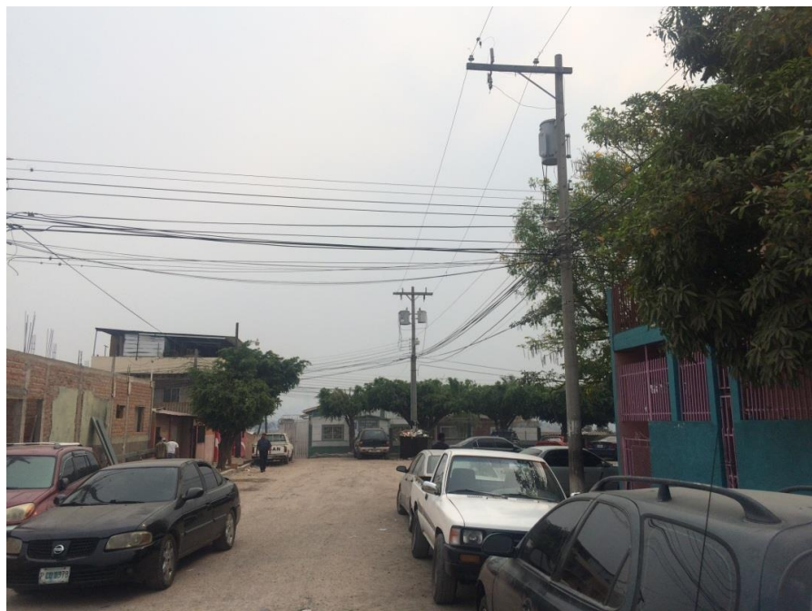
VISTA DEL ESTADO DE LOS ADOQUINES EXISTENTES