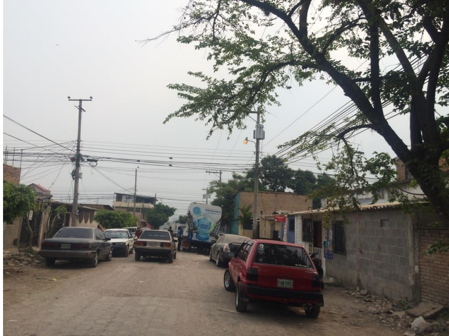
INICIO DE CALLE EN QUE SE DESMONTARÁ ADOQUÍN Y SE PAVIMENTARÁ CON CONCRETO HIDRÁULICO