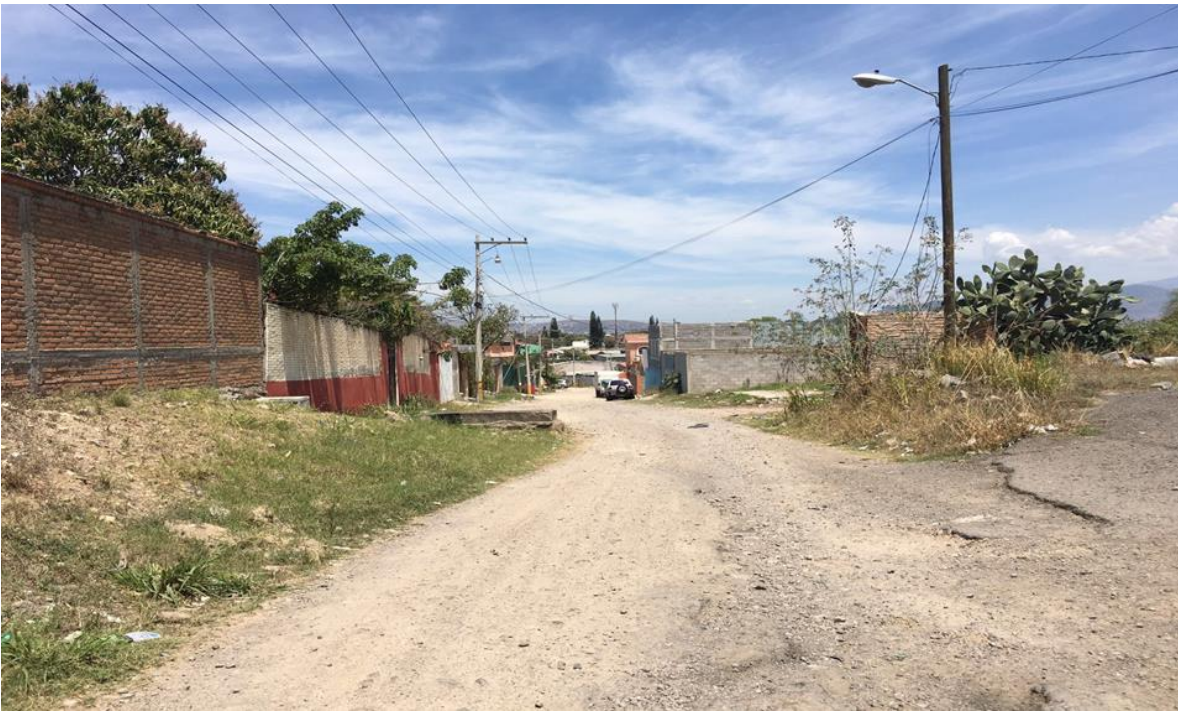
Inicio de la calle a pavimentar