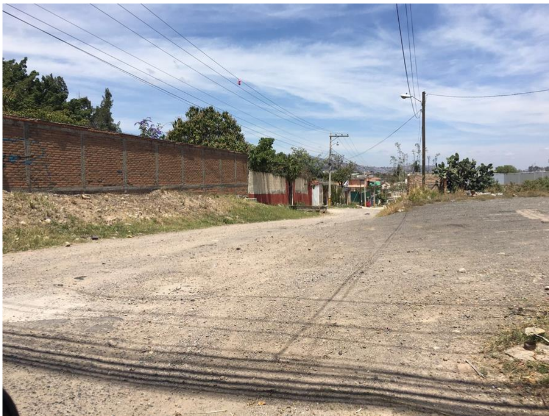
Fin de calle a pavimentar