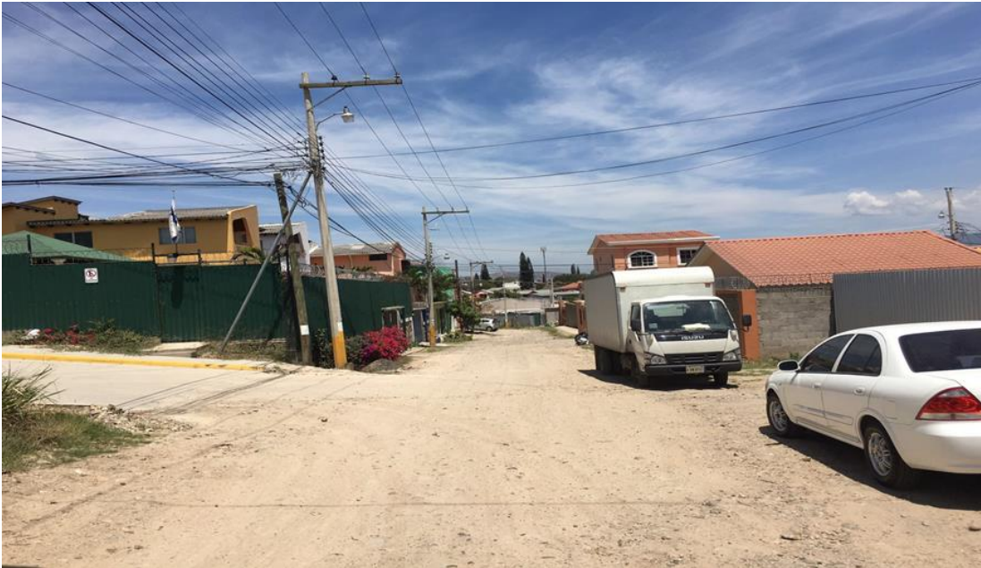
Vista de la seccion de la calle