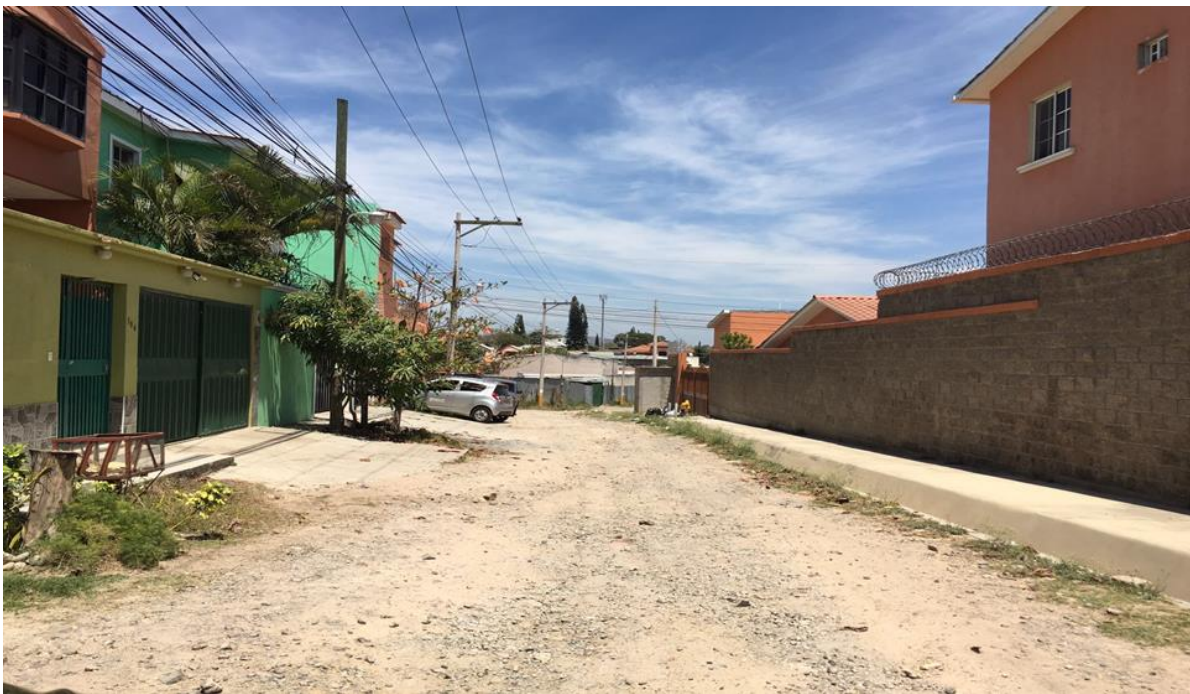
Vista panorámica de la calle