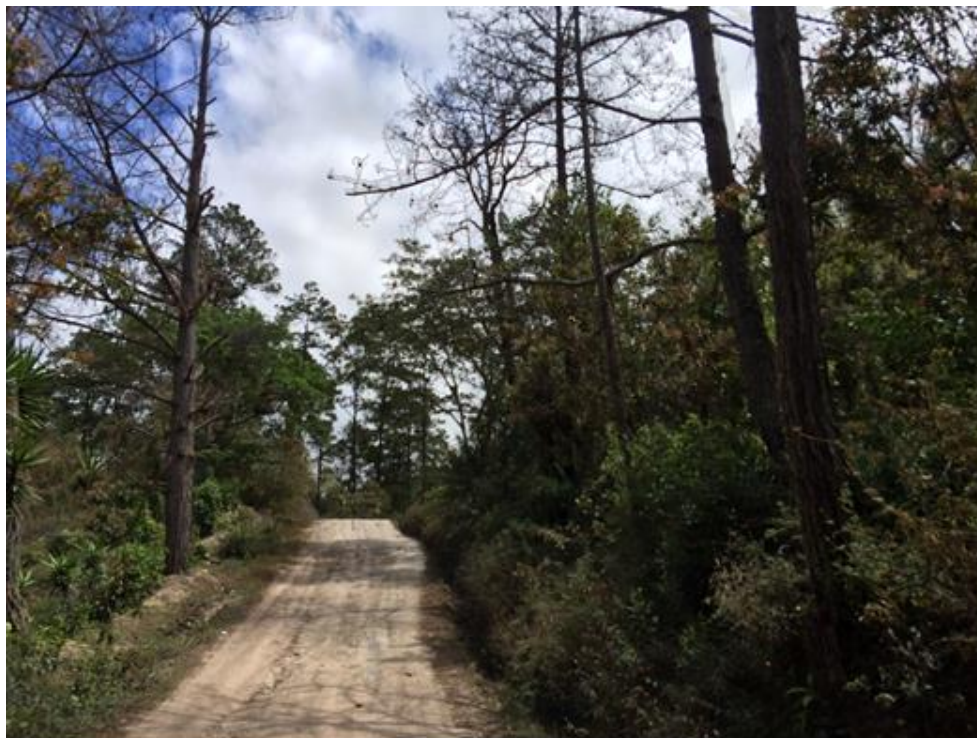
VISTA PANORÁMICA DE CALLE A REPARAR