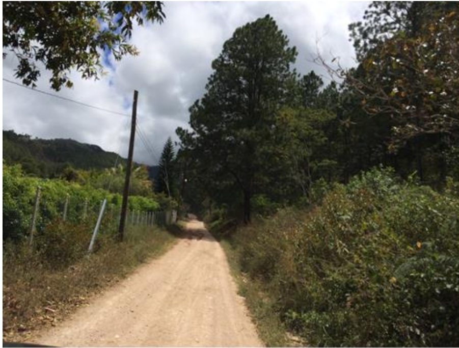
INICIO DE CALLE A REPARAR