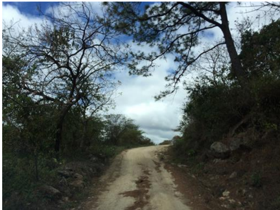
VISTA ACTUAL DE CALLE A REPARAR