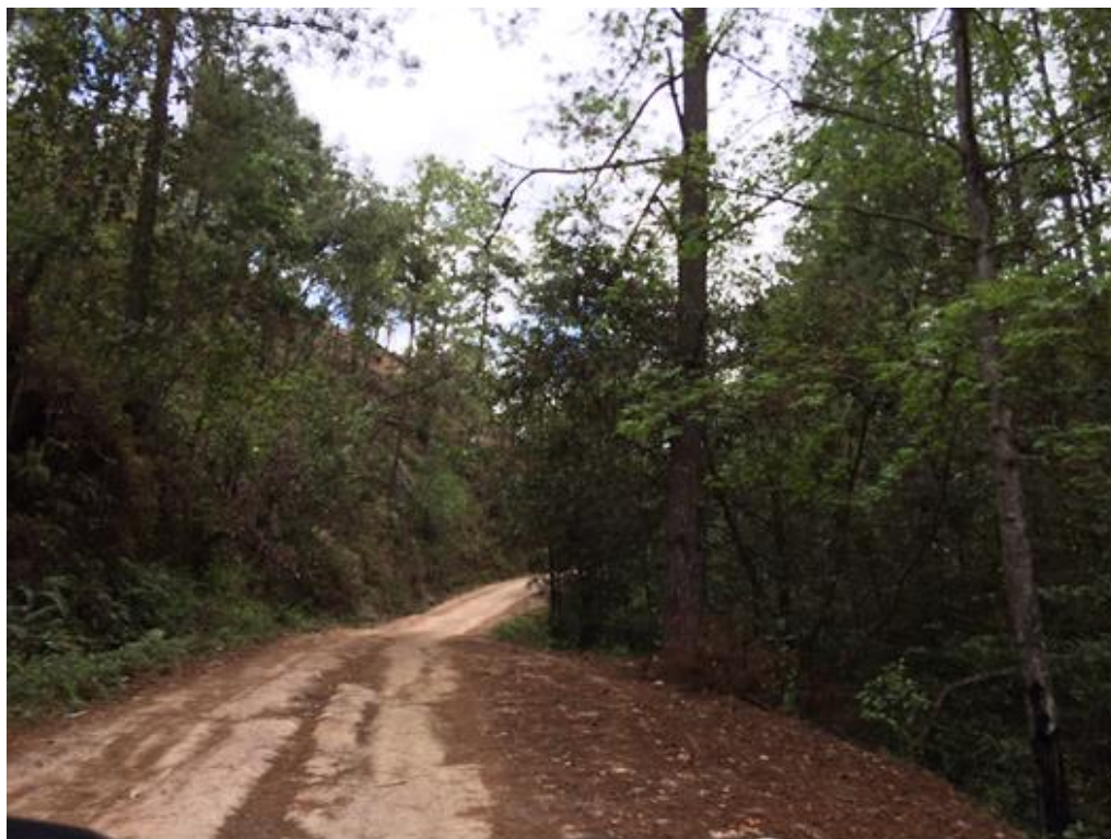
VISTA DE LA CALLE A BALASTAR