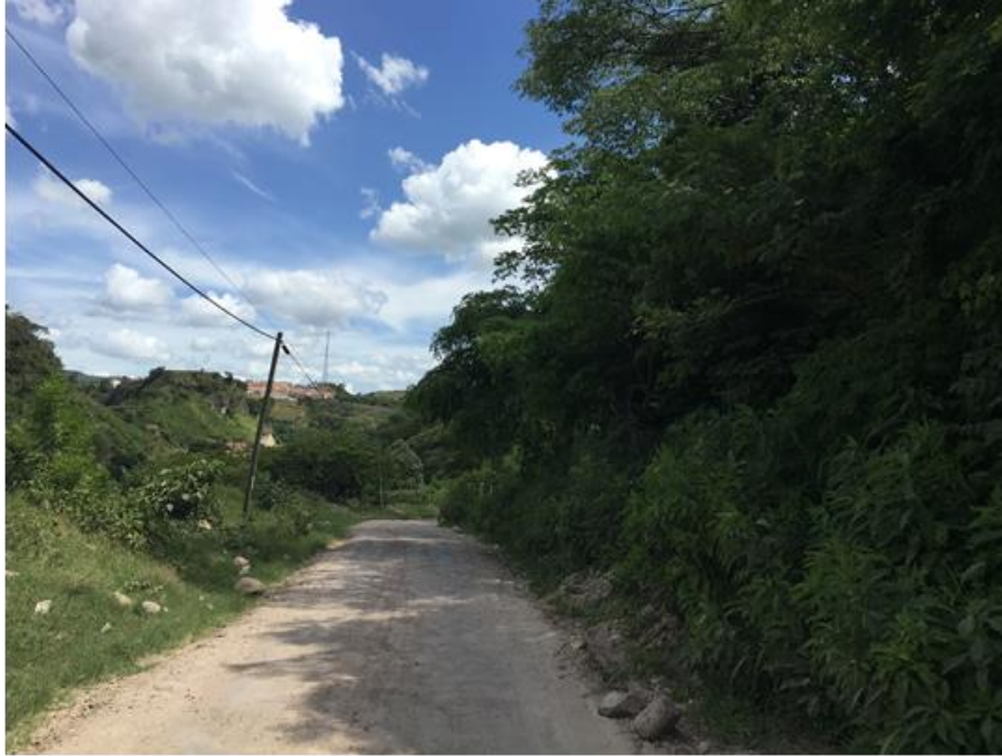
Panorama del tramo en el que se hará el balastado