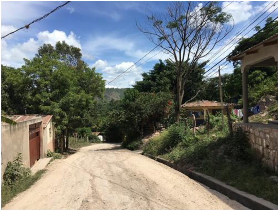
Panorama del tramo en el que se hará el balastado