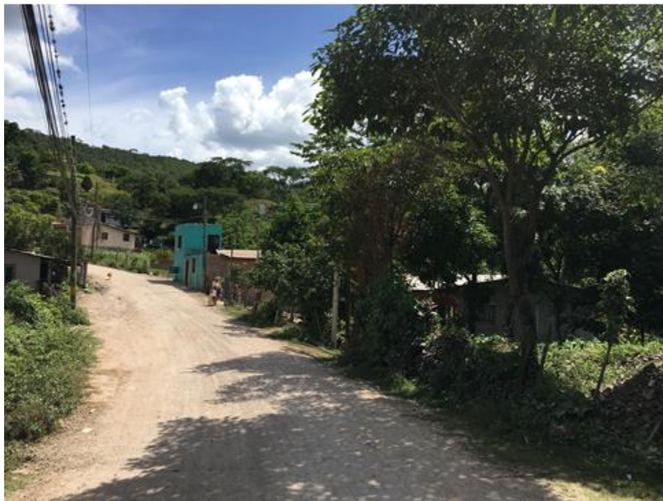
Panorama del tramo en el que se hará el balastado