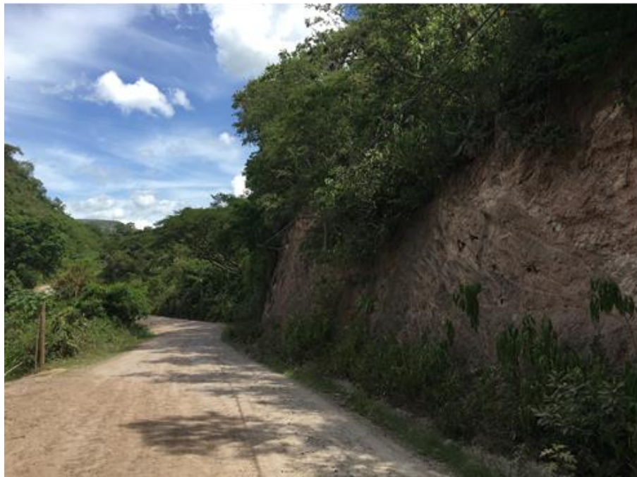
Panorama del tramo en el que se hará el balastado