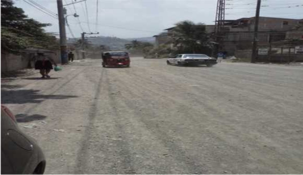
Vista de la Calle que se va a Pavimentar