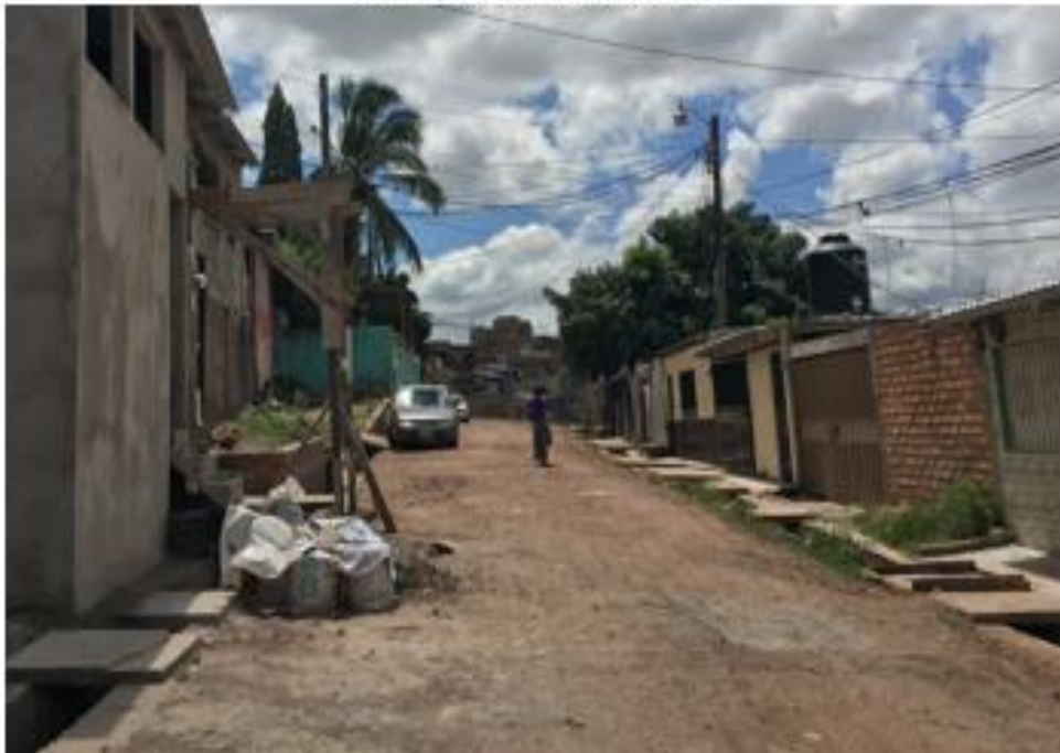
VISTA DE LA CALLE EN MAL ESTADO