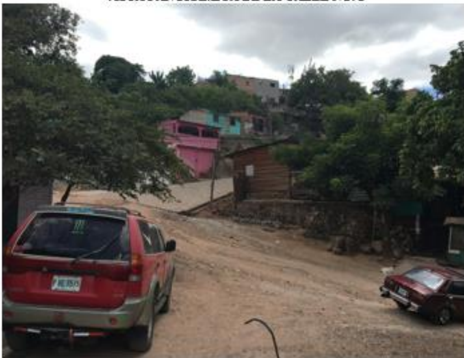
FINAL DE LA CALLE A PAVIMENTAR