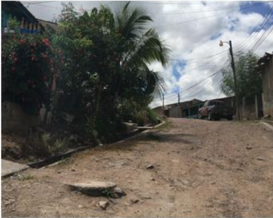
VISTA PANORAMICA DE LA CALLE NO. 2

Proyecto: Pavimentación de calle con concreto hidráulico, colonia San Martín Código: 1342