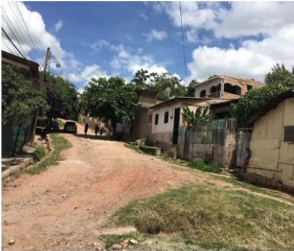
VISTA DE LA CALLE NO. 1

Proyecto: Pavimentación de calle con concreto hidráulico, colonia San Martín Código: 1342