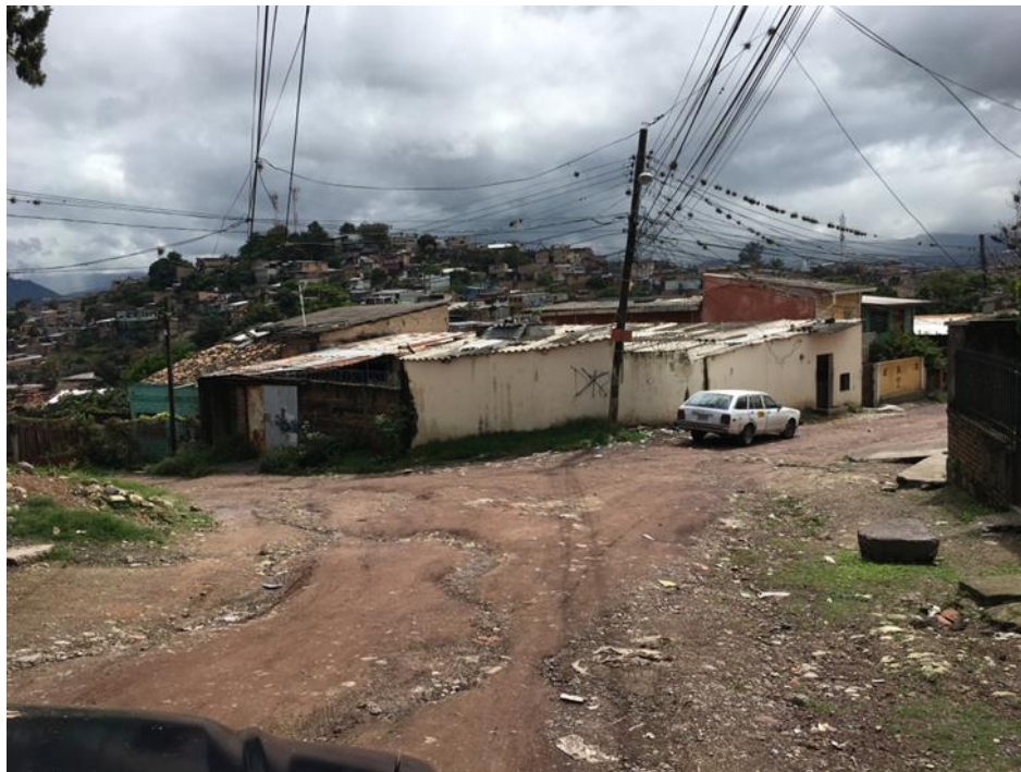
PANORAMA DE CALLE A PAVIMENTAR CON CONCRETO HIDRÁULICO