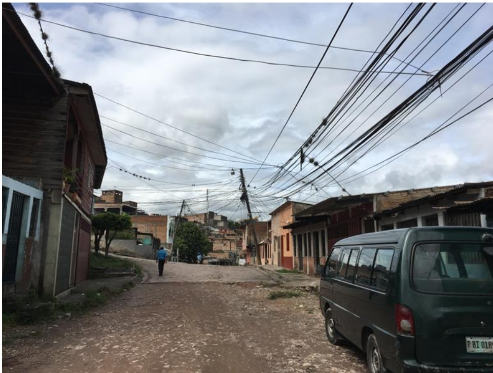
FINAL DE CALLE A PAVIMENTAR CON CONCRETO HIDRÁULICO