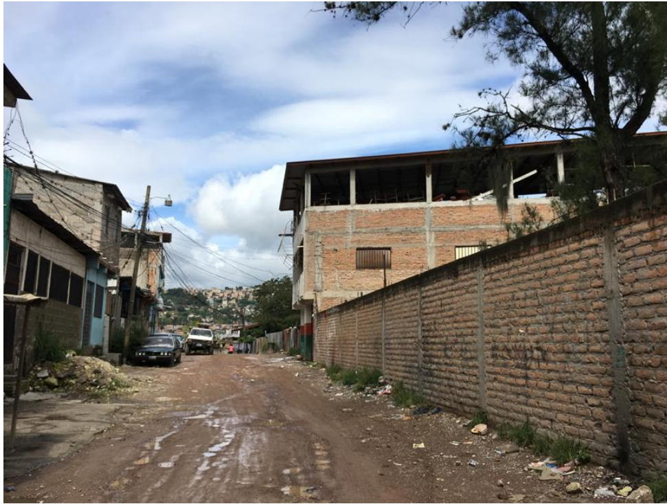
PANORAMA DE CALLE A PAVIMENTAR CON CONCRETO HIDRÁULICO