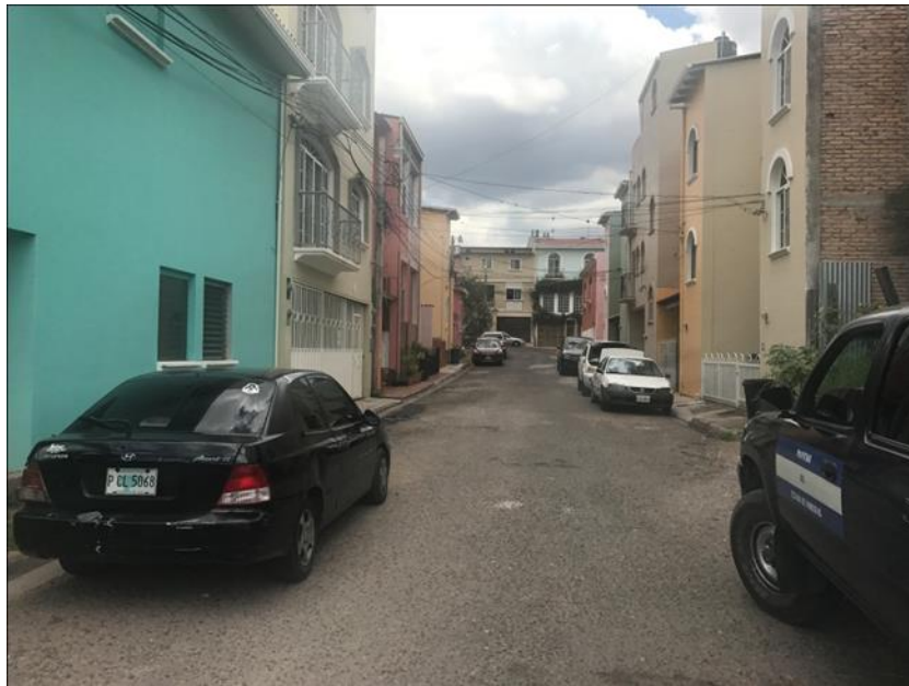
Calle con pavimento asfáltico en malas condiciones

Proyecto: Pavimentación de calle con concreto hidráulico, res. Villas Colonial Código: 1681