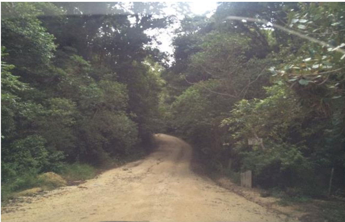
VISTA DE CALLES QUE REQUIERE BALASTADO