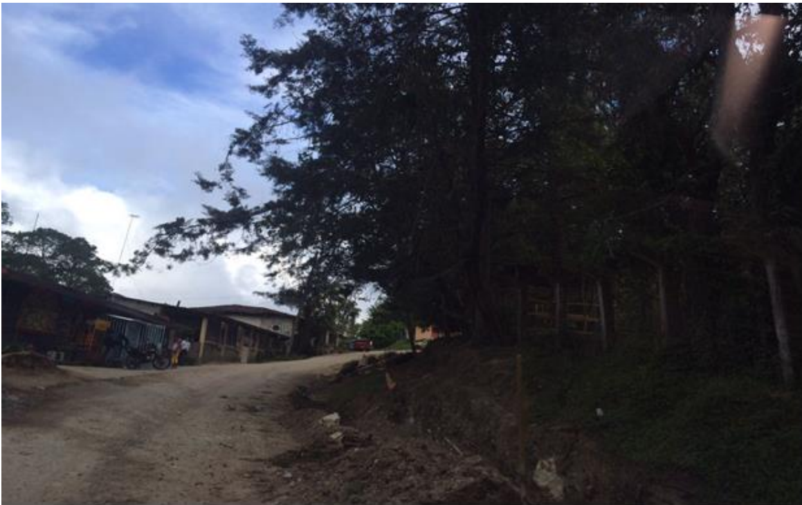
VISTA PANORAMICA DE CALLES A REPARAR