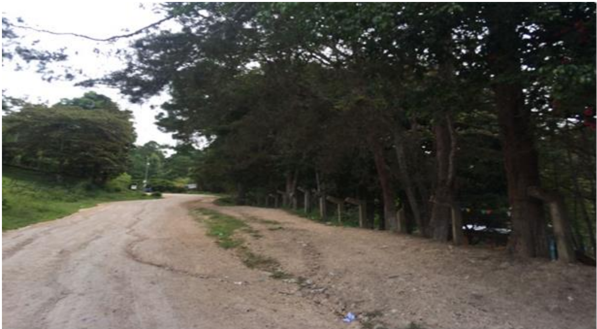
VISTA ACTUAL DE CALLES A REPARAR