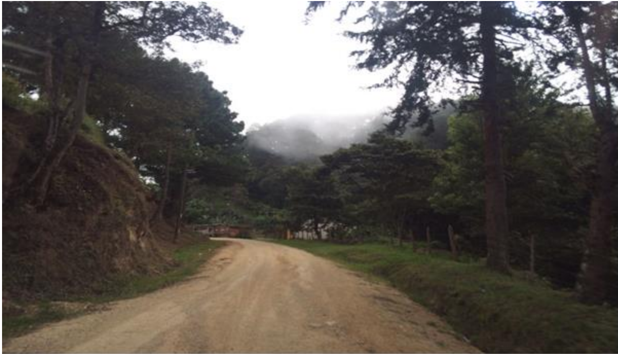
VISTA DE CALLES A REPARAR