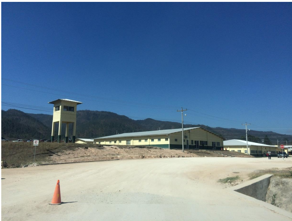
VISTA DEL FINAL DE LA CALLE