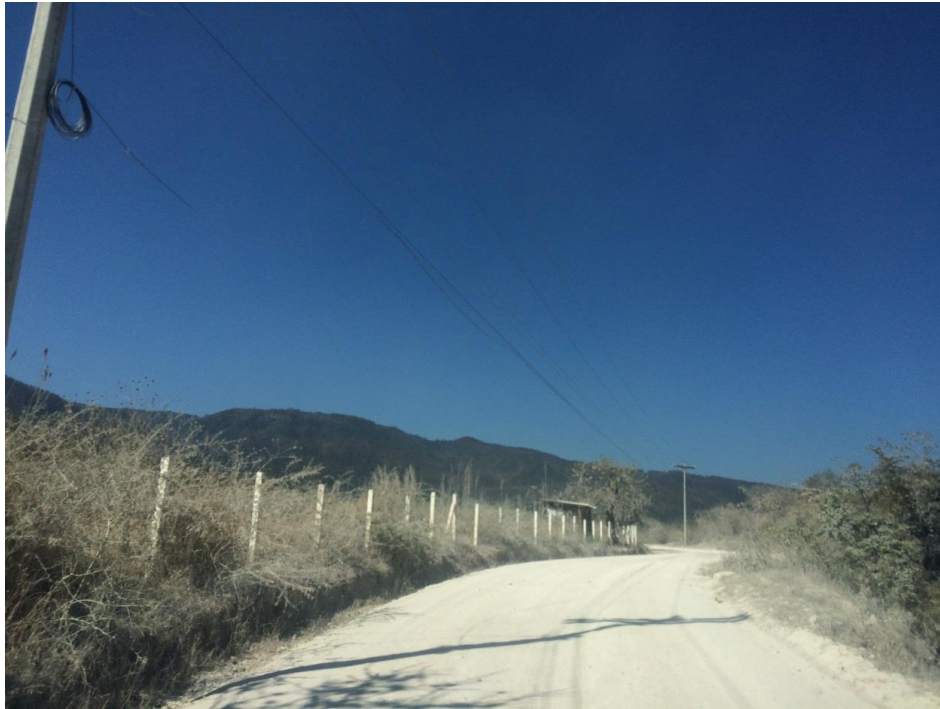
VISTA PANORAMICA DE TRAMO A PAVIMENTAR