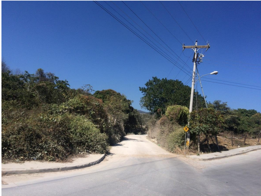
VISTA DEL INICIO DE CALLE A PAVIMENTAR