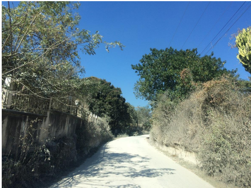
VISTA DE TRAMO A PAVIMENTAR