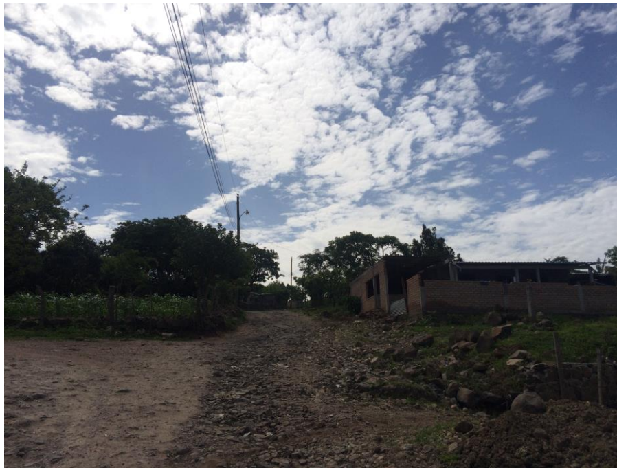
VISTA ACTUAL DE CALLE A REPARA