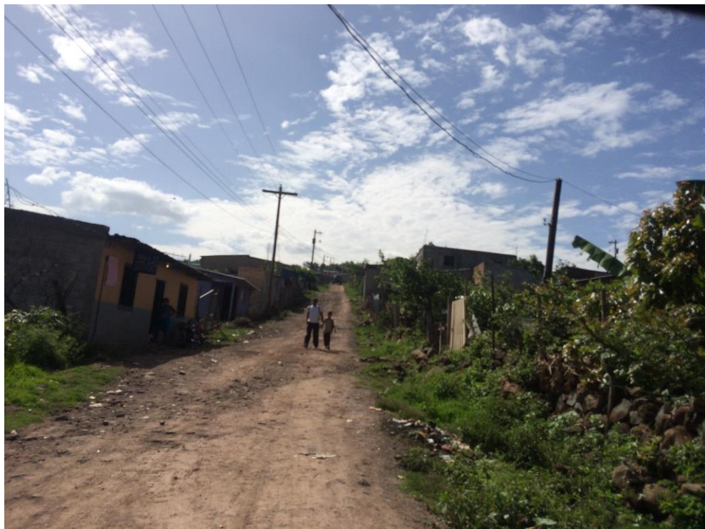
VISTA DE LA CALLE A BALASTAR