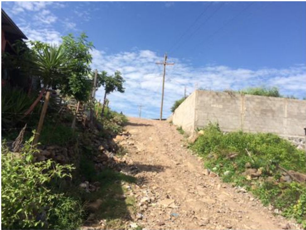
VISTA PANORÁMICA DE CALLE A REPARAR