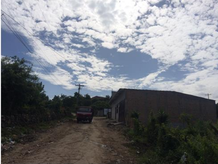
INICIO DE CALLE A REPARAR