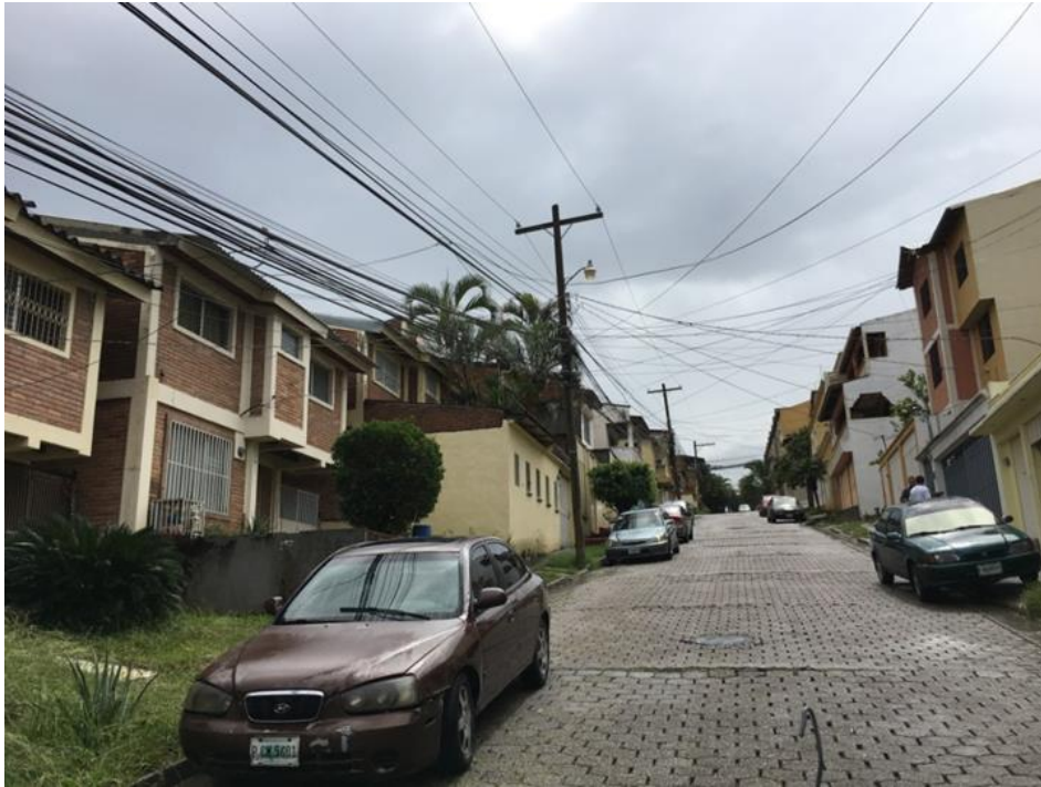
PANORAMA DE CALLE EN QUE SE REMOVERÁ EL ADOQUÍN Y SE PAVIMENTARÁ CON CONCRETO HIDRÁULICO