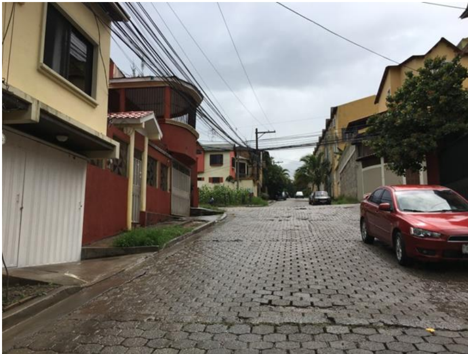
VISTA DE CALLE EN QUE SE REMOVERÁ EL ADOQUÍN Y SE PAVIMENTARÁ CON CONCRETO HIDRÁULICO