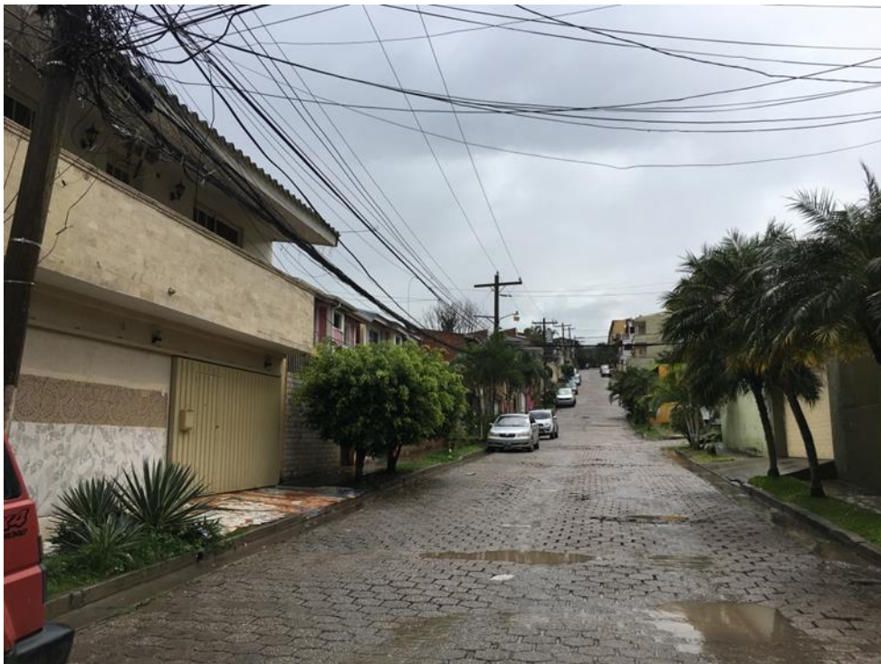
PANORAMA EN QUE SE REMOVERÁ EL ADOQUÍN Y SE PAVIMENTARÁ CON CONCRETO HIDRÁULICO