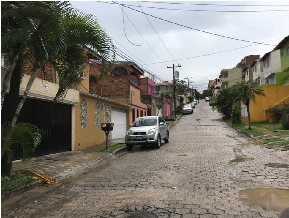
VISTA DEL MAL ESTADO DEL ADOQUINADO

Proyecto: Pavimentación de calle con concreto hidráulico, col. Altos de Toncontín Código: 1436