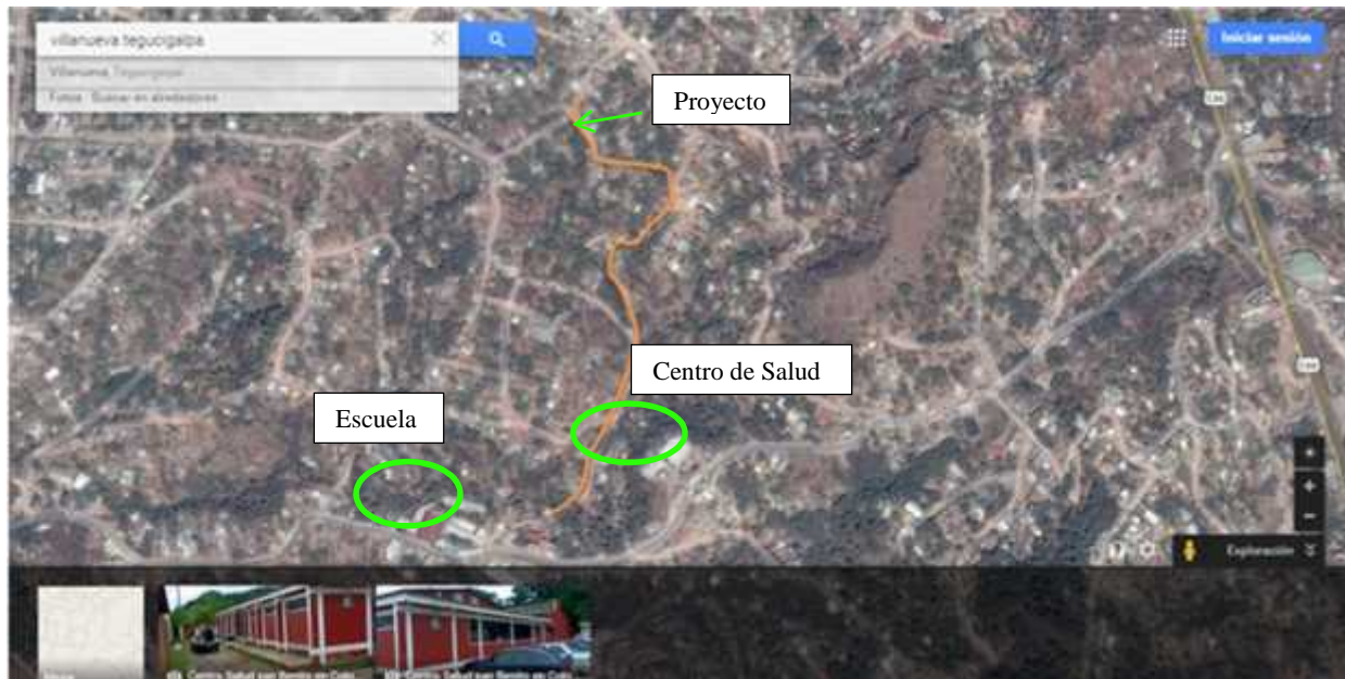
Ubicación del protecto y calles a pavimentar