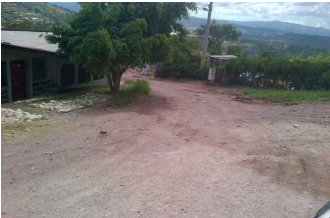
INICIO DEL PROYECTO

“CONSTRUCCION DE HUELLAS, COL. LOS PINOS TEGUCIGALPA M.D.C.”