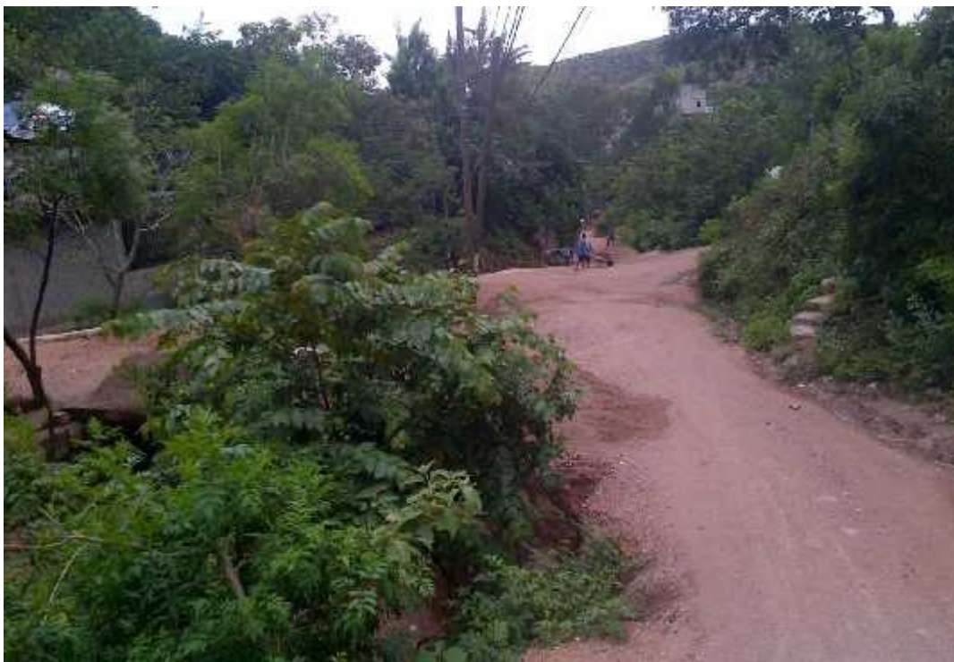
VISTA PANORAMICA DE CALLE DE PROYECTO