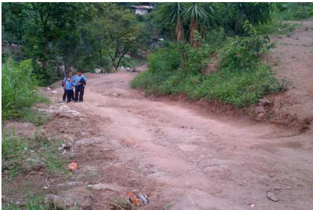
REPARAR CON HUELLAS VEHICULARES