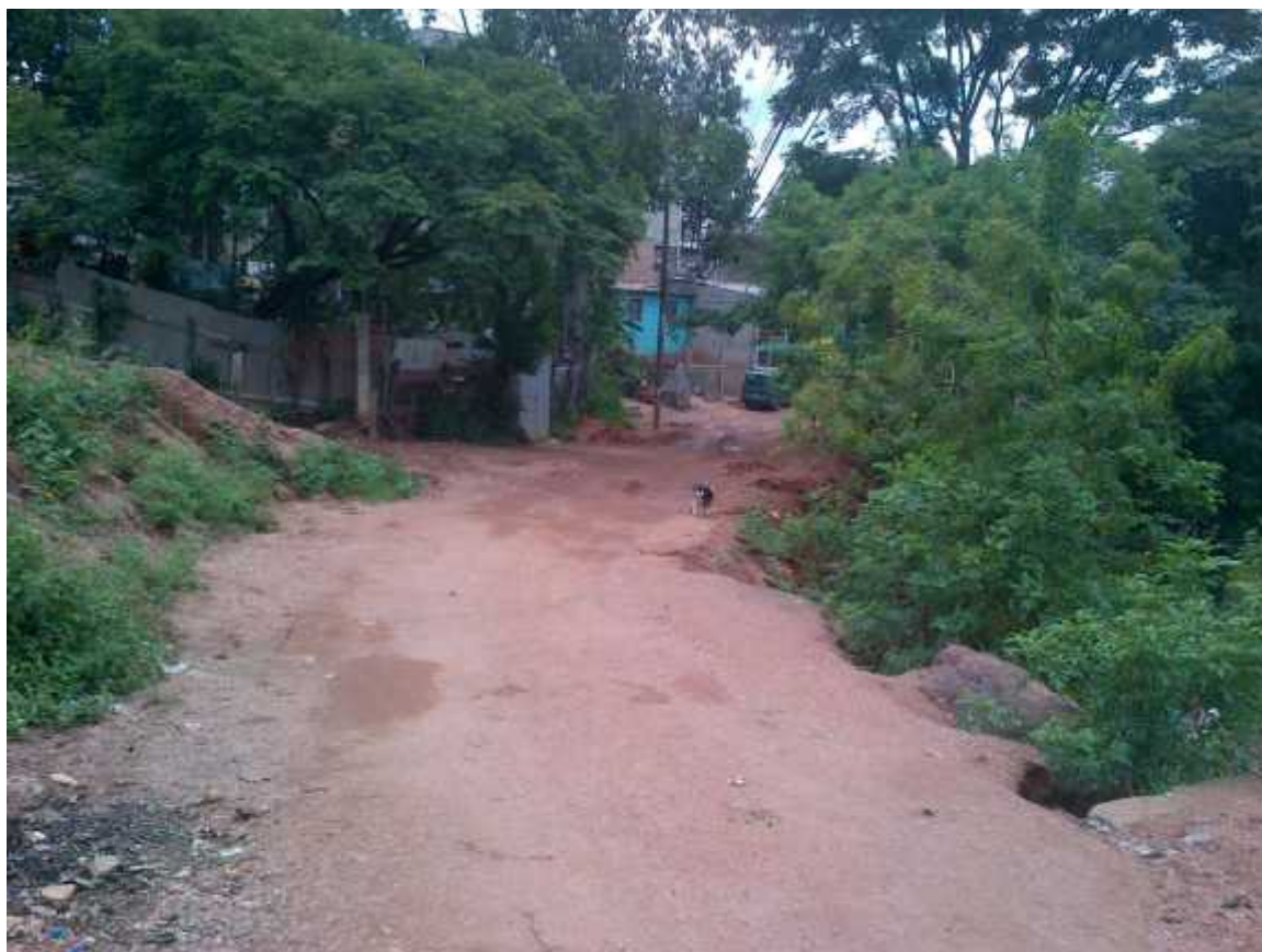
FINAL DEL PROYECTO