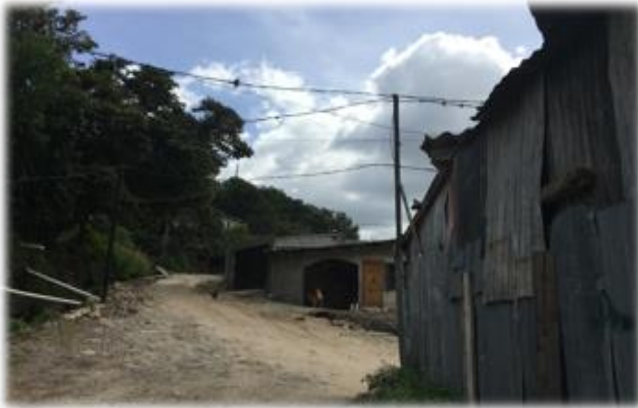
Panorama de calle a pavimentar con concreto hidráulico