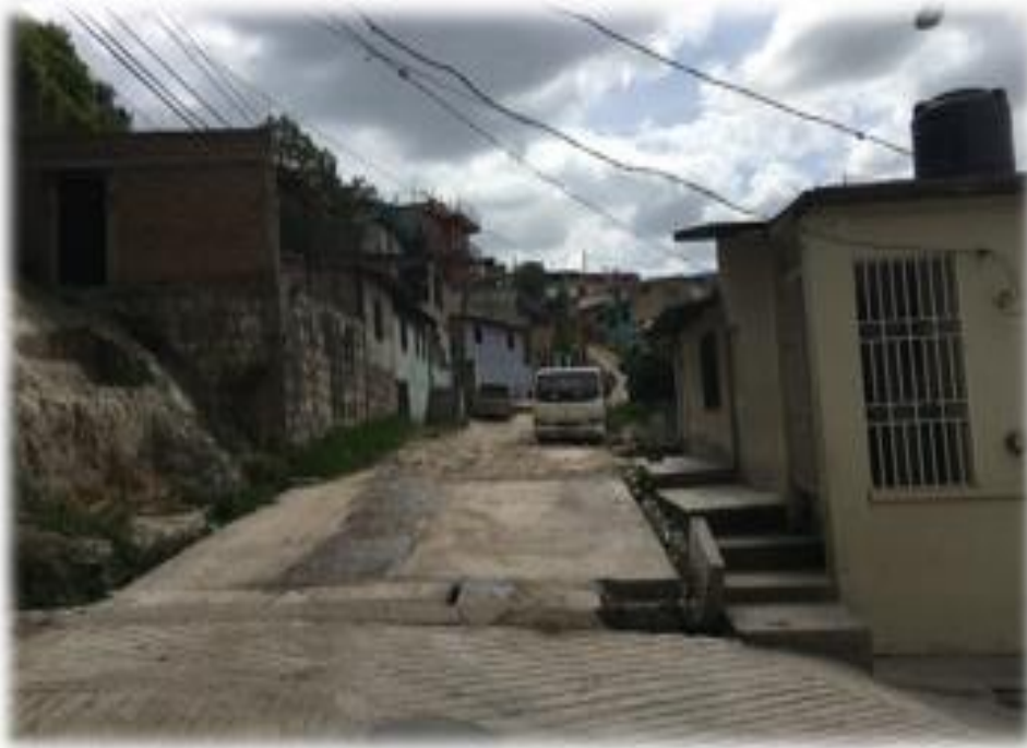
Inicio de calle a pavimentar con concreto hidráulico