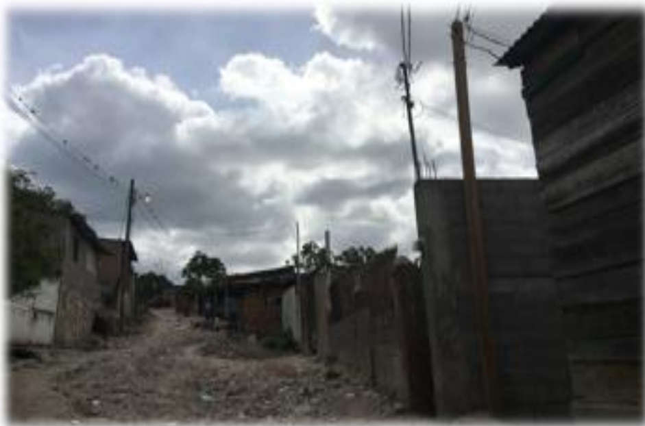
Panorama de calle a pavimentar con concreto hidráulico