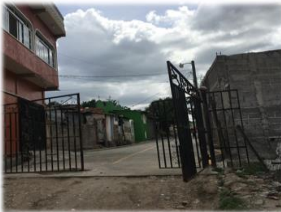
Final de calle a pavimentar con concreto hidráulico