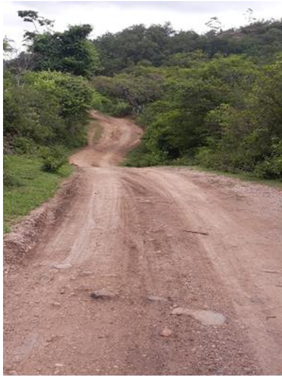
Panorama del tramo en el que se hará el balastado