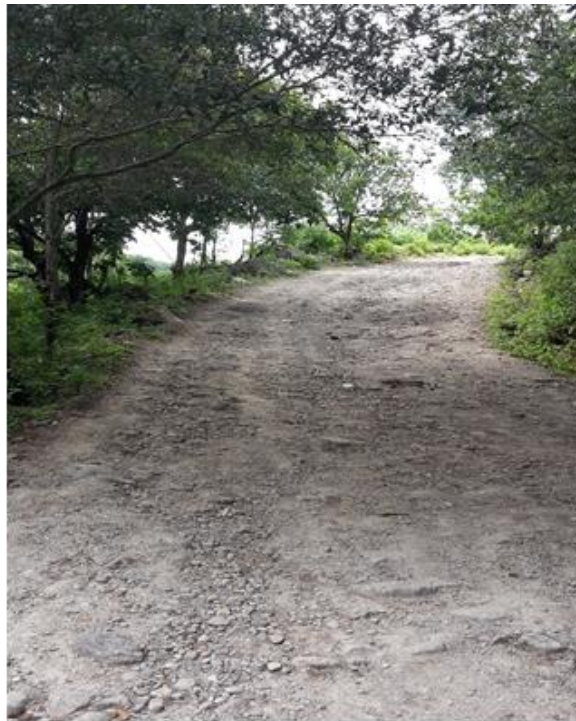
Panorama del tramo en el que se hará el balastado