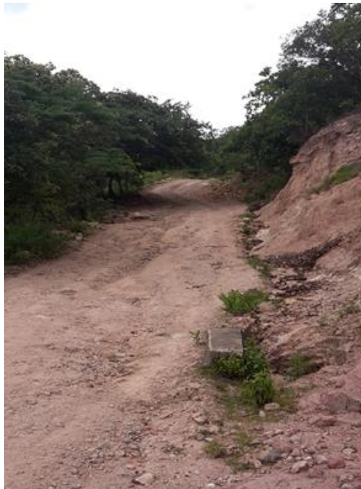
Panorama del tramo en el que se hará el balastado