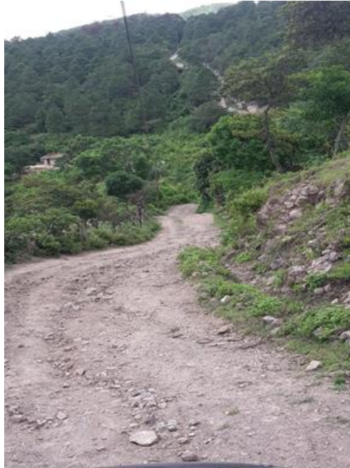
Panorama del tramo en el que se hará el balastado