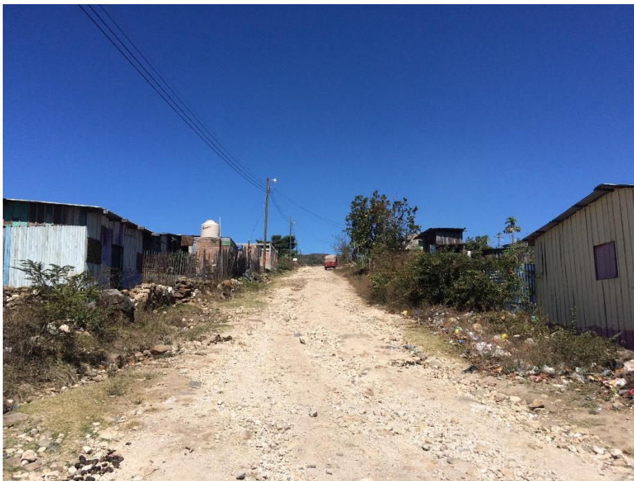
Se observan las malas condiciones en que se encuentra una de las calles a balastar