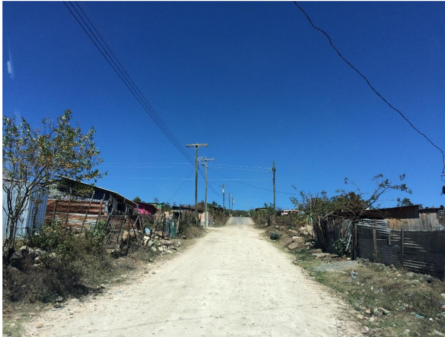
Condiciones actuales de tramo no pavimentado de la calle principal