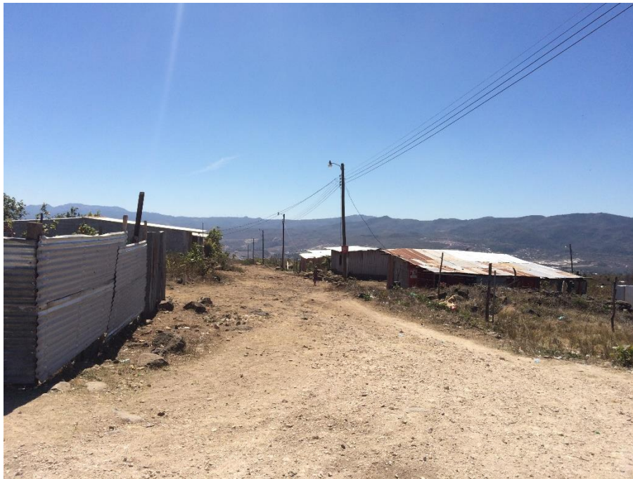
Vista de otro tramo de calle a conformar y balastar