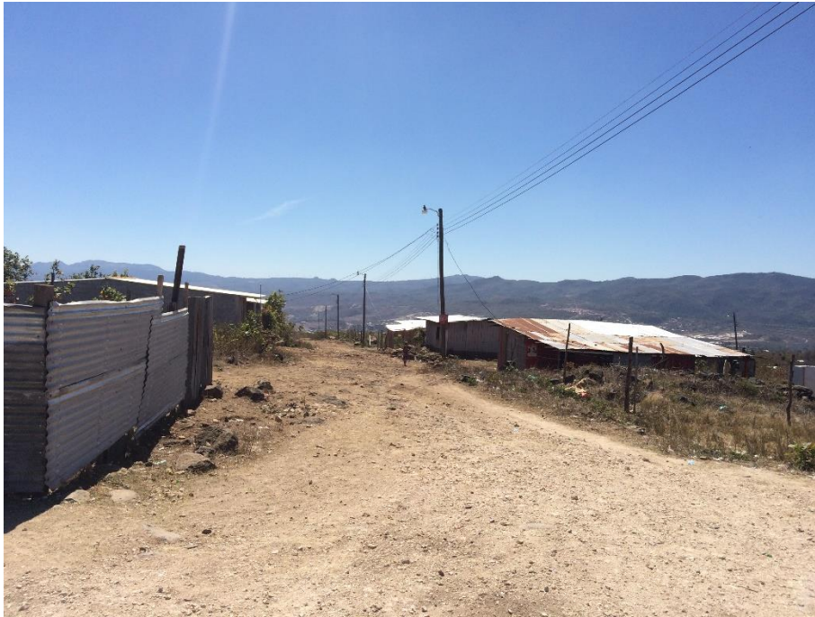
Condiciones actuales de una de las calles a conformar y balastar