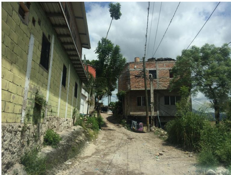
VISTA PANORÁMICA DE CALLE A PAVIMENTAR