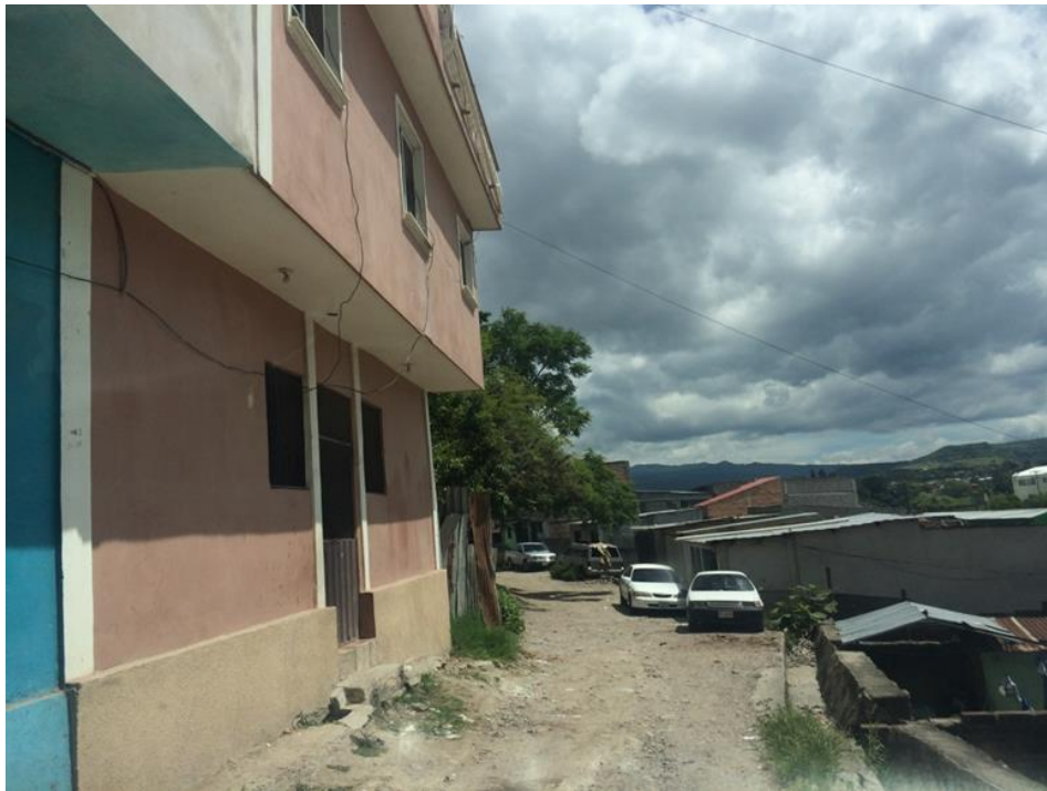
VISTA DE ESTADO ACTUAL DE CALLE A PAVIMENTAR

Proyecto: Pavimentación de calle con concreto hidráulico, col. Jardines de San José del Pedregal Código: 1412