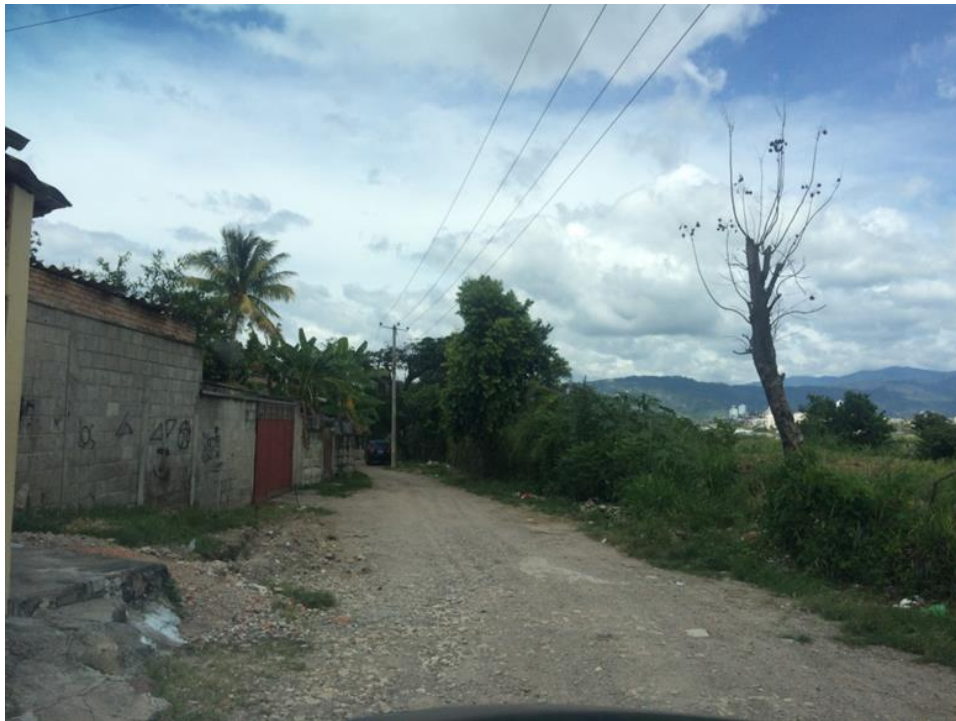
VISTA PANORÁMICA DE CALLE A PAVIMENTAR

Proyecto: Pavimentación de calle con concreto hidráulico, col. Jardines de San José del Pedregal Código: 1412