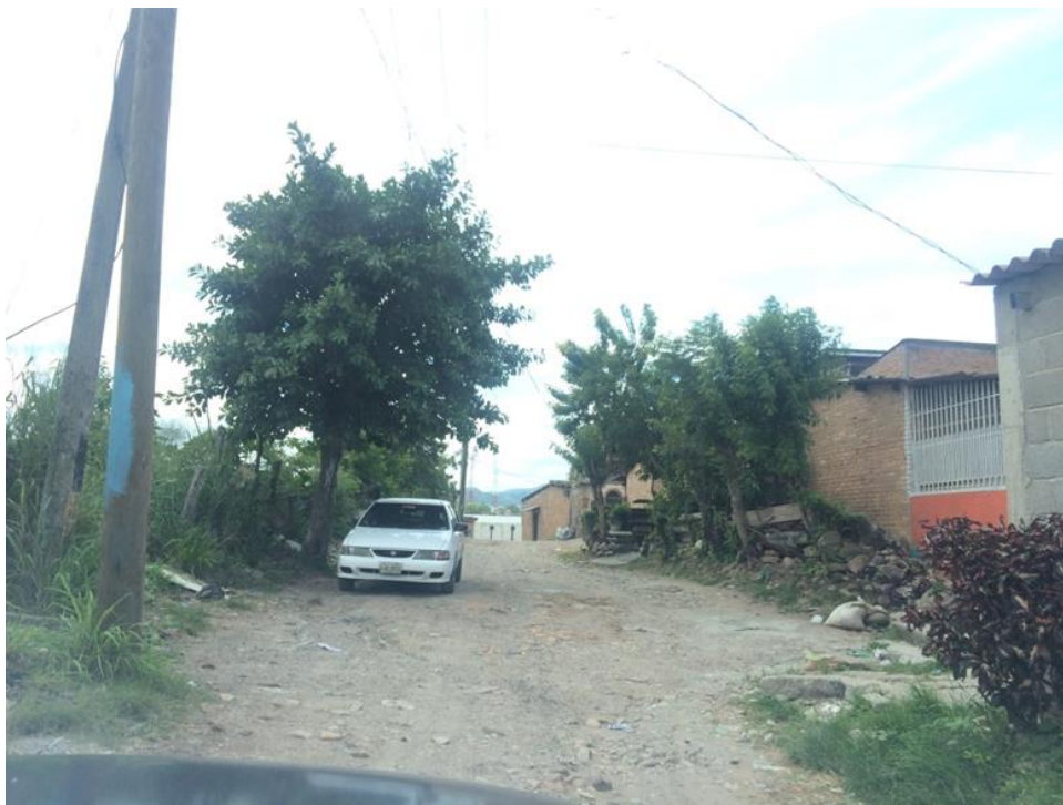
VISTA ESTADO ACTUAL DE CALLE A PAVIMENTAR