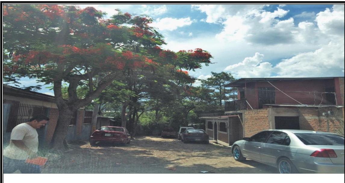
No. 2 Proyecto: PAVIMENTACION DE CALLE CON CONCRETO HIDRAULICO, COL. LAS TORRES, CALLE A LAS GRADAS Fecha: JUNIO 2017 Se observa el ancho de la calle y la pendiente del terreno.