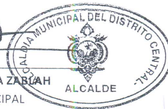
NASRY JUAN ASFURA ZABLAH ALCALDE MUNICIPAL