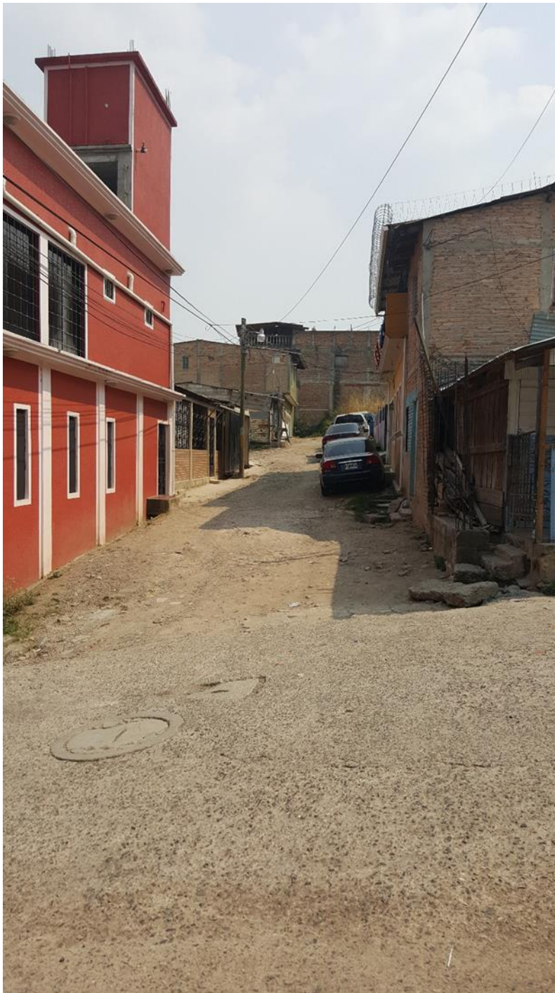
TRAMO A PAVIMENTAR