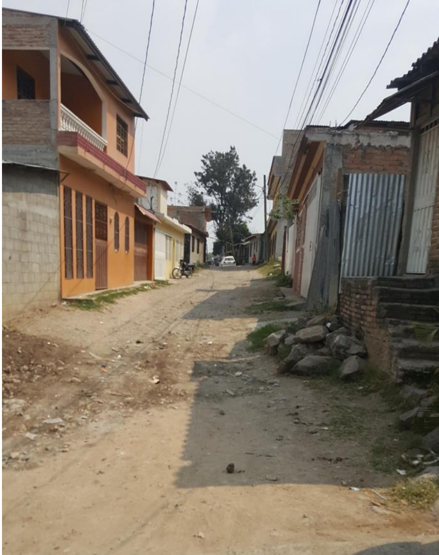
INICIO DEL PAVIMENTO

Proyecto: Pavimentación de calle con concreto hidráulico, colonia Jardines del Norte Código: 1228