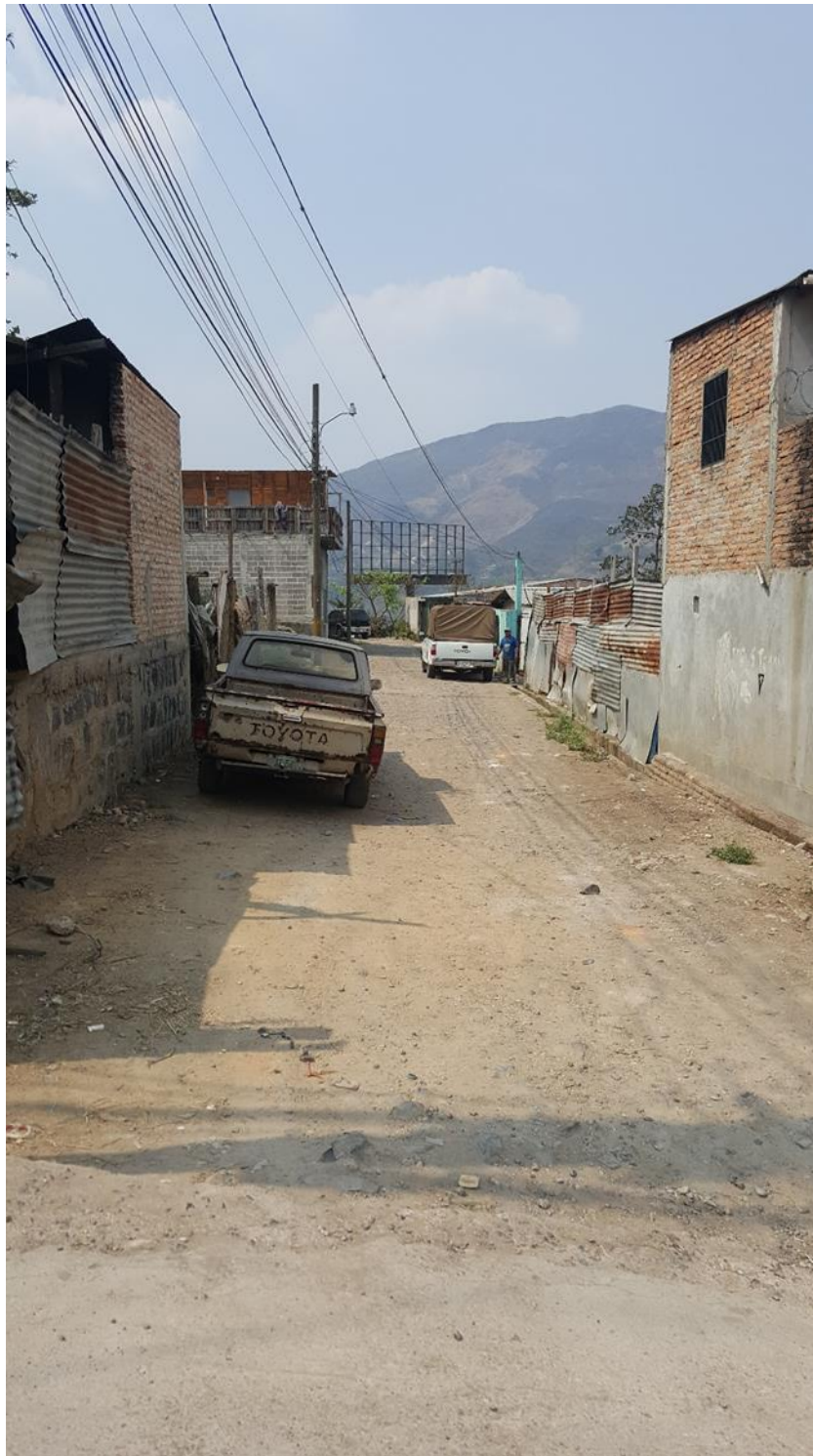
TRAMO A PAVIMENTAR