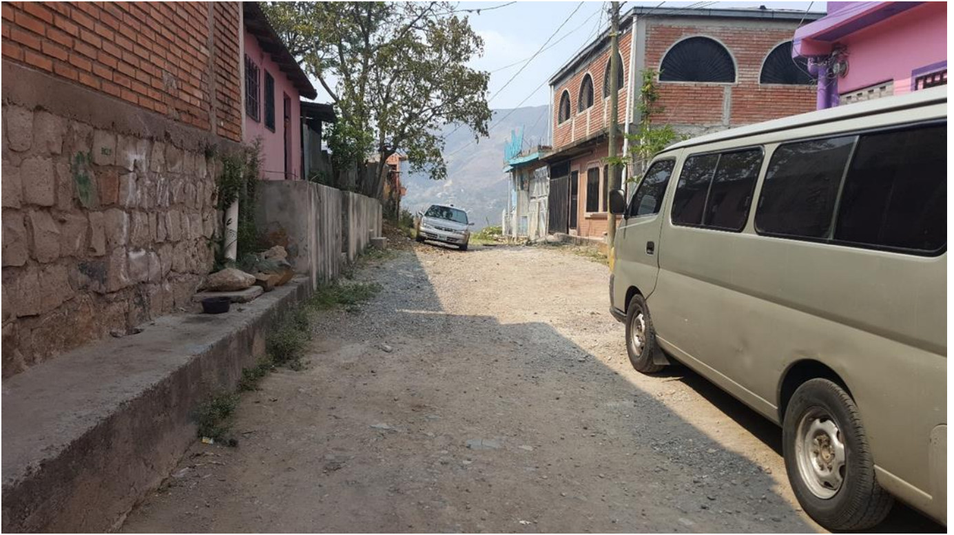
FIN DEL PAVIMENTO