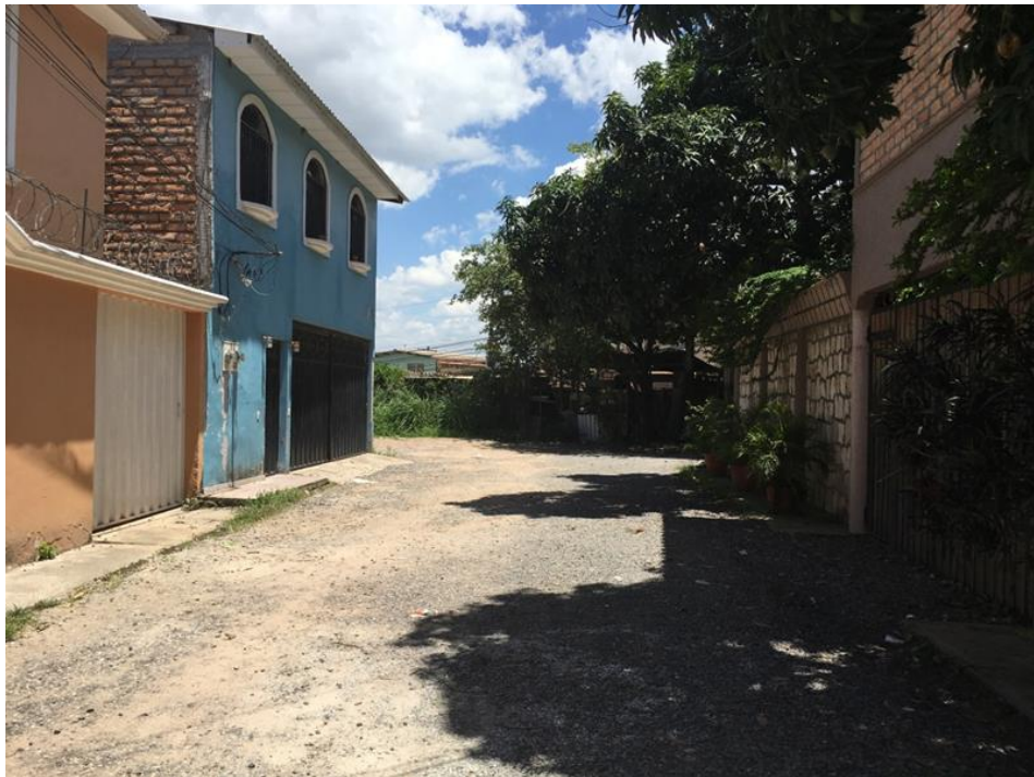
Final de calle a pavimentar tramo II