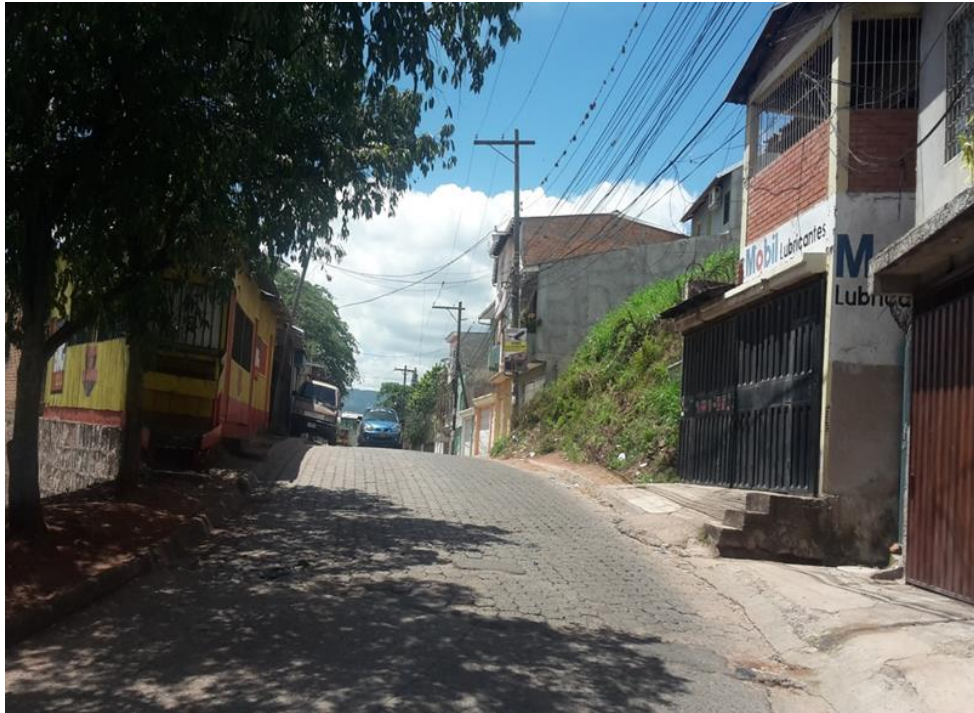
Inicio de calle a pavimentar tramo I