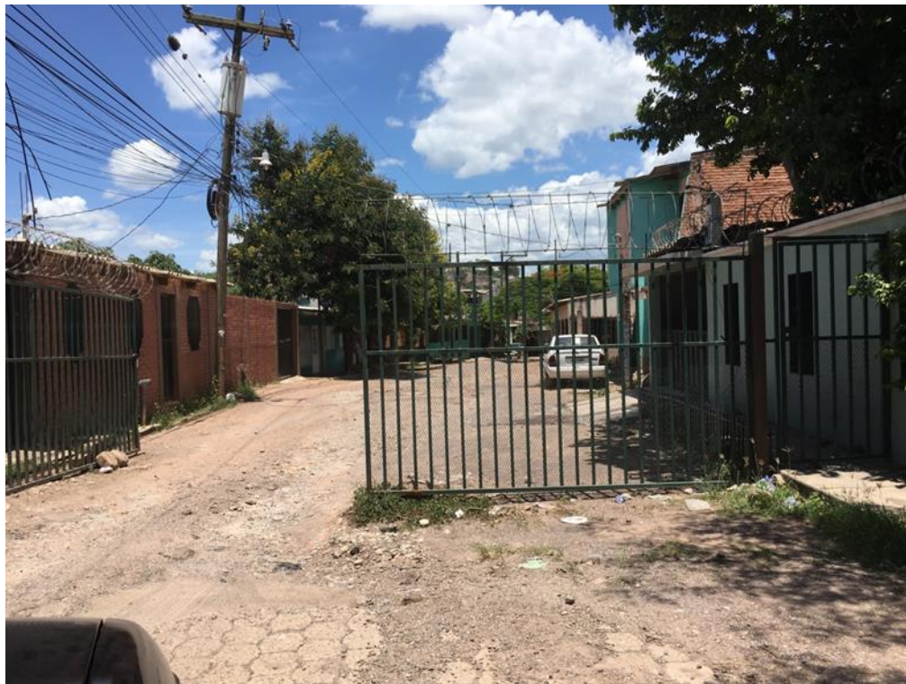
Final de calle a pavimentar tramo I