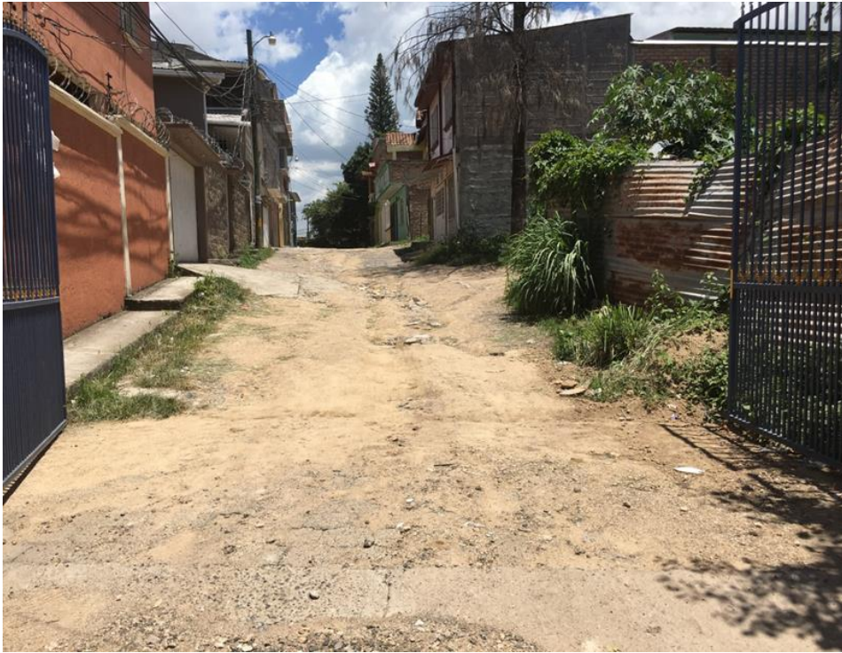
Inicio de calle a pavimentar tramo II

Proyecto: Pavimentación de calle con concreto hidráulico, acceso a col. La Joya Código: 1399