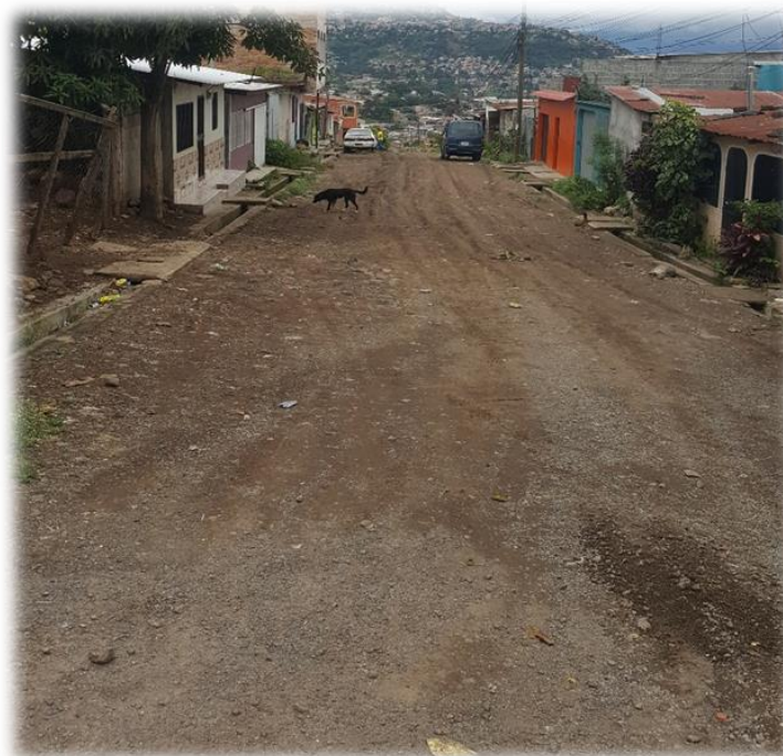
VISTA DE CALLE A PAVIMENTAR CON CONCRETO HIDRÁULICO