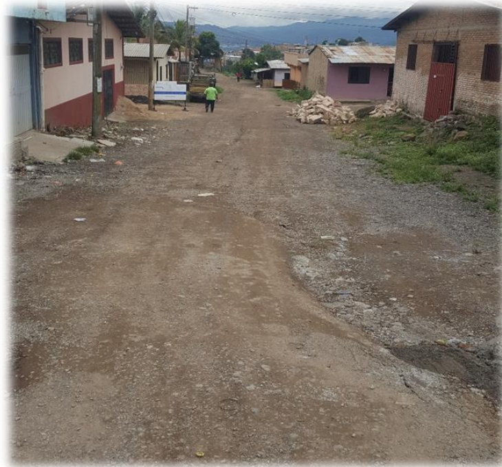
VISTA DEL ESTADO DE LA CALLE

Proyecto: Pavimentación de calle con concreto hidráulico, col. Cantarero López, acceso al Anillo Periférico Código: 1377