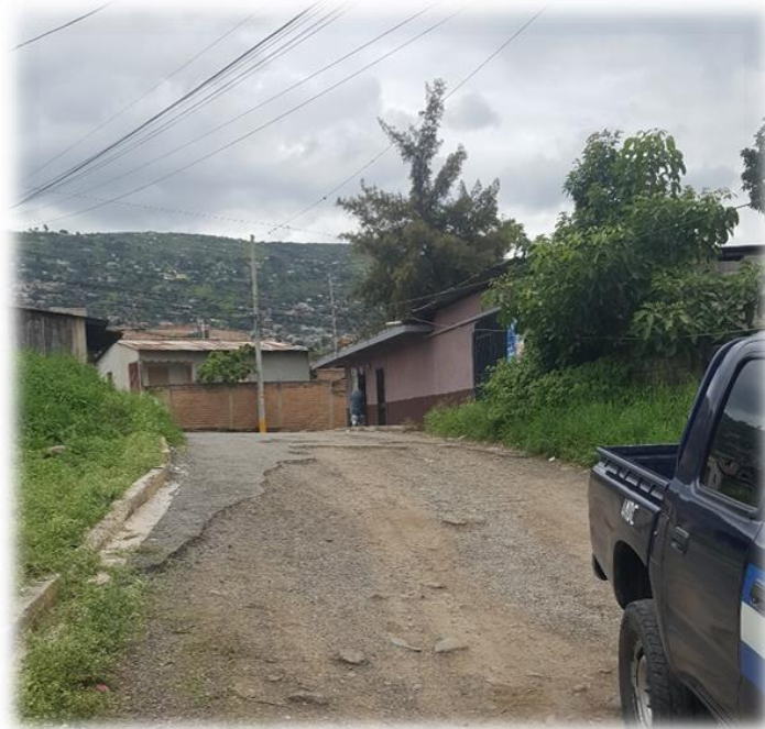
INICIO DE PAVIMENTACIÓN CON CONCRETO HIDRÁULICO

Proyecto: Pavimentación de calle con concreto hidráulico, col. Cantarero López, acceso al Anillo Periférico Código: 1377