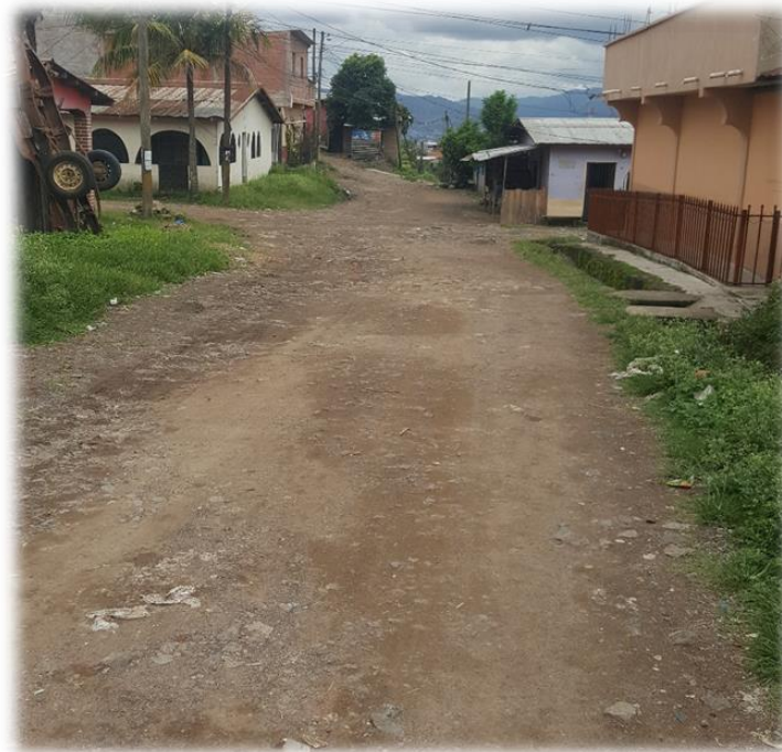
FINAL DE PAVIMENTO CON CONCRETO HIDRÁULICO