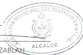
NASRY JUAN ASFURA ZABLAH ALCALDE MUNICIPAL