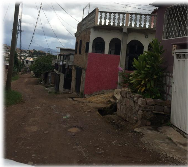
VISTA DE CALLE A PAVIMENTAR CON CONCRETO HIDRÁULICO.