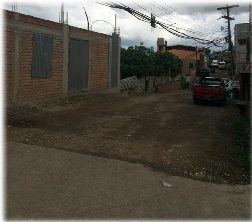
INICIO DE PAVIMENTACIÓN CON CONCRETO HIDRÁULICO

Proyecto: Pavimentación de calle con concreto hidráulico, col. Carrizal N° 1 Código: 1366