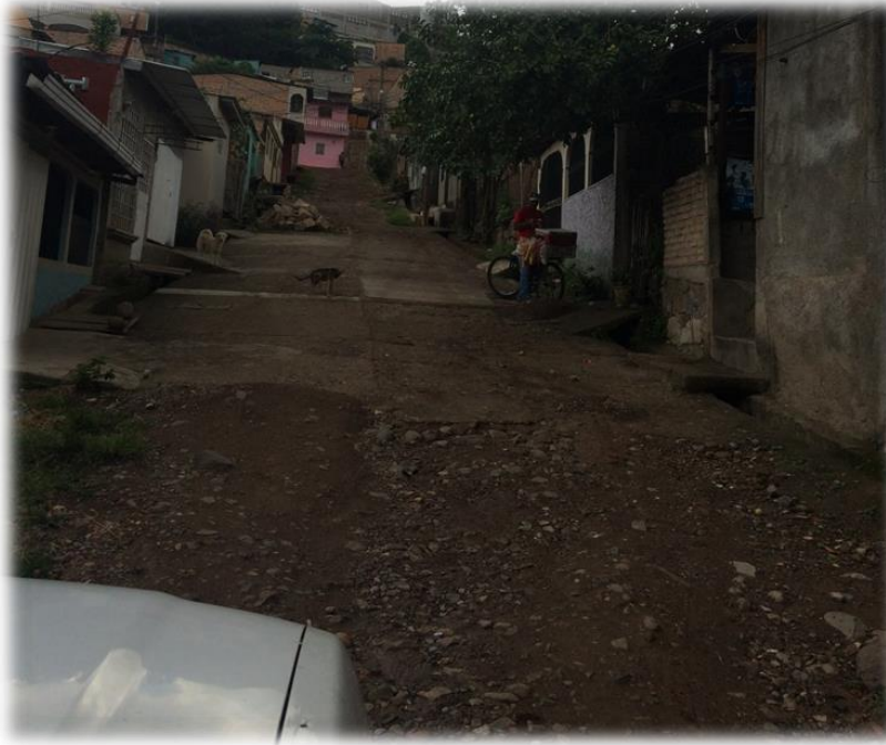
LOSAS A DEMOLER

Proyecto: Pavimentación de calle con concreto hidráulico, col. Carrizal N° 1 Código: 1366