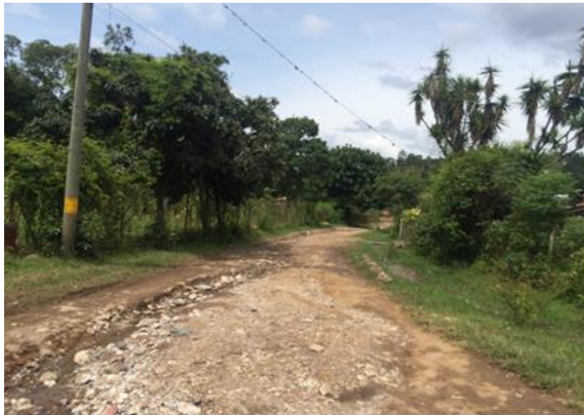
CALLE INTERNA DE ALDEA ZAMBRANO DONDE SE REQUIERE BALASTADO.