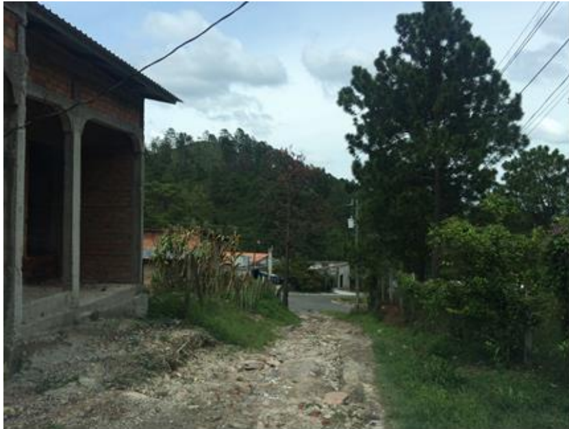
UNA DE LAS VIAS DE ACCESO QUE CONDUCEN A LA ALDEA ZAMBRANO PROVENIENTE DE LA CARRETERA CA-5.