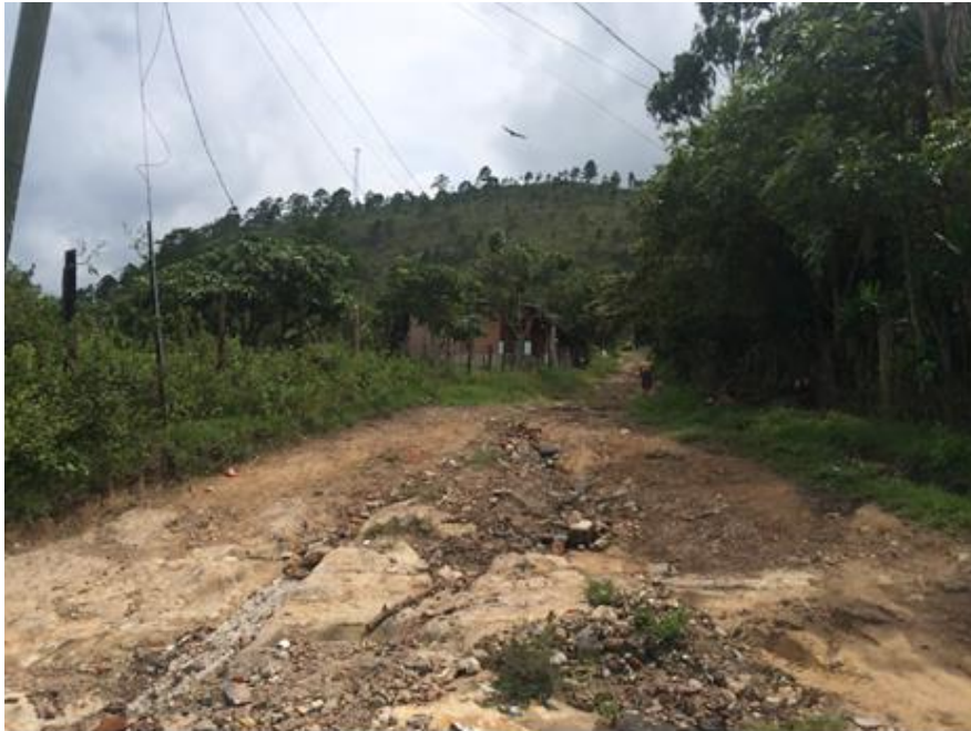
CONDICIÓN ACTUAL DE CALLE A REPARAR EN ALDEA ZAMBRANO.