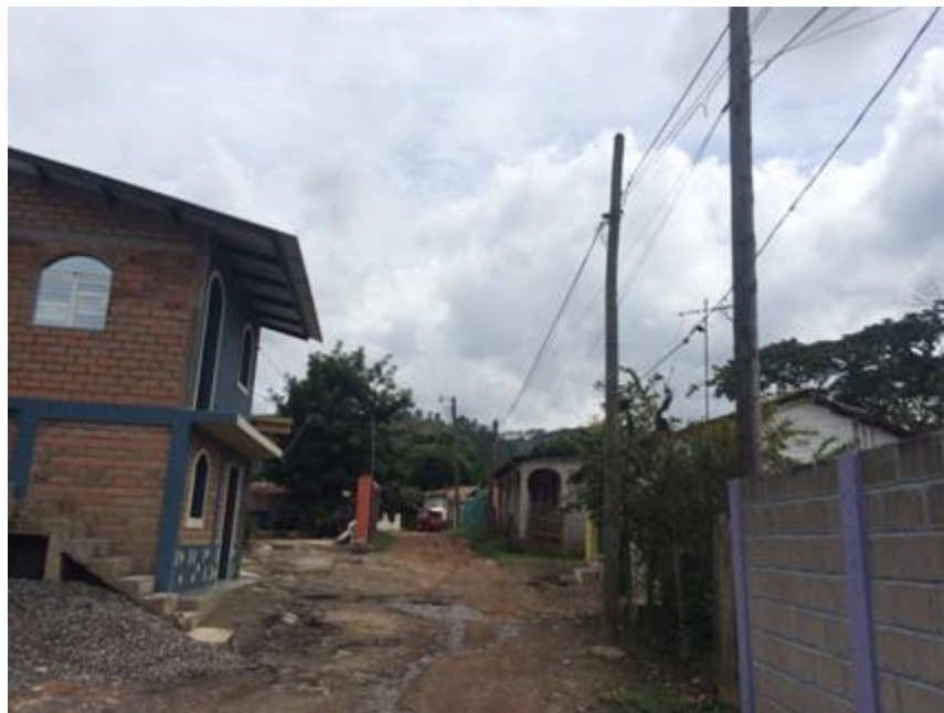
VISTA DE CALLE QUE REQUIERE BALASTADO EN ALDEA ZAMBRANO.