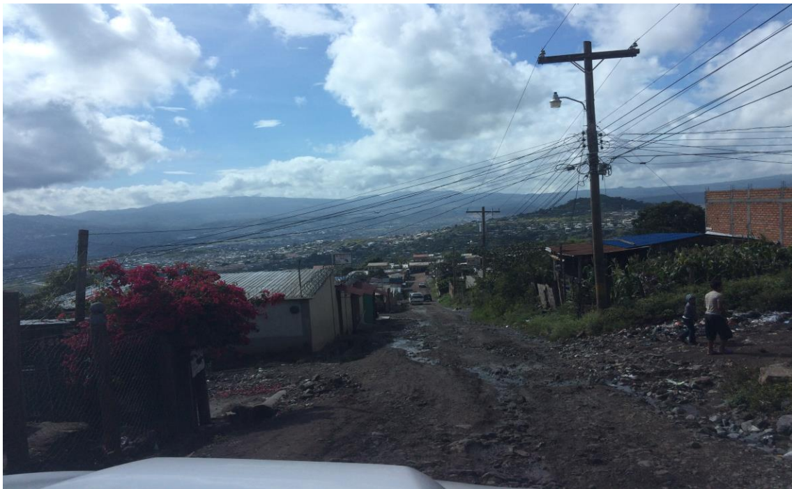
OTRA VISTA DE LA CALLE A REPARAR