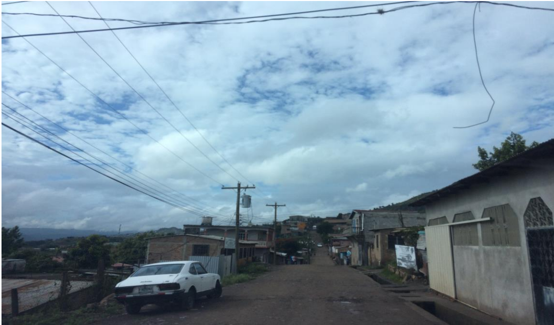
INICIO DE CALLE A CONFORMAR

Proyecto: Conformación y balastado de calles, ruta colonia José Ángel Ulloa-Ciudad Guzmán Código: 1407