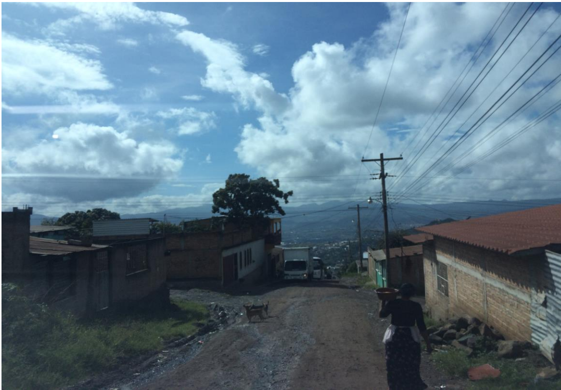
VISTA DEL MAL ESTADO DE LA CALLE

Proyecto: Conformación y balastado de calles, ruta colonia José Ángel Ulloa-Ciudad Guzmán Código: 1407