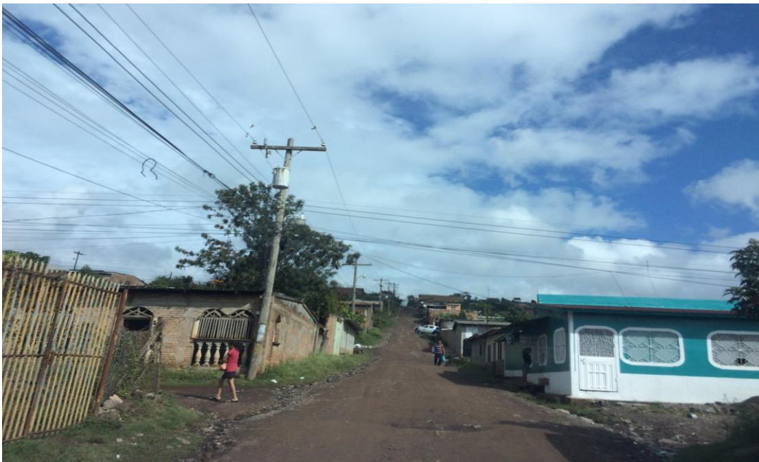
VISTA PANORAMICA DE LA CALLE A REPARAR