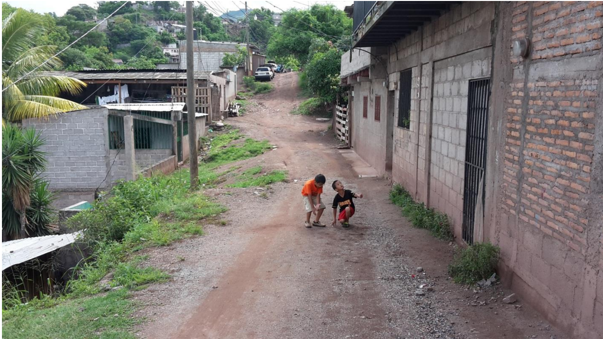
Vista de calle a reparar