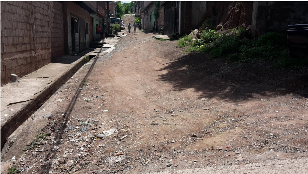
Final de calle a pavimentar