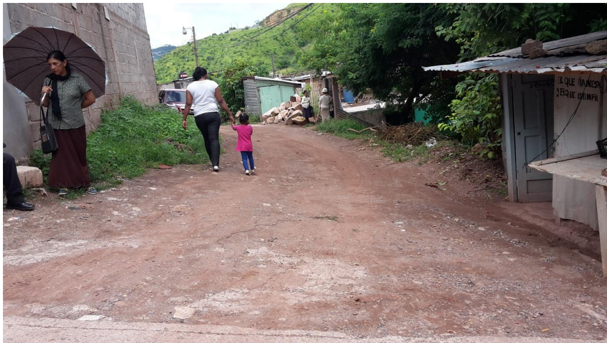
Inicio de calle a pavimentar