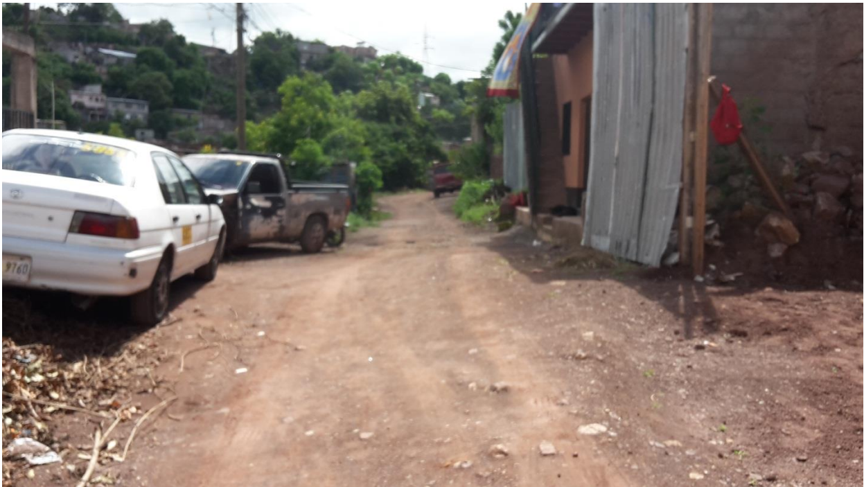
Vista panorámica de calle a pavimentar con concreto hidráulico