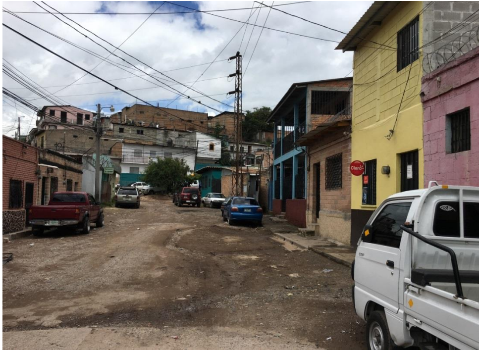
INICIO DE LA CALLE A PAVIMENTAR