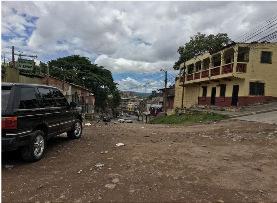
VISTA PANORAMICA DE LA CALLE