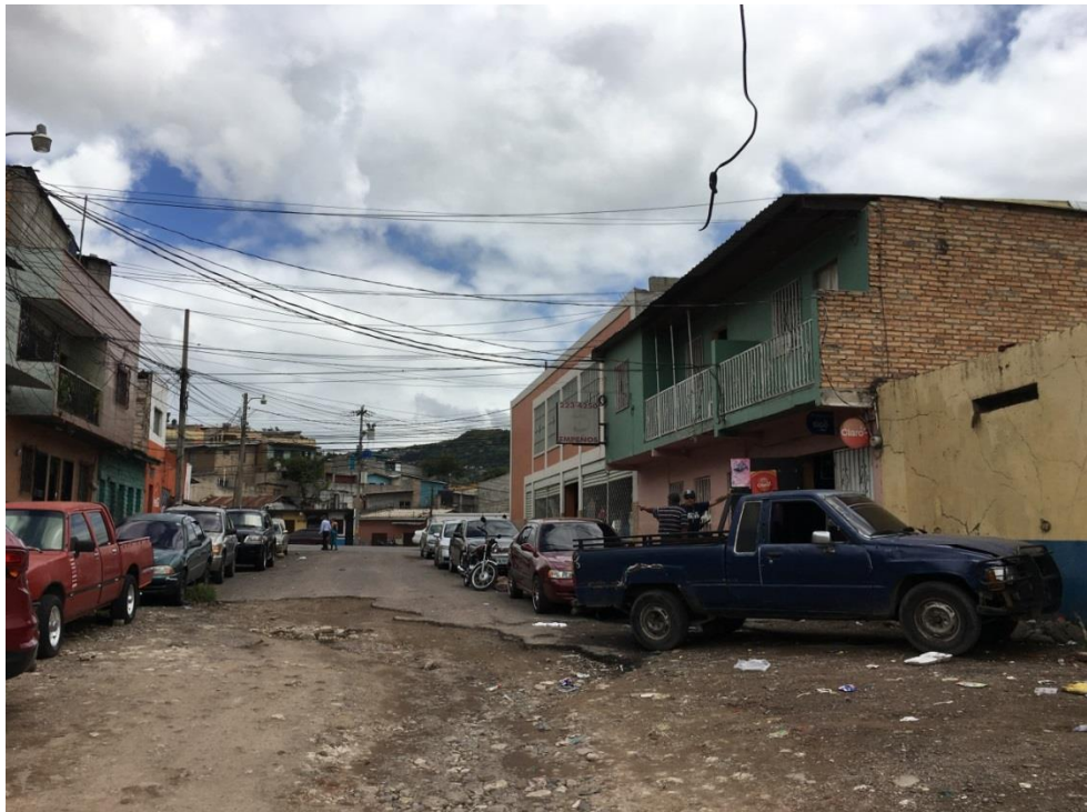
FINAL DE LA CALLE A PAVIMENTAR