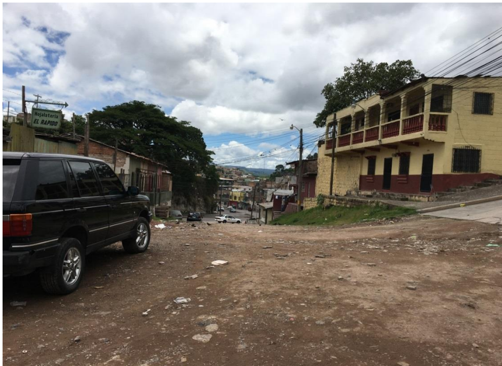
VISTA DE LA CALLE EN MAL ESTADO