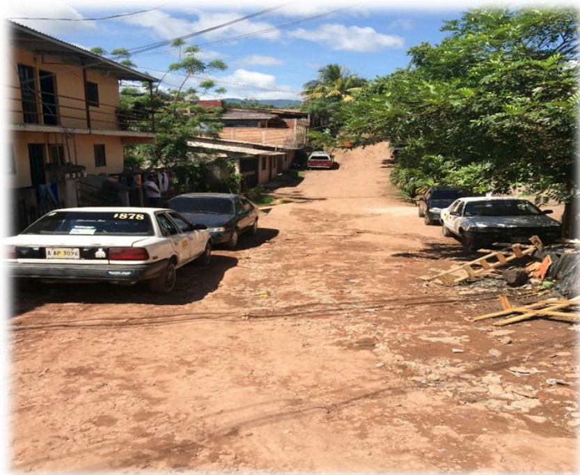
VISTA DE CALLE A PAVIMENTAR CON CONCRETO HIDRÁULICO