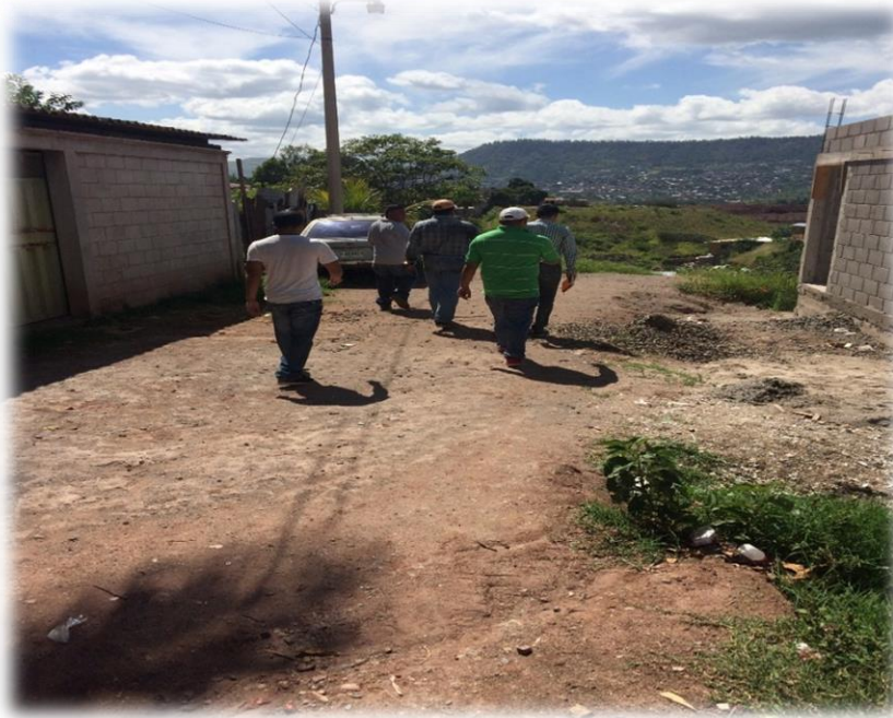
VISTA DE CALLE A PAVIMENTAR CON CONCRETO HIDRÁULICO

Proyecto: Pavimentación de calle con concreto hidráulico, col. El Jazmine, calle Santa Rosa y calle Amapala Código: 1345