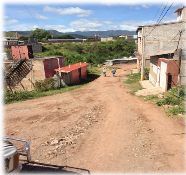
FINAL DE PAVIMENTO CON CONCRETO HIDRÁULICO