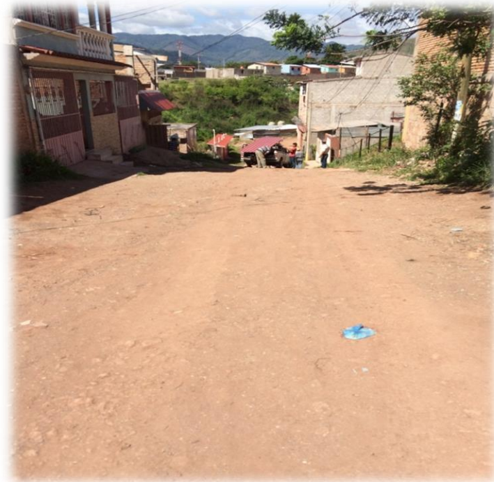
VISTA DEL ESTADO DE LA CALLE A PAVIMENTAR

Proyecto: Pavimentación de calle con concreto hidráulico, col. El Jazmine, calle Santa Rosa y calle Amapala Código: 1345