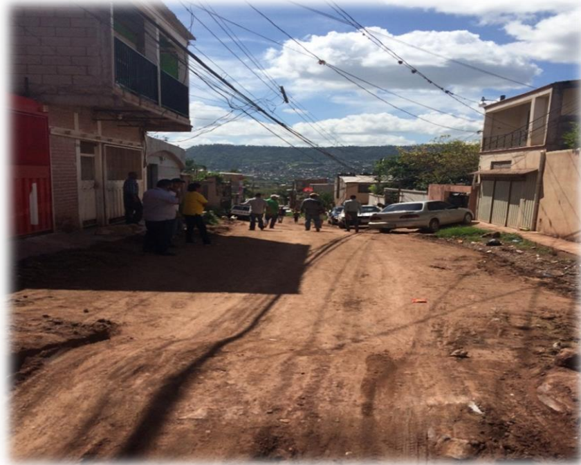
INICIO DE PAVIMENTACIÓN CON CONCRETO HIDRÁULICO

Proyecto: Pavimentación de calle con concreto hidráulico, col. El Jazmine, calle Santa Rosa y calle Amapala Código: 1345