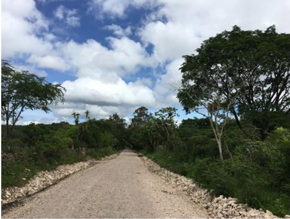
VISTA PANORAMICA DE TRAMO A REPARAR