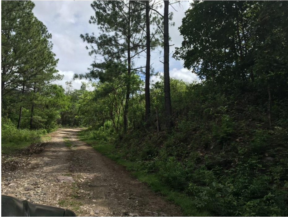
VISTA ACTUAL DEL TRAMO A REPARAR