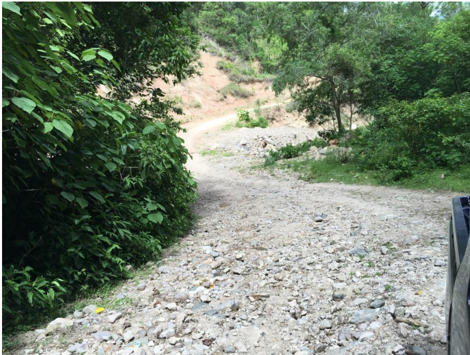
VISTA PANORAMICA DE TRAMO A REPARAR