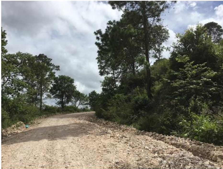
VISTA ACTUAL DEL MAL ESTADO DEL TRAMO A REPARAR