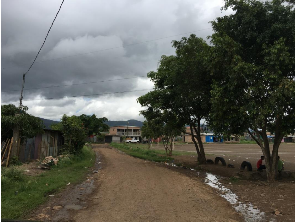
VISTA ACTUAL DEL TRAMO A REPARAR