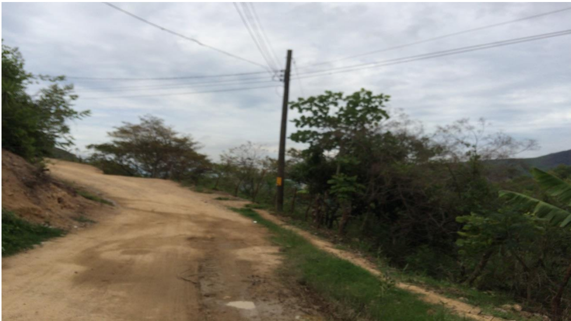
Vista panorámica de la calle a balastar