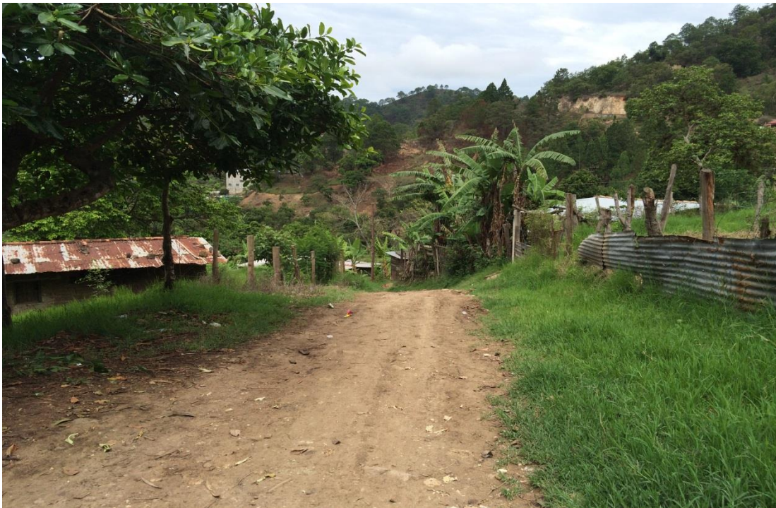
Calle construcción de huella