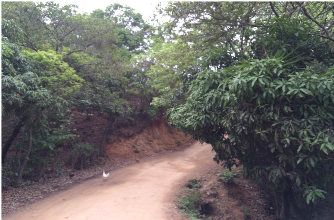
Vista de calle