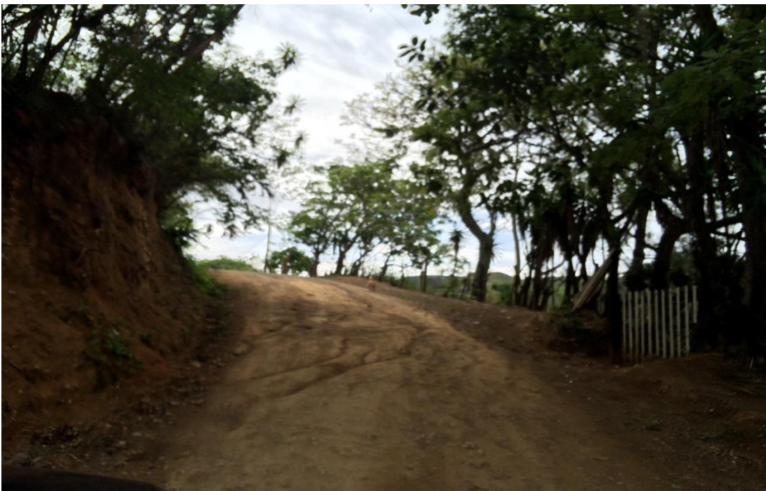
Final de calle para huella