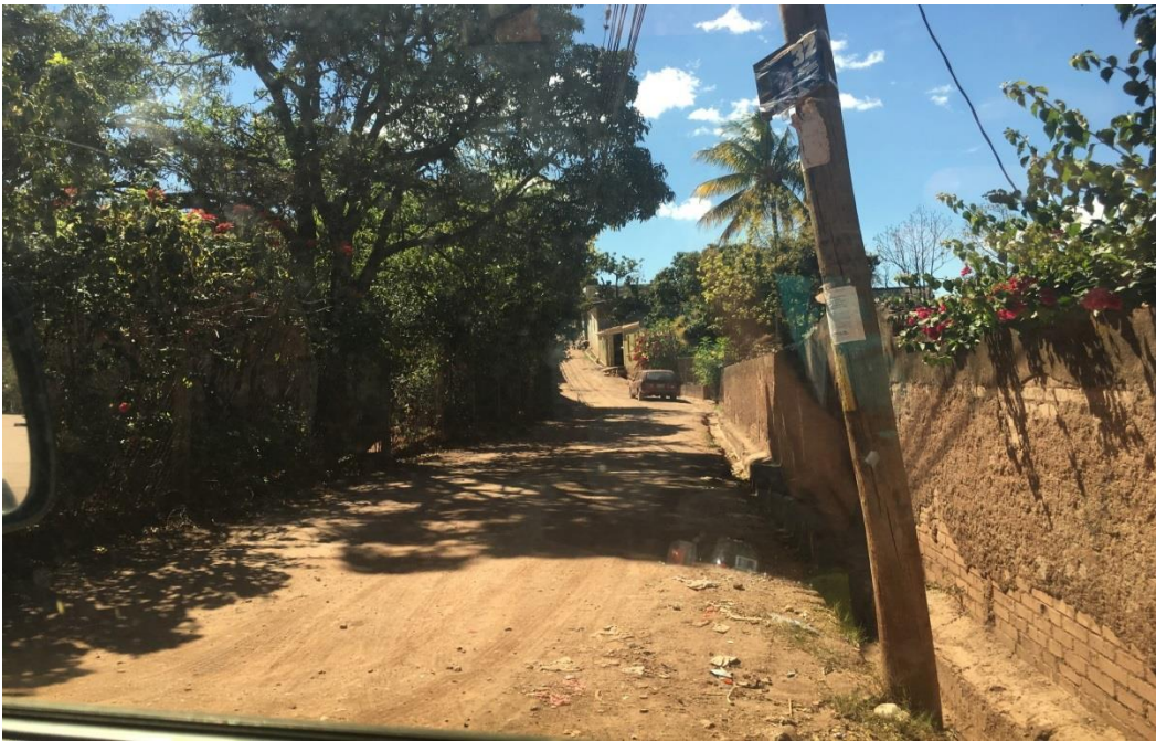
PANORAMA DE LA CALLE A PAVIMENTAR