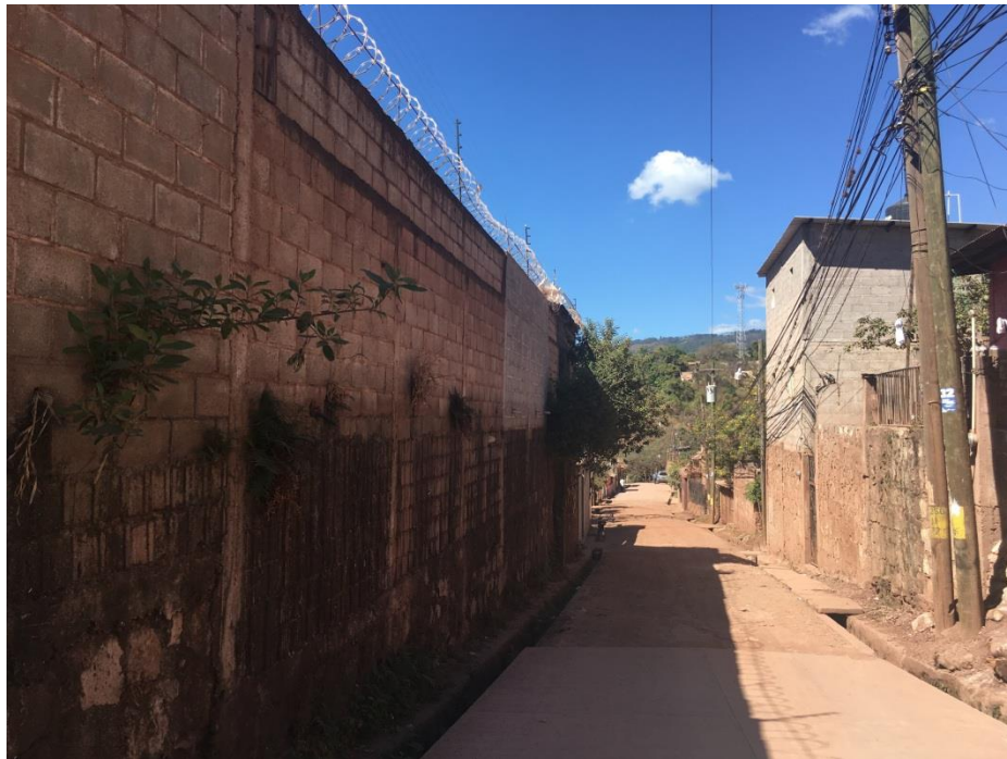
INICIO DE TRAMO A PAVIMENTAR CON CONCRETO HIDRÁULICO