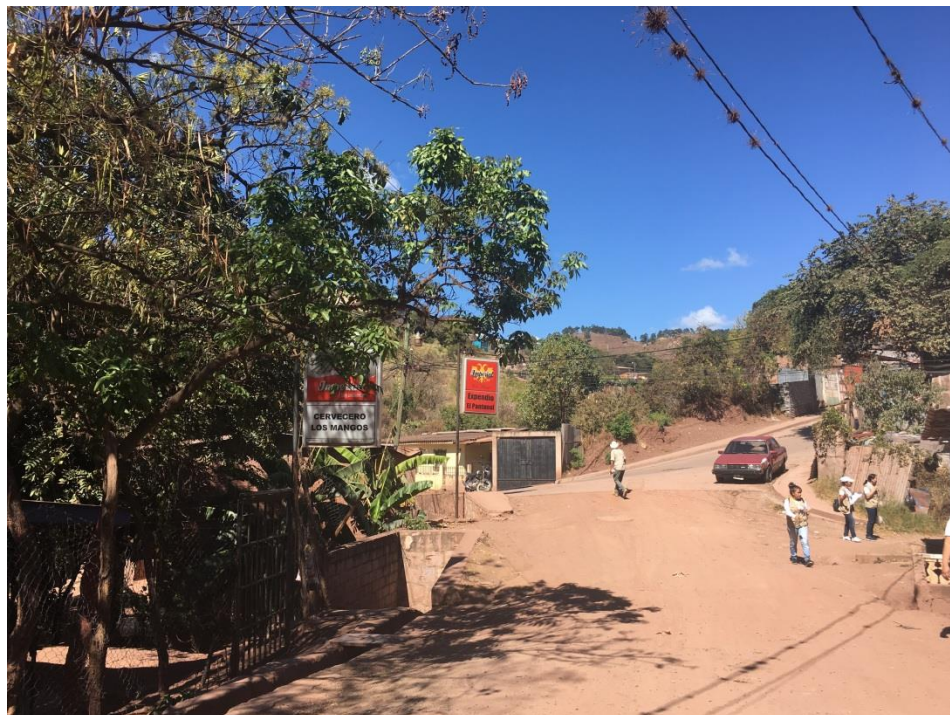
FINAL DE TRAMO A PAVIMENTAR CON CONCRETO HIDRÁULICO