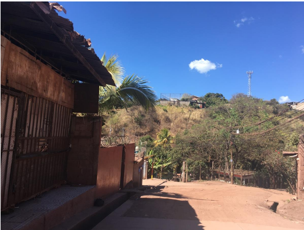
INICIO DE TRAMO A PAVIMENTAR