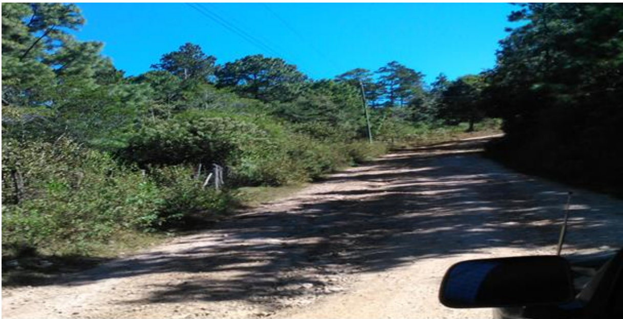
VISTA ACTUAL DE CALLE A REPARAR