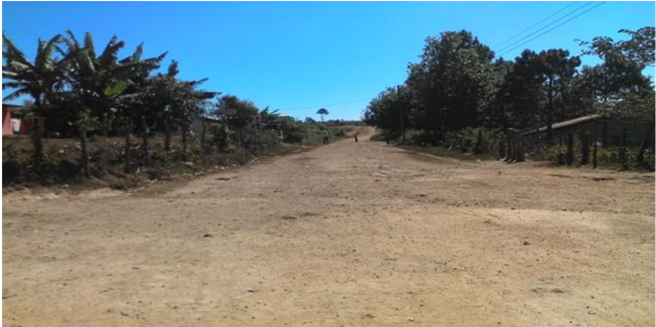
VISTA PANORAMICA DE CALLE A REPARAR