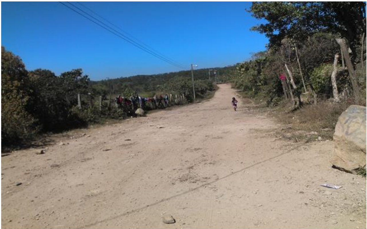
VISTA DE CALLE QUE REQUIERE BALASTADO