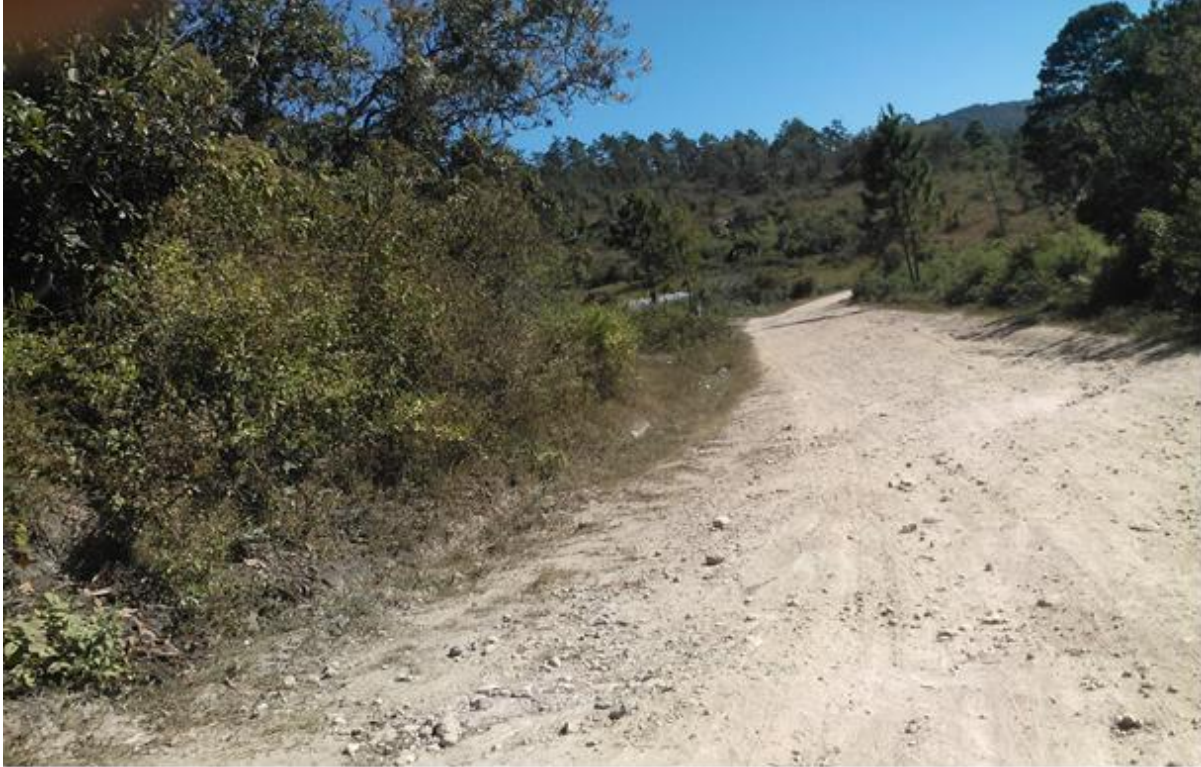
VISTA DE CALLE A REPARAR