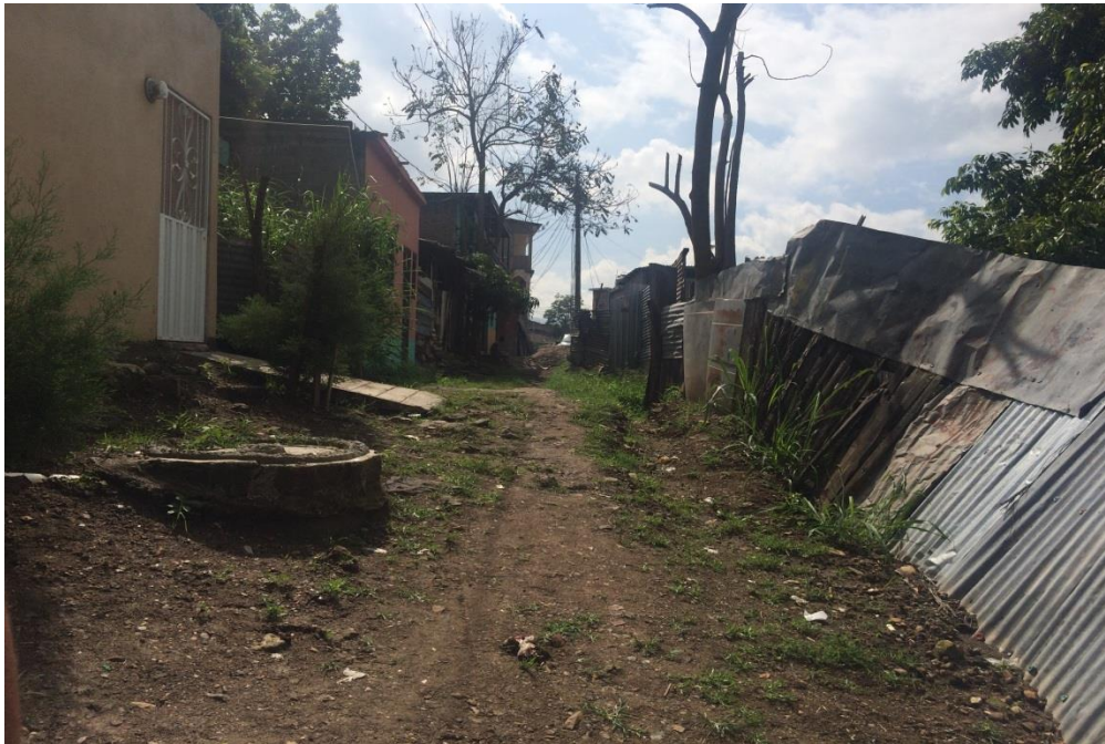
FOTO #2 CONDICIONES ACTUALES DE LA CALLE EN LA ZONA DONDE CONSTRUIRÁ MURO DE CONTENCIÓN PARA RETENCIÓN DEL TALUD Y AMPLIACIÓN DE LA CALLE