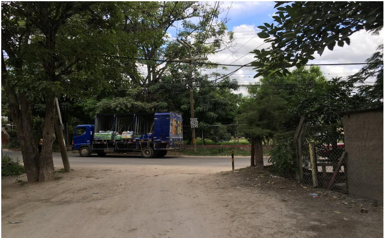
FINAL DEL TRAMO A REPARAR, TRAMO C