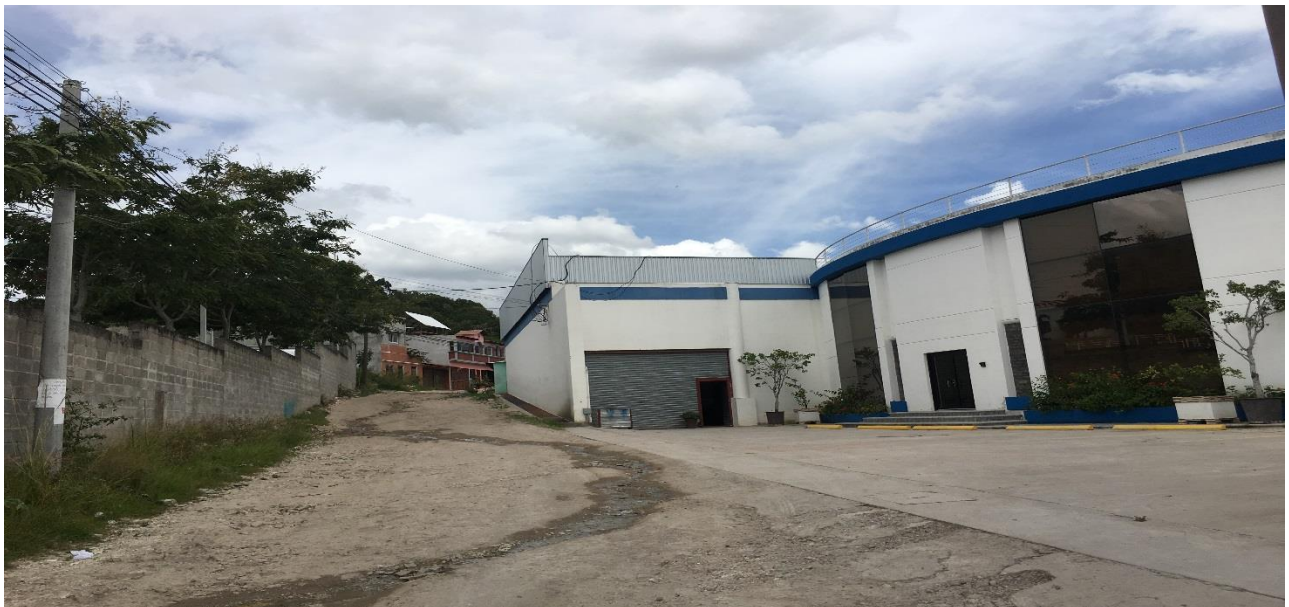
INICIO DEL TRAMO A REPARAR, TRAMO C