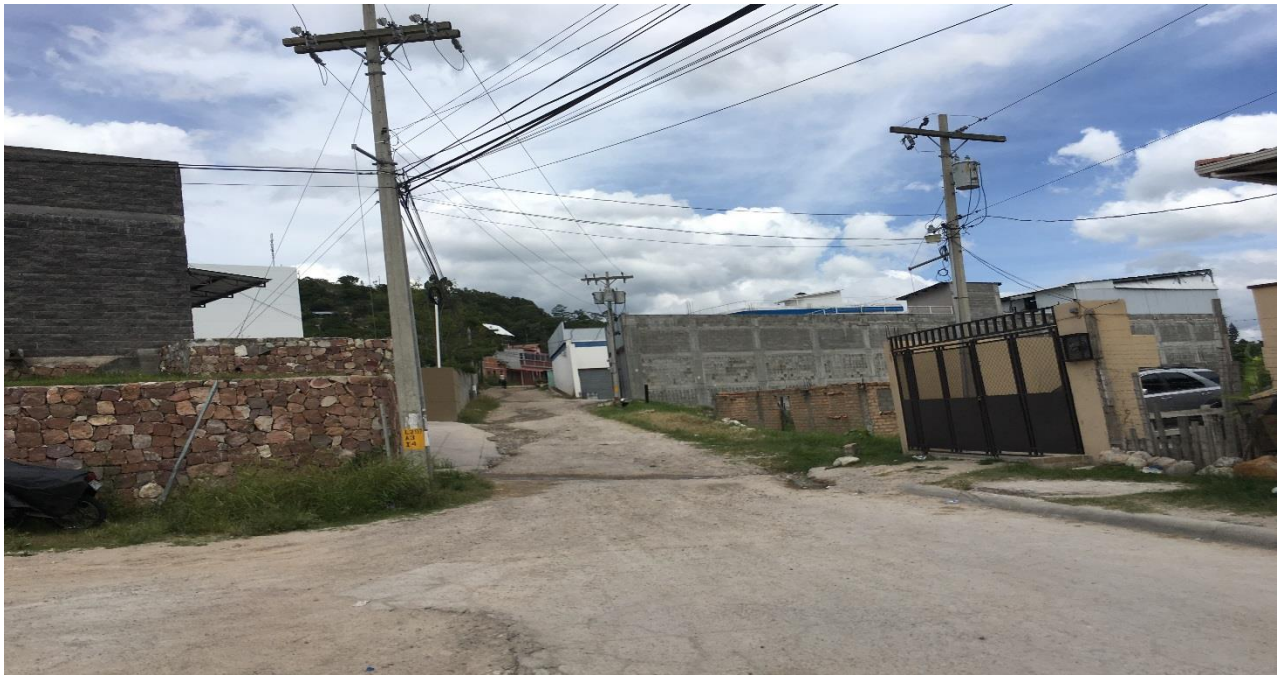
FINAL DEL TRAMO A REPARAR, TRAMO B