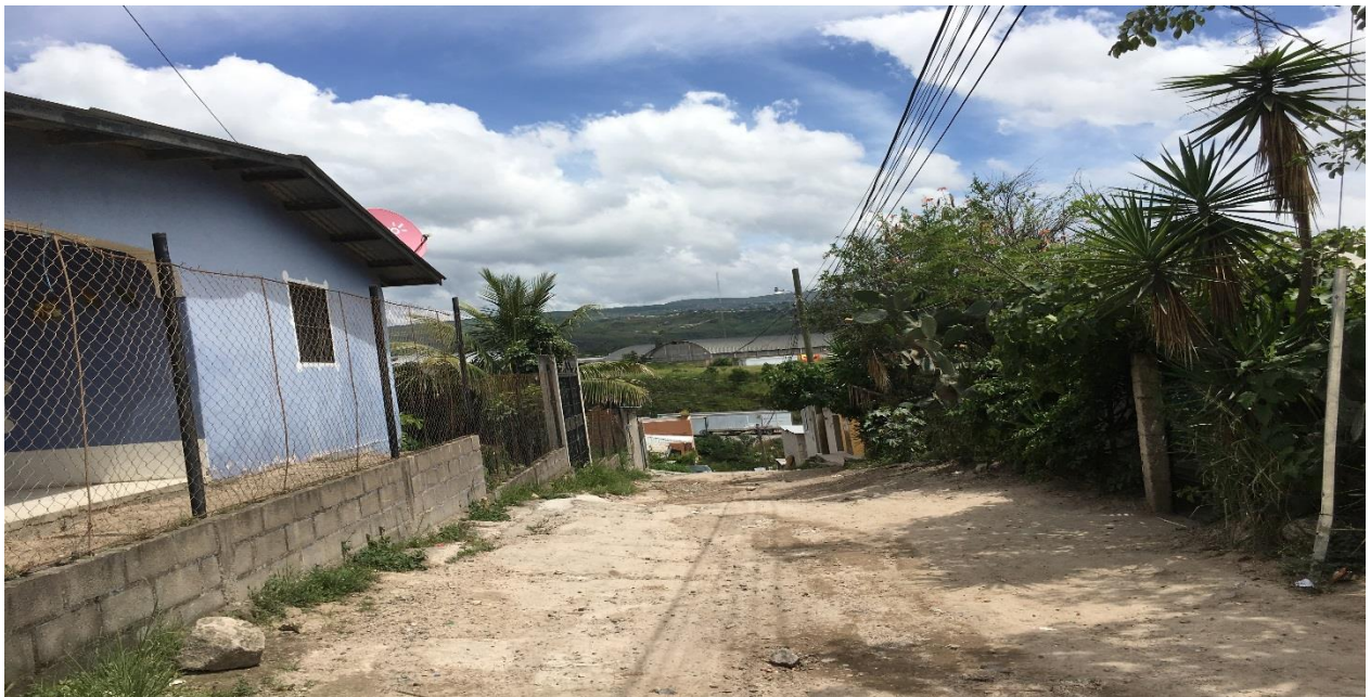
UNO DE LOS CALLEJONES A REPARAR