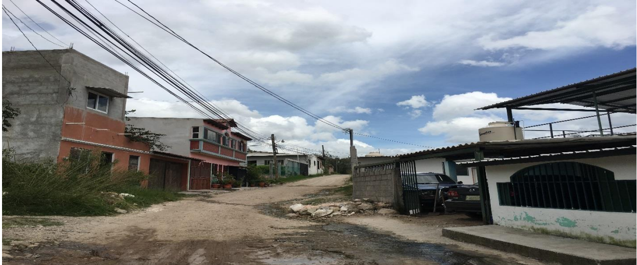
VISTA PANORAMICA DEL TRAMO A REPARAR