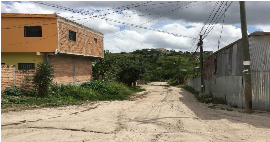
FINAL DEL TRAMO A REPARAR, TRAMO A