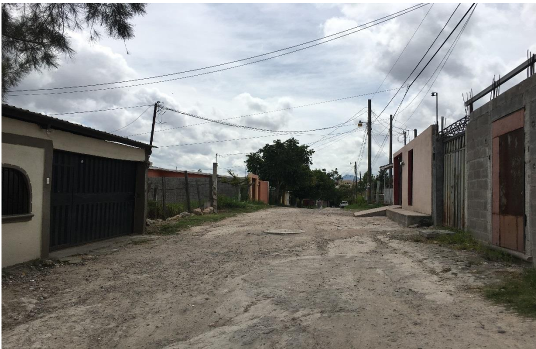
VISTA ACTUAL DEL MAL ESTADO DEL TRAMO A REPARAR