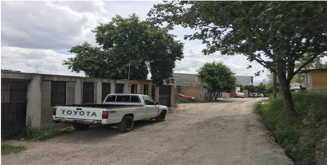
INICIO DEL TRAMO A REPARAR, TRAMO A