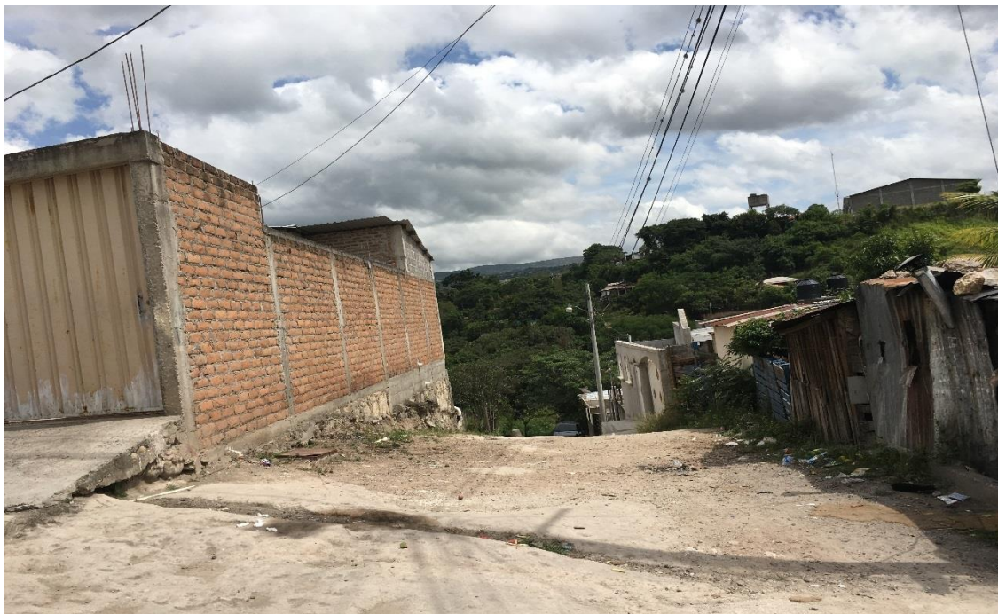
INICIO DEL TRAMO A REPARAR, TRAMO B