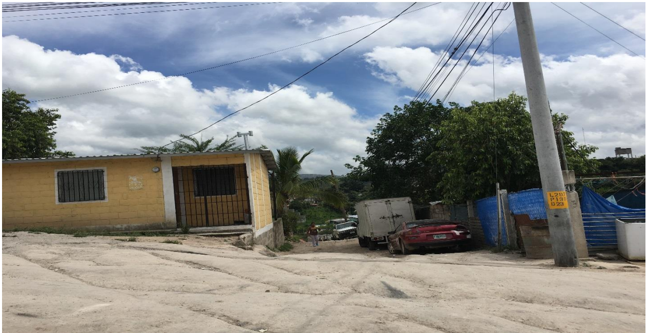
VISTA PANORAMICA DEL MAL ESTADO DEL TRAMO A REPARAR