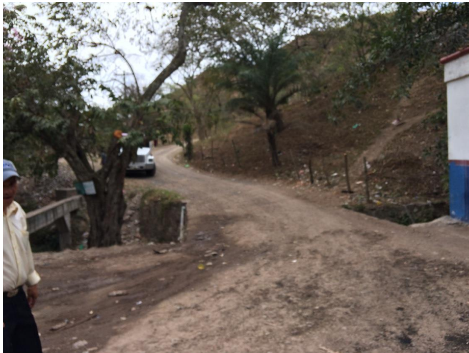
CALLE A PAVIMENTAR CON CONCRETO HIDRÁULICO