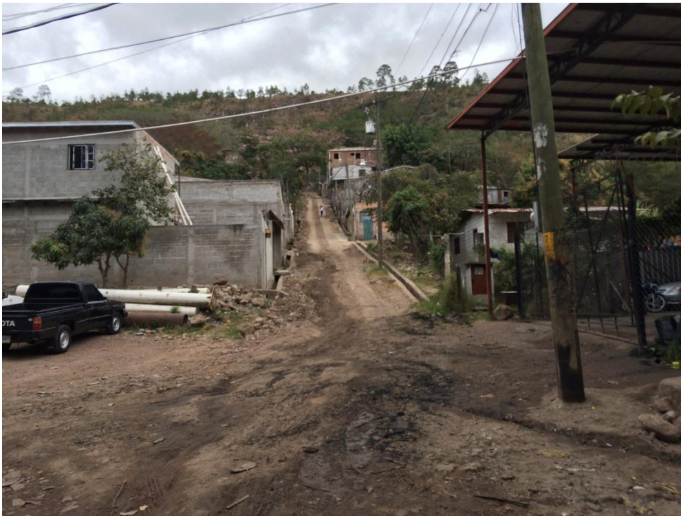
PANORAMA DE LA CALLE A PAVIMENTAR