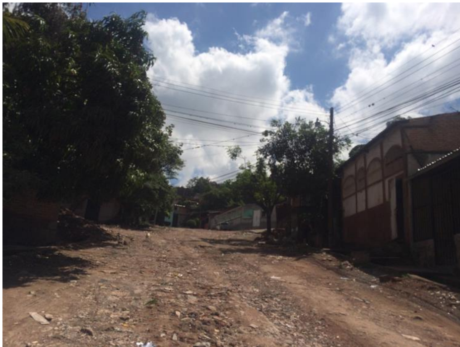
VISTA TRAMO INTERMEDIO DE CALLE A PAVIMENTAR