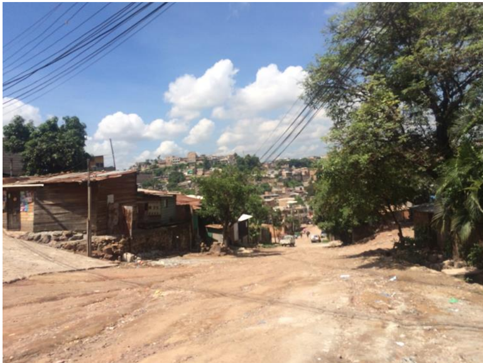
VISTA PANORAMICA DE CALLE A PAVIMENTAR