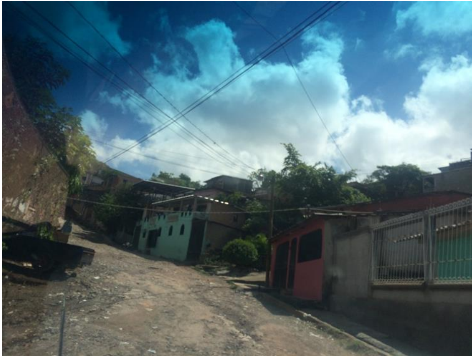
VISTA PANORAMICA DE CALLE A PAVIMENTAR