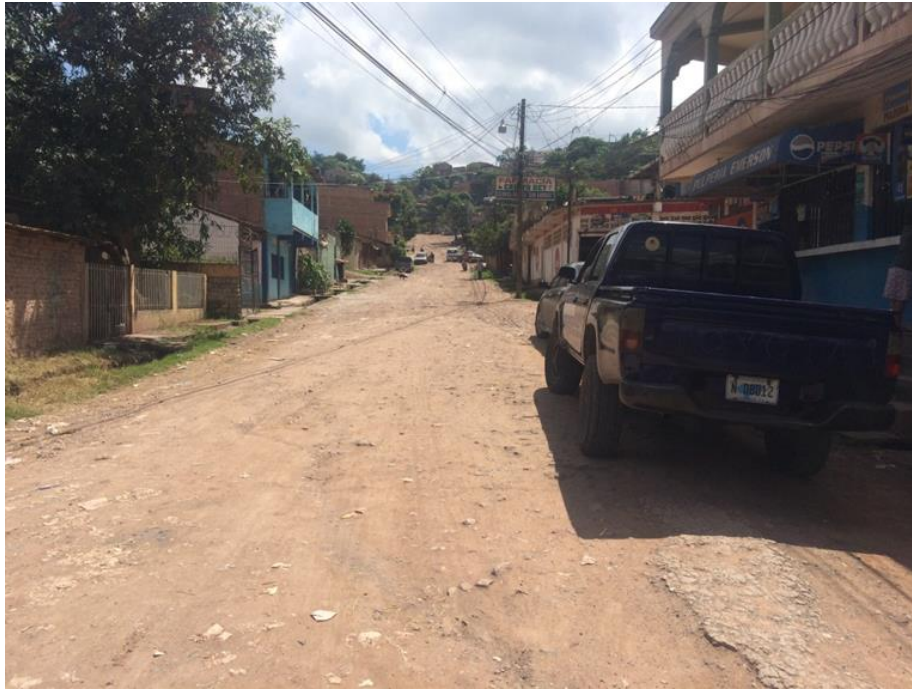
VISTA DE ESTADO ACTUAL DE CALLE A PAVIMENTAR